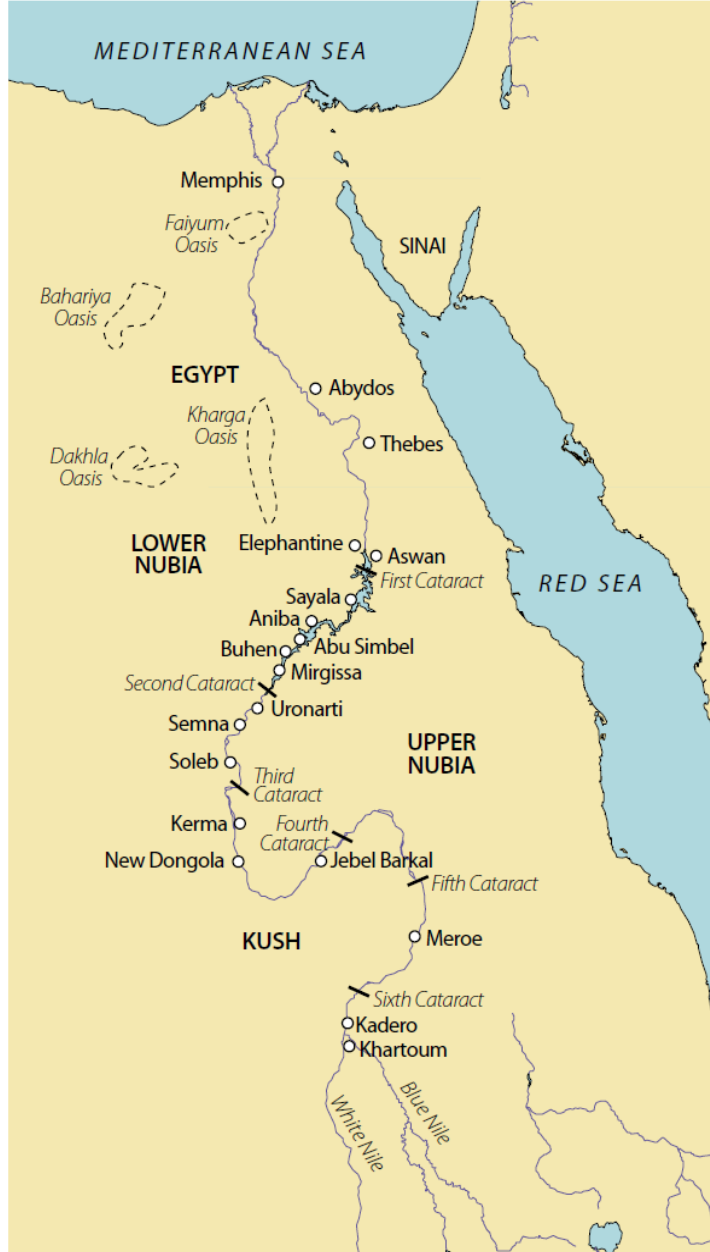
Harita 1: Eski Mısır, Akdeniz kıyıları ile Nil'in 1. Çağlayanı arasında konumlanır. Aşağı Nübye ya da Eski Mısırca adıyla Wawat , 1. ve 2. çağlayanlar arasındaki toprakları kapsar. Yukarı Nübye (Eski Mısır dilinde Kush ) ise, 2. ve 6. çağlayanlar arasındaki coğrafyayı tanımlar (Kaynak: Gilbert, 2008: 64).