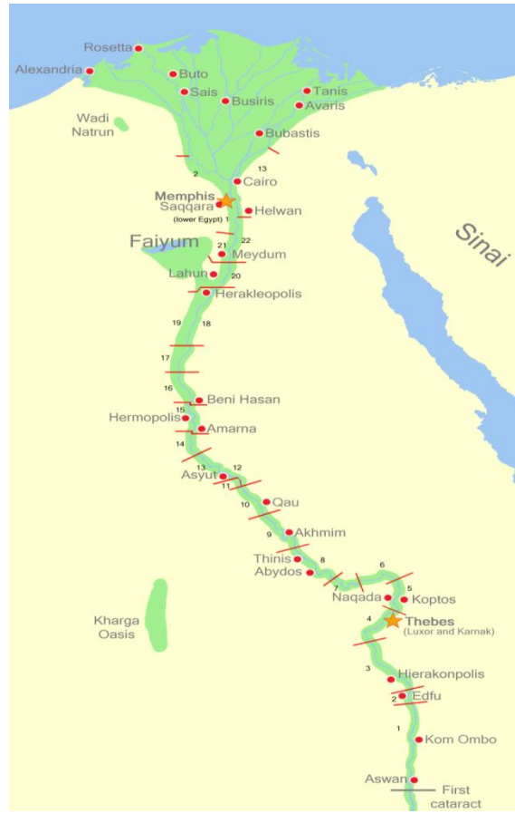
Harita 2: Yukarı-Orta Mısır’da yönetsel birimler ( nomos)... Helenistik dönemlere kadar gelen bölümlenmeye göre, güneyde 22 nomos vardır. 1. Ara Dönem ’deki (2200-2050) iktidar mücadelesi, en güneydeki Hierakonpolis ve Thebes ile kuzeyde (Feyyum Vahası yakınlarında) Herakleopolis arasında geçmiştir. Feyyum’un kuzeyinde Nil Deltası / Aşağı Mısır bulunur. Delta da 20 nomos tan oluşur, ama bunların iktidar savaşında belirleyici rolleri yoktur.

Kökleri sağlam Mısır uygarlığının ara dönem lerde ekonomik, kültürel ve mimari açılarından “çöküş” ( collapse ) yaşadığı sanılmamalıdır. Bu dönemleri, MÖ. 12. yüzyılda Doğu Akdeniz uygarlıklarına (özellikle Yunanistan’a) yıkım getiren ve Karanlık çağları ( dark ages ) başlatan büyük felaketlerle karıştırmamak gerekir. Ancak Mısır Krallığı ortaya çıktığı andan itibaren merkezî bir devlet olduğu için, resmi kayıtları tutanlara göre, kraliyet otoritesinin taşra yönetimleri karşısında zayıf düşmesi ve artı-üründen gelen servete saray yerine taşra beylerinin el koyması bir “kriz” işaretiydi.