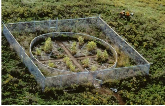
Resim 7. Mel Chin, 1991, Revival Field (Canlandırma Alanı), Pig's Eye Landfill, St. Paul, Minnesota, Tehlikeli atık depolama sahasındaki tesisler ve endüstriyel çitler; yaklaşık 60 x 60 x 9

Sanatçılar doğanın iyileştirilmesi noktasında eserleriyle topluma ışık tutmaktadır. Lynne Hull eserlerinde doğayı yeniden kazanmaya yönelik önerilerde bulunmuştur. Sanatçı, vahşi yaşam alanlarının devamlılığının sağlanmasına yönelik verdiği eserlerle işlevselliği daha çok göz önünde bulundurmuştur. Sanatçı vahşi yaşamın sürdürülebilirliği açısından doğada iyileştirmeler yapmak istemiştir. Sanatçı, "Lightning Raptor Roost" (Resim 8.) adlı çalışmasında yaban hayatında yaşamın devam edebilmesi için göçmen kuşların konaklayabilecekleri alanlar oluşturmuştur (Akkol, 2018, s. 425-426). Bu çalışmada göçmen kuşların yaşamanı sürdürebilmesi, dinlenmesi için bir dizi güvenli alan oluşturulmuştur. Bu çalışma sonrasında yapılan araştırmada pas başlı şahinlerin, baykuş ve kartalların oluşturulan alanlarda yuva yaptıkları kanıtlanmıştır (Aydın ve Zümrüt, 2013: 63). Sanatçı yaban hayatının devamlılığı için göçmen türlerinin kendi oluşturduğu yuva kültüründen faydalanarak, doğadaki organik formlu malzemeleri kullanıp yaban hayatının doğa açısından önemini vurgulamıştır. Sanatçı yapmış olduğu çalışmalarda insan, yaban hayatı, doğa ve yaşadığımız çevredeki hâkim olduğumuz alanların daha korunaklı olması özellikle yaban alanlarındaki yaşayan hayvanlara zarar vermeden bir arada yaşayabilmeyi odağına almıştır. Yaban hayatın yaşam alanlarına estetik dokunuşlar yaparak ekosistemin döngüsüne katkı sağlamıştır.