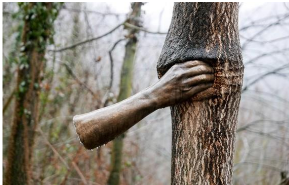
Resim 2. Giuseppe Penone, 1968-2003, Bu Noktanın Dışında Büyümeye Devam Edecek