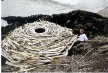
Resim 18. Andy Goldsworthy, "Roof", Arazi Sanatı, 2017