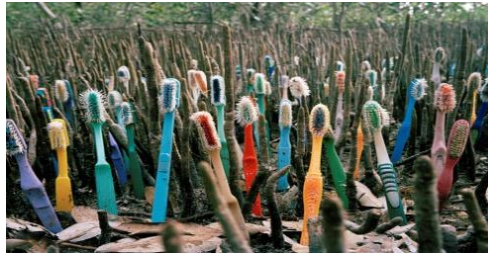
Resim 13. Alejandro Durán, 2014, "Washed Up" Shoots.

Atık sorununa yönelik farkındalığı artırmak amacıyla Alejandro Durán "Washed Up" (Resim 13.) projesini gerçekleştirmiştir. Sanatçı Dünyanın dört bir yanından karaya çıkan renkli plastikleri toplamaya başlamıştır. "Washed Up" Projesi, Meksika'nın Karayip kıyılarına vuran uluslararası atıklar ile gerçekleştirilen enstalasyon ve fotoğraf projesidir. Alejandro Durán'ın öncülüğünde gerçekleşen "Washed Up" projesi fotoğraf, enstalasyon ve video çalışmaları ile tüketimin çevre üzerindeki olumsuz etkilerini aktarmaktadır. Proje; çevresel farkındalık yaratma, tüketim ve atık arasındaki ilişkiyi farklı bir bakış açısıyla ele almayı amaçlamaktadır. Bu proje ile sanatçı, Meksika'nın en büyük koruma alanı ve UNESCO Dünya Mirasında yer alan Sian Ka'an sahilinde karaya vuran, altı kıtada bulunan elli sekiz ülkeden ve bölgeden gelen plastik atıkları toplamıştır. Sanatçı uluslararası atık birleşimini, mekâna özgü tasarımlar ile plastik kirliliği sorununu ele almaktadır (Çınar, 2019, s. 208). Sanatçı kullandığı atık malzemeler ile hem doğal hem de yapay görünümü bir araya getirerek düzenlemeler yapmıştır. Atıkları bölgenin formuna göre düzenleyen sanatçı toplumu plastik atık kirliliği soruna karşı uyarmak için estetik, rahatsız edici ve düşündürücü bir proje ile çevresel farkındalığı artırmaya çalışmıştır.