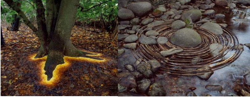
Resim 5. Andy Goldsworthy'un Çevresel Sanat Çalışmaları, İsimsiz

kendiliğindenlik durumuna yönelmiştir (İlden ve Tufan, 2020, s. 73). Doğayı iyileştirmeyi göz önünde bulunduran sanatçı doğanın kendi form ve malzemelerini kaynak olarak kullanmıştır. Doğayı daha estetik bir dille yeniden yorumlayarak yaşanabilir bir doğa konusunda daha bilinçli hareket edilmesine dikkat çekmektedir. Doğanın kendi formlarını kullanarak doğal yaşama verilen zararın boyutunu göstermektedir.