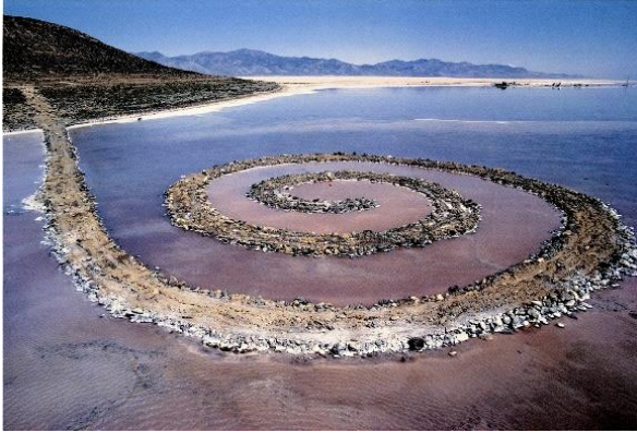
Resim 3. Roberth Smithson, Spiral Jetty, 1970

Teknolojik imkanlarla sanatı ifade aracı olarak kullanan Amerikalı sanatçı Jenny Holzer eserlerinde şiddet, baskı, güç, savaş ve ölüm gibi konuları işlemektedir. Sanatçı ürettiği eserlerinde geniş kitlelere ulaşabilmek adına yazı dili ile teknolojik araçları bir araya getirmektedir. Bu doğrultuda yazıyı sıklıkla halka ulaşmada kullanan sanatçı ele aldığı konuları çarpıcı bir şekilde sunarak farkındalık yaratmaktadır (Cançat, 2018, s. 333). Jenny Holzer, ilk zamlarda led ışıklar ile ürettiği çalışmalarını zamanla projeksiyon kullanarak çoğunlukla New York olmak üzere büyük metropollerin önemli kamusal binalarına yansıtmaktadır. Sanatçı düşüncüyü aktaran görüntü-metinleri iletişimin ana teması olarak kullanmaktadır. Düşüncelerini ışıklı tabelalarla somut hale getiren sanatçı bu yöntemle fikirlerini izleyicilerle paylaşır. Işıklı ekranlarla düşünceleri yansıtan akan kelimeler düşüncelerin bir sesidir. Metinler kullanılarak binalarda ışıklandırma yapılması izleyiciler için ilgi çekici olmaktadır (Karaçalı, 2018, s. 60). Teknolojik araçları çalışmalarında etkin bir şekilde kullanan sanatçı özellikle LED ve büyük projeksiyon