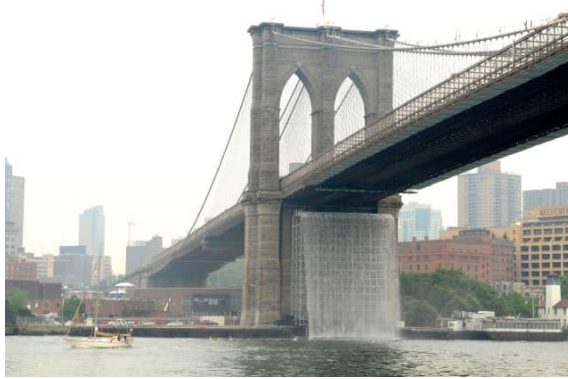
Resim 11. Olafur Eliasson, Newyork City Waterfalls , Brooklyn Köprüsü Newyork, 2008

Olafur Eliasson "New York Şehir Şelaleleri" adlı eserinde doğal olanın yerini hiçbir zaman yapay olanların tutmayacağı mesajını izleyicilere aktarmıştır. Bu eserde sanatçı yapay bir şelale oluşturarak aslında doğal su kaynaklarının önemini vurgulamıştır (Resim 11.) (Yayan ve Han, 2022, s. 27). Sanatçı New York'da dört önemli kamusal alanda doğal bir olayı kentsel tasarıma uygun olarak çevre dostu yöntemlerle kamu sanat projesi olarak tasarlamıştır. Özellikle yenilebilir kaynaklar kullanan sanatçı doğallığın daha değerli olduğunu ve doğal kaynaklara önem verilmesi gerekliliğini izleyiciye aktarmak istemiştir.