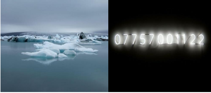
Resim 9. Katie Paterson, Vatnajökull sesi, 2007/8.