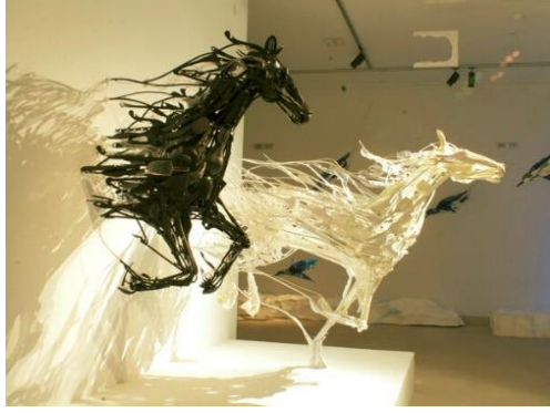
Resim 12. Sayaka Ganz, Emergence II, 2013 Geri kazanılmış plastik nesnelere, boyalı alüminyum ve çelik armatür, donanım, tel, kablo bağları,183cm x 213cm x 213cm.

Çevik, 2021, s. 8-10). Çevre kirliliğın önemli sebeplerinden bir olan atık sorununa dikkat çekmek isteyen sanatçı atıkları malzeme olarak kullanmıştır. Özellikle çevreye en çok zarar veren atıklardan biri olan plastikleri doğadan ayıklayarak figüratif formlardan çeşitli heykeller oluşturmuştur. Bu eserleri galeri mekanı gibi özel bir alanda izleyiciyle buluşturarak çevre konusunda daha duyarlı olunması gerektiğini aktarmıştır.