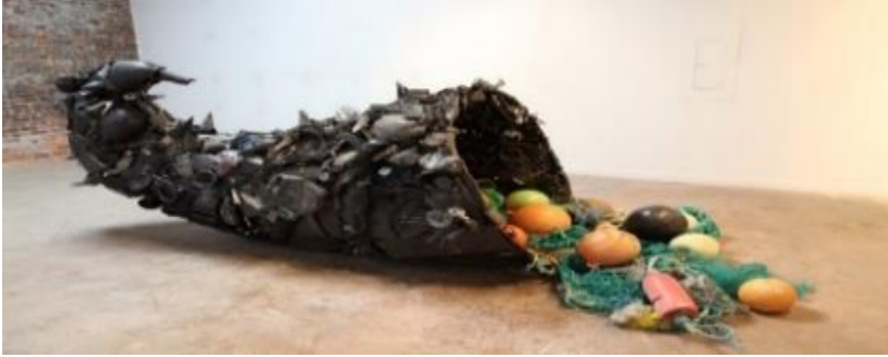
Resim 14. Pam Longobardi, 2014, "Bounty, Pilfered"

okyanusun yükselen sıcaklık seviyelerinden dolayı azalan balık sayısı ve mercanların zarar görmesine karşı başlayan mücadelede farklı alanlarla iş birliğini sağlamaktır. Sanatçı plastik atıklarla mücadelenin sınırlar içerisinde değil tüm dünyada ortak bir şekilde gerçekleşmesi gerektiğini düşünmektedir. (Resim 14.) (Çınar, 2019, s. 213). Denizdeki canlıların zarar görmesini çevre kirliliği ile ilişkilendiren sanatçı plastik atıklarla mücadele etmenin gerekliliği üzerinde durmaktadır. Plastik kirliliğinin deniz canlılarına verdiği zararı göstermek isteyen sanatçı plastik atık kirliliğine çözüm bulunması gerektiğini vurgulamaktadır.