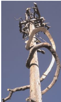
Resim 8. Lynne Hull, Lightning Raptor Roost, 1994

Sanatçılar doğanın iyileştirilmesi noktasında eserleriyle topluma ışık tutmaktadır. Lynne Hull eserlerinde doğayı yeniden kazanmaya yönelik önerilerde bulunmuştur. Sanatçı, vahşi yaşam alanlarının devamlılığının sağlanmasına yönelik verdiği eserlerle işlevselliği daha çok göz önünde bulundurmuştur. Sanatçı vahşi yaşamın sürdürülebilirliği açısından doğada iyileştirmeler yapmak istemiştir. Sanatçı, "Lightning Raptor Roost" (Resim 8.) adlı çalışmasında yaban hayatında yaşamın devam edebilmesi için göçmen kuşların konaklayabilecekleri alanlar oluşturmuştur (Akkol, 2018, s. 425-426). Bu çalışmada göçmen kuşların yaşamanı sürdürebilmesi, dinlenmesi için bir dizi güvenli alan oluşturulmuştur. Bu çalışma sonrasında yapılan araştırmada pas başlı şahinlerin, baykuş ve kartalların oluşturulan alanlarda yuva yaptıkları kanıtlanmıştır (Aydın ve Zümrüt, 2013: 63). Sanatçı yaban hayatının devamlılığı için göçmen türlerinin kendi oluşturduğu yuva kültüründen faydalanarak, doğadaki organik formlu malzemeleri kullanıp yaban hayatının doğa açısından önemini vurgulamıştır. Sanatçı yapmış olduğu çalışmalarda insan, yaban hayatı, doğa ve yaşadığımız çevredeki hâkim olduğumuz alanların daha korunaklı olması özellikle yaban alanlarındaki yaşayan hayvanlara zarar vermeden bir arada yaşayabilmeyi odağına almıştır. Yaban hayatın yaşam alanlarına estetik dokunuşlar yaparak ekosistemin döngüsüne katkı sağlamıştır.