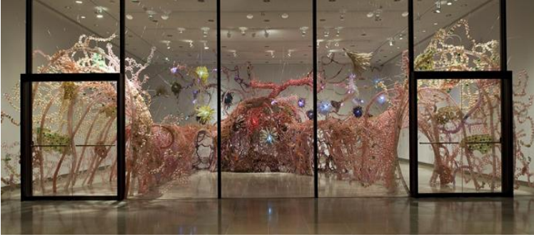
Resim 10. Aurora Robson 'The Great Indoors', 2008.

Olafur Eliasson "New York Şehir Şelaleleri" adlı eserinde doğal olanın yerini hiçbir zaman yapay olanların tutmayacağı mesajını izleyicilere aktarmıştır. Bu eserde sanatçı yapay bir şelale oluşturarak aslında doğal su kaynaklarının önemini vurgulamıştır (Resim 11.) (Yayan ve Han, 2022, s. 27). Sanatçı New York'da dört önemli kamusal alanda doğal bir olayı kentsel tasarıma uygun olarak çevre dostu yöntemlerle kamu sanat projesi olarak tasarlamıştır. Özellikle yenilebilir kaynaklar kullanan sanatçı doğallığın daha değerli olduğunu ve doğal kaynaklara önem verilmesi gerekliliğini izleyiciye aktarmak istemiştir.