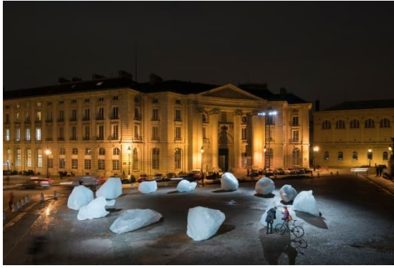
Resim 16. Olafur Eliasson, Ice Watch, 2014

Olafur Eliasson "Ice Watch (Buz Saati)" (Resim 16.) eseriyle günümüzün en önemli çevresel sorunlarından iklim krizi ve küresel ısınmadan dolayı kutuplardaki buzulların erimesine dikkat çekmiştir. Buzulların erimesine dikkat çekmek isteyen sanatçı verdiği eser ile insanları çevre sorunlarıyla yüzleştirmektedir. Sanatçının meydana buz kütleleri yerleştirmesi zamana vurgu yapmaya yöneliktir. Zaman ile eriyen buz kütleleri ile karşı karşıya kalan izleyiciler yüksek etkileşimli bu mekânda çevresel duyarlılığının artmasına katkıda bulunmuştur (Yayan ve Han, 2022, s. 30). Sanatçı izleyicinin çevresel sorunların farkına varmasını ve sorunların çözümünde hızlı hareket edilmesi noktasında zamana vurgu yapmaktadır. Buz kütlelerini yerleştirdiği mekan içerisinde gezen izleyicilerin zaman içerisinde erimenin gerçekleştiğini doğrudan görmesi ile iklim krizi ve küresel ısınma gibi konulara dikkat çekmeye çalışmıştır.