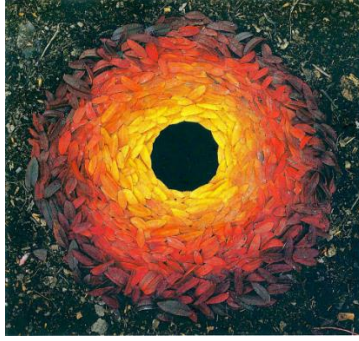
Resim 6. Andy Goldsworthy, Rowan Yaprakları ve Delik, Yorkshire Sculpture Park, 1987

Çevreci sanatın önemli temsilcilerinden olan Mel Chin eserin kendi kendini besleyen bir yapıya sahip olması gerekliliği üzerinde durmaktadır (Oğuz, 2015: 59). Mel Chin 1990 yılında gerçekleştirdiği "Revival Field" (Resim 7.) adlı çalışmasında kirlenmiş bir toprağı arındırmıştır. Rufus L. Chaney adlı bir bilim adamıyla işbirlikçi çalışmasının sonucunda zehirli atıkların olduğu bir alanın etrafını çitlerle çevirerek restorasyon çalışması yapmıştır. Bölgede zehirden arındırma yapan Chaney ve Chin öncelikle yerel ekosisteme uygun metali ve minareli içinde tutabilme özelliğine sahip bitkileri araştırmıştır. Bitkilerle ilgilenilmesi ve alanın bakımının yapılması ile alanın zehirden arındığı tespit edilmiştir. Atıklardan arındırılan bölgede yeniden bir canlanma görülmüştür. (Mamur, 2017, s. 1006). Çevrenin korunması ve atıkların verdiği zararın önüne geçilebilmesi açısından önemli bir sanatçı olan Mel Chin'in çalışma yaptığı alan için yapılan işin tekrarlama ile tüm alan zehirden arındırılmıştır (Oğuz, 2015, s. 59). Doğaya duyarlı bir yaklaşım ile hareket eden sanatçı yapılan çalışma ile iyileşebilme konusuna dikkat çekmiştir (Gürpınar vd., 2023, s. 8). Doğayı iyileştirmeyi amaçlayan sanatçı üretmiş olduğu eserlerinde çevre duyarlılığını ön planda tutmuştur. Bilinçsizce kirlenilen doğayı atıklardan arındırılarak sanatın iyileştirici rolü üzerinde çevreye duyarlı bir yaklaşım benimsemiştir.