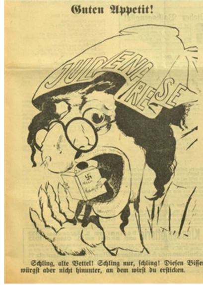
Görsel 6: Altıncı Karikatür

Çalışmada incelenen altıncı karikatür, 28 Ağustos 1932 tarihine aittir. 24 Karikatür, “Afiyet olsun!” başlığını taşımaktadır. Karikatürün altında ise “Yut, yaşlı dilenciler! Sadece yut, yut! Ama sakın bu lokmayı yutma, boğulursun” yazısı bulunmaktadır.