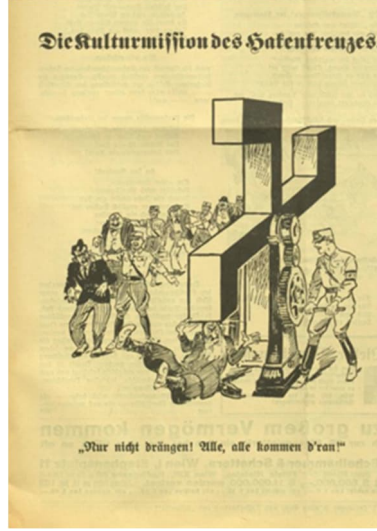
Görsel 8: Sekizinci Karikatür

6 Kasım 1932 tarihine ait olan sekizinci karikatür “Gamalı haçın kültürel misyonu” başlığını taşımaktadır. 26 Karikatürün altında ise “İtişip kakışma olmasın! Herkes, herkes sırasını alacak!” yazısı bulunmaktadır.