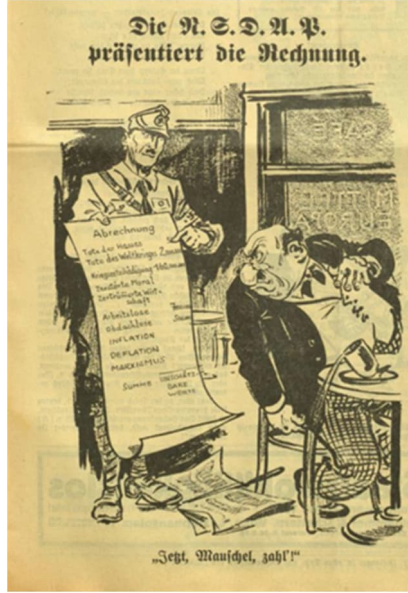
Görsel 4: Dördüncü Karikatür

Çalışmada incelenen dördüncü karikatür, 12 Haziran 1932 tarihine aittir. 22 Karikatür, “N.S.D.A.P. tasarıyı sunuyor” başlığını taşımaktadır. Karikatürün altında ise “Şimdi, Mauschel, öde!” yazısı bulunmaktadır.