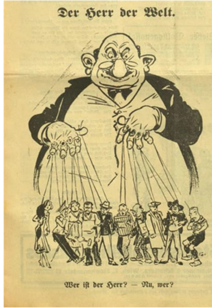
Görsel 5: Beşinci Karikatür

Çalışmada incelenen beşinci karikatür, 19 Haziran 1932 tarihine aittir. 23 Karikatür, “Dünyanın Efendisi” başlığını taşımaktadır. Karikatürün altında ise “Efendi kimdir? - Peki kim?” yazısı bulunmaktadır.