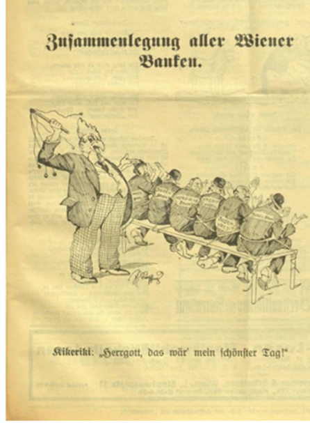
Görsel 1: Birinci Karikatür

Anlatımsallık işlevinde karikatürde Kikeriki'nin temsili olan başı horoz şeklinde, takım elbise içerisinde, elinde kırbaç olan bir temsil resmedilmektedir. Kikeriki'nin temsili elindeki kırbaç, önünde bir sıraya dizili şekilde oturan ve birbirine bağlı olan altı kişiye yönlendirmektedir. Bu kişilerin sırt kısımlarında sırasıyla “Amstel Bank, Boden Bank, Nordische Bank, Kredit Anstalt, Boden Kredit ve Bosel Bank” yazmaktadır. Karikatürde bu altı kişinin dördünün giydiği şapka ve saçlarındaki lüleler, bu kişilerin Yahudi olduğu mesajını vermektedir.