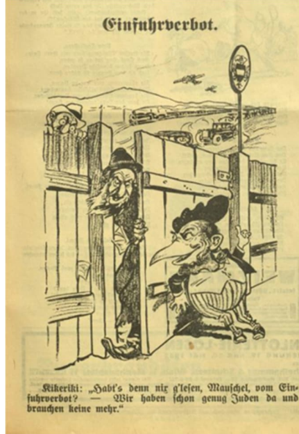
Görsel 3: Üçüncü Karikatür

Çalışmada incelenen üçüncü karikatür, 24 Nisan 1932 tarihine aittir. 21 Karikatür, “İthalat yasağı” başlığını taşımaktadır. Karikatürün altında ise “Kikeriki: İthalat yasağıyla ilgili yazıyı okumadın mı Mauschel? - Burada zaten yeterince Yahudi var ve daha fazlasına ihtiyacımız yok” yazısı bulunmaktadır.