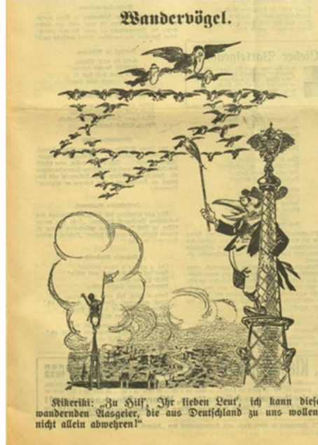
Görsel 7: Yedinci Karikatür

Çalışmada incelenen yedinci karikatür, 11 Eylül 1932 tarihine aittir 25 ve “Göçmen Kuşlar” başlığını taşımaktadır. Karikatürün altında ise “Kikeriki: ‘Yardım edin’ sevgili insanlar, Almanyadan bize gelmek isteyen bu başıboş akbabaları tek başıma savuşturamıyorum!” yazısı bulunmaktadır.