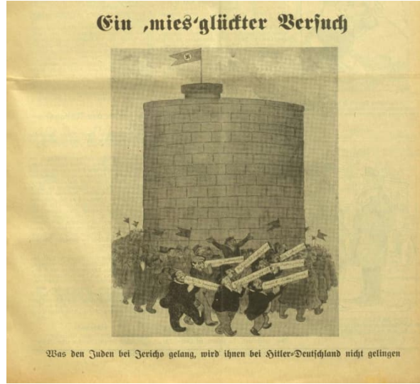
Görsel 10: Onuncu Karikatür

Çalışmada incelenen onuncu karikatür, 21 Mayıs 1933 tarihine aittir. 28 Karikatür, “Kötü bir ziyaret” başlığını taşımaktadır. Karikatürün altında ise “Yahudiler Eriha’da başardıklarını Hitler Almanyası’nda başaramayacaklar” yazısı bulunmaktadır.