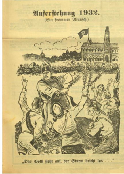
Görsel 2: İkinci Karikatür

Anlatımsallık işlevinde karikatürde Hıristiyan bir din adamı kıyafeti içerisindeki bir kişinin etrafında zeytin dallarına benzer dallarla duran bir grup kişi resmedilmektedir. Karikatürdeki gurubun içerisindeki kişilerin birinin arkasında “özgürlük” yazarken, birisinin şapkasında ise gamalı haç bulunmaktadır. Grubun karşısında ise üstünde altıgen şeklinde bir bayrağın asılı olduğu bir bina ve bina çevresinde barikat yer almaktadır. Barikat etrafında da bir tarafında “Yahudi basını” yazılı bir gurup insan bulunmaktadır.