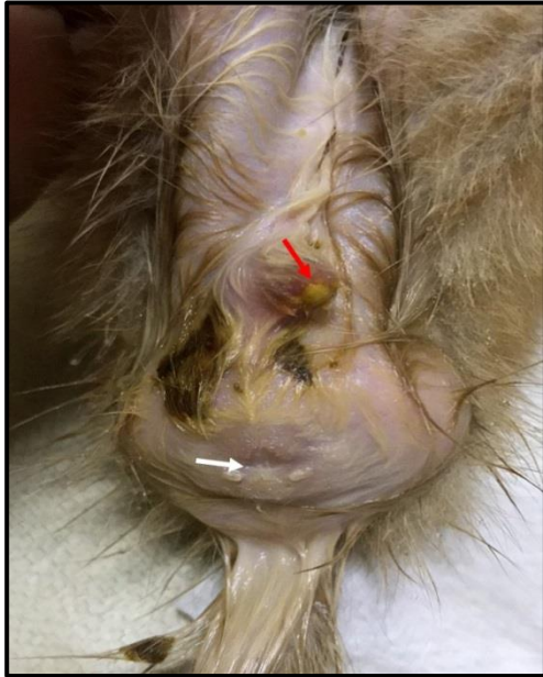
Şekil 1. Atresia ani (beyaz ok) ile birlikte prepisyum ucundaki fekalüri (kırmızı ok) varlığının görünümü.

Melez ırk, 6 haftalık, erkek bir kedi, annesinin yediği kuru mamadan yedikten iki gün sonra halsizleştiği ve dışkılamakta zorlandığı fark edilerek kliniklerimize getirildi. Genel muayenede, pulzasyon 100/dk, respirasyon 20/dk, kapillar dolum süresi 1 sn, mukozal membran rengi ve lokal lenf yumrularının normal olduğu belirlendi. İncelemede, kedide sık aralıklı tenesmus, kaudal abdomende de orta derecede şişkinlik saptandı. Perineal bölge incelendiğinde, anüsün olmadığı (atresia ani), anüs yerinde ince perde şeklinde bir yapının bulunduğu ve ıkınma sırasında anal refleksin mevcut olduğu, prepisyumdan ise koyu sarı renkte bir içerik geldiği tespit edildi (Şekil 1).