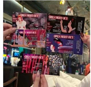
Görsel 1-3. 05.01.2022 parti biletleri; 24.10.2023 parti biletleri; 08.03.2024 parti biletleri.