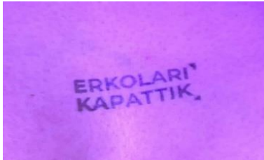
Görsel 8. Girişte basılan kaşe.

Parti başlamadan yaklaşık olarak yarım saat erken gelen kadınlar öncelikle makyajlarını yaptırmaktadırlar. Bu esnada sırada bekleyen kadınlar birbirlerine iltifatlar etmekte, makyaj tüyoları vermekte ve çeşitli konularda sohbet edip samimiyet kurmaktadır. Geç katılım sağlayacak olan kadınlar için saat 23.00'a kadar ücretsiz simli makyaj hizmeti devam ettirilmiştir, gelen kadınlar önce makyajlarını yaptıırıp sonra partinin yapılacağı alana geçmiştir. Makyajı biten kadınlar biletlerini göstererek ve giriş çıkışlarda sorun yaratmaması adına bileklerine veya görünür olan herhangi bir bölgeye kaşe bastırarak partinin gerçekleştirileceği alana geçiş yapmışlardır. Kaşede yazı olarak, sosyal medyada özellikle kadınlar tarafından erkeklerin yaptıkları olumsuz davranışlara yönelik mizahi amaçlı kullanılan ve popüler hâle gelen “erkolar (erkekler) kapatılsın” söylemine karşılık olarak seçilen “erkoları kapattık” cümlesi yer almış, bu durum üzerine sosyal medyada “erkolar ilk Eskişehir’de kapatıldı” şeklinde mizahi paylaşımlar yapılmıştır.