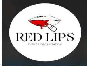
Görsel 4. Ekip logosu.

geldiğimde hepimizin birbirimizden çok farklı olduğumuzu gördüm. Kimisi öğrenci, kimisi iş kadını, kimisi yeni mezun, kimisi de sadece ‘partileyen’ on iki kadını bir araya getiren amaç, erkeklerin bakışlarından uzakta kız kıza bir gece geçirmektir. Ön tanışma faslından hemen sonra ülkede kadın olmanın zorluklarından ve en temel ihtiyaçlardan biri olan eğlenmenin bile rahatça gerçekleştirilememesinden konuştuk. Bu sohbetin ardından kadın kadının yurdudur diyerek birbirimizi sahiplendik, planlama kısmına geçtik. İçimizden bir kişi tasarım konusunda yetenekli olduğunu ve afişi tasarlayabileceğini söyledi ve tasarım işini devraldı. Geriye kalan işlerde iş bölümü yaptık örneğin kamera önünde rahat olabilen kişi tanıtım için çekilen videolarda oynadı. Kimisinin çevresi genişti reklam yaptı ve böylece ekibimizi kurmuş olduk. Ekibin ismine karar verirken önceliğimiz kadınlığı simgeleyen bir unsur olmasıydı. Bu nedenle Red Lips (kırmızı dudaklar) adında karar kıldık.” (KK-1).