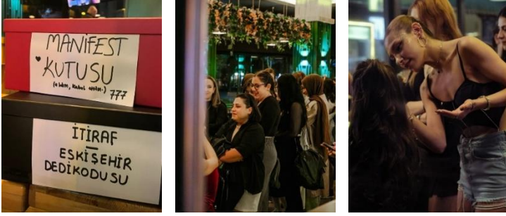
Görsel 5-7. Sırasıyla, kutular, makyaj sırası ve makyaj esnası.

aktiviteleri de partimize eklemeye özen gösteriyoruz. Örneğin parti girişinde ücretsiz simli makyajlar yapmaları için makyaj stüdyosuyla anlaşılıyor. Aynı zamanda parti içerisinde aktivite olması amacıyla mekânın girişine manifest, itiraf ve dedikodu kutuları yerleştiriyoruz. Bu kutuların içine kadınların anonim olarak evrenden isteklerini, itiraflarını ya da dedikodularını yazmalarını istiyoruz.” (KK-1).