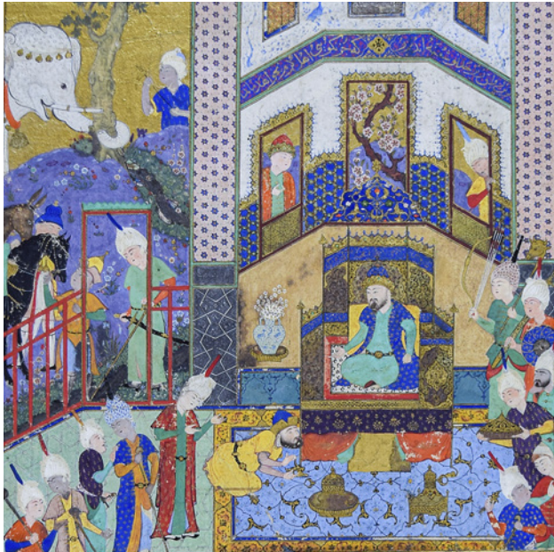
17 TSK H.2154/144b'den detaylar