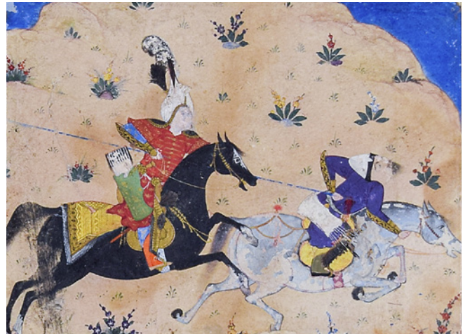
5 TSK H.2154/53a'daki eyer detayı örnekleri