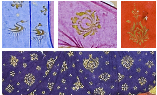
23 TSK H.2154/85a, 85a, 85a ve 144b'deki kaftan detayları