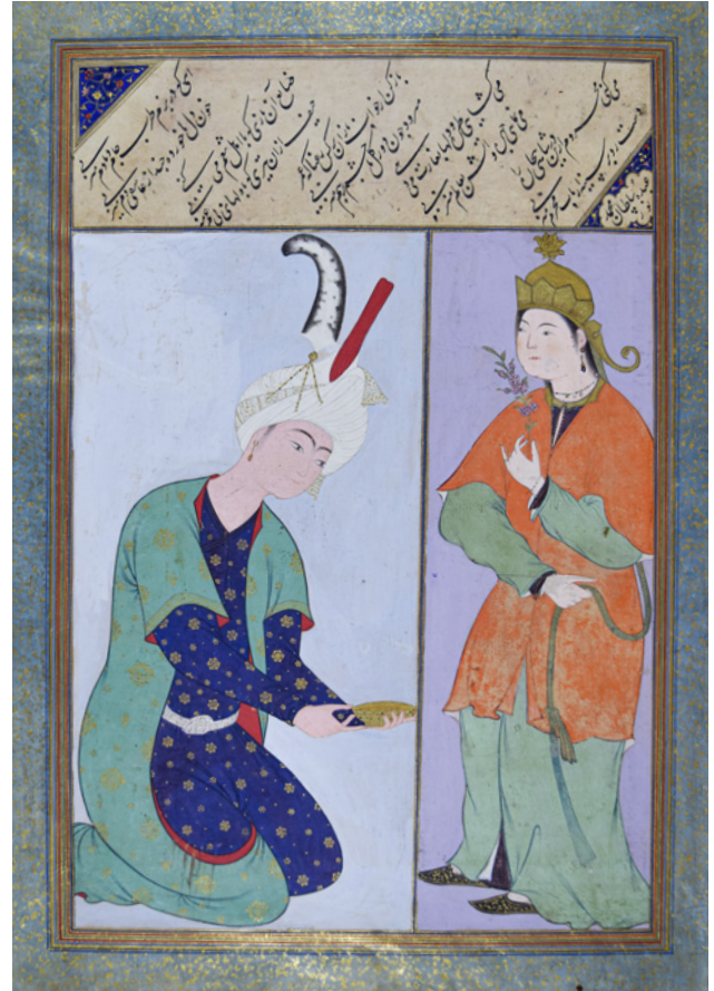
7 TSK H.2154/74a

Bu çaresiz şahı bu kapıdan mahrum ediyorsun, mahrem dostların göğsüne red elini uzatıyorsun.”