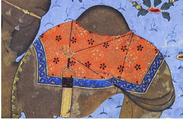
27 TSK H.2154/140b'deki mahfe örtüsü detayı

Eyer örtüsü; “gâşiye”, 37 “şaprak” 38 “çultari”, “çultar”, “çaprak” 39 gibi isimlerle de anılmıştır. Atlarda eyerin altına konan örtüye “eyer örtüsü” denilmektedir. Aynı örtünün deve hörgücüne takılan mahfe- lin altına konulanına ise “mahfe örtüsü” denmiştir.