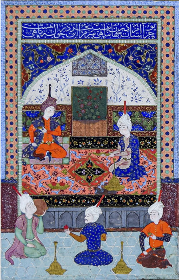
6 TSK H.2154/87b'deki halı detayı

TSK H.2154/87b numaralı sayfanın üst kısmında “Dünyada senin eşîğinden başka sığmacak yerim yoktur. Başımın bu kapıdan başka başvuracağı yer yoktur” yazılıdır. Hafızın bu gazeli Victoria and Albert Müzesi'nde muhafaza edilen Şah Tahmasb dönemine ait bir halının üzerinde de görülmektedir. 23