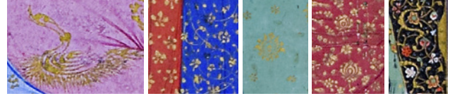
22 TSK H.2154/85a, 7a, 74a, 1b ve 53a'daki kaftan detayları