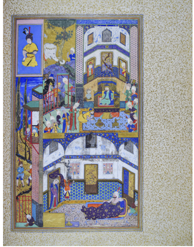
16 TSK H.2154/144b

Dört tabloyu birleştiren TSK H.2154/144b numaralı sayfanın sağ alt köşesinde Firdevsî'nin Şehnâme 'sinden bir sahne görülmektedir. 26 Zengin tasarımı bu sayfa, iç ve dış mekân tasvirleriyle albüm dâhilinde rastlamadığımız bir örnek olup yirmi sekiz figürü, duvar süslemeleri, hayvan ve bitki tasvirleri ile dikkat çekmektedir. Safevî döneminin toplumsal yapısı ve mekânsal tasarımına ışık tutması açısından oldukça kıymetlidir.