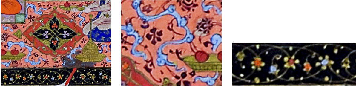
24 TSK H.2154/87b'deki halı detayı

Halı süslemesinde İran halılarının ana formunu oluşturan madalyon şeması, halıların merkezlerinde kullanılmıştır. TSK H.2154/87b numaralı sayfadaki halının bordüründe bitkisel motifler, ana zemininde ise bulut motifleri yoğunluktadır. TSK H.2154/135a numaralı sayfada görülen halının zemininde bitkisel kompozisyon hâkimdir. Genel olarak, hatâyî grubu bitkisel motifler, rûmî ve bulut motifleri kullanılmıştır.