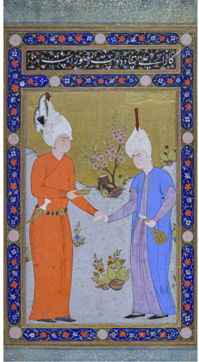
14 TSK H.2154/138b