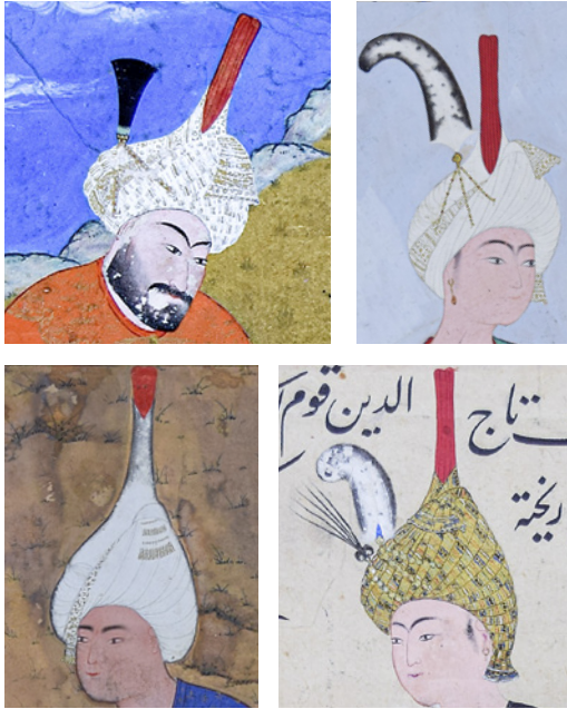
18 TSK H.2154/1b, 148a, 74a, 121b ve 134b'deki taç detayları

Safevî tacının bilinen ilk tasarımı, Şeyh Haydar'a aittir. Şeyh Haydar, 1488'de Şirvan'a düzenlenen seferden evvel rüyasında İmam Ali'yi görmüş ve akabinde her biri bir Şii imamını temsil eden on iki uçlu kızıl başlığı tasarlamıştır. Safevî müverrihlerinin aktardıklarına göre, Doğu Anadolu ve Kuzey Suriye'deki Safevî davasına gönül vermiş Erdebil şeyhleri için söylenen "Kızılbaş" lafzı, Safevîlerin Türkmen olmayan destekçilerine de verilerek genişletilmiş 27 ve bu ünvan âdeta şeref nişanesi olmuştur.