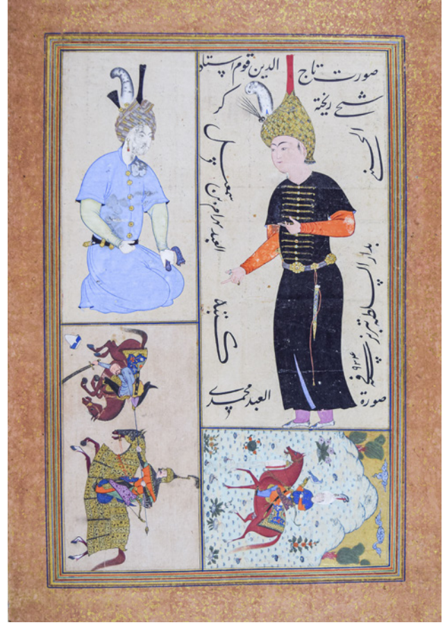
11 TSK H.2154/134b

TSK H.2154/134b numaralı sayfanın sağ üst köşesinde yer alan Safevî saray mensubunun etrafında yazılar görülmektedir. Bu alanda sanatçı Muhammed'in ismi, sayfanın sol üst ve alt kenarında Behrâm Mirza'nın 1527-1528 yıllarında eklediği "saltanat evi" ifadesi, sağda ve solda ise Behrâm Mirza'nın isimleri yazılıdır. 24