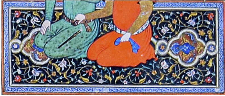
25 TSK H.2154/135a'daki halı detayı