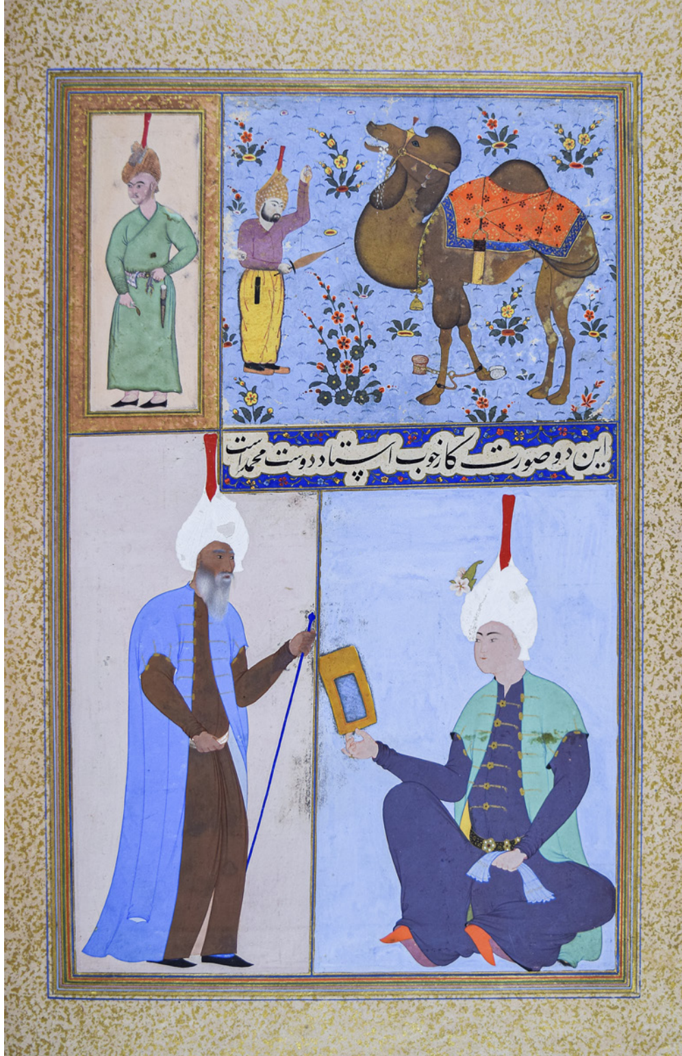
15 TSK H.2154/140b

figürlerinin dışında bir zanaatkâr tiplmesi olarak önem arz etmektedir. Albümde karşımıza çıkan tek deve figürünün üstündeki kumaş da dikkat çekicidir.