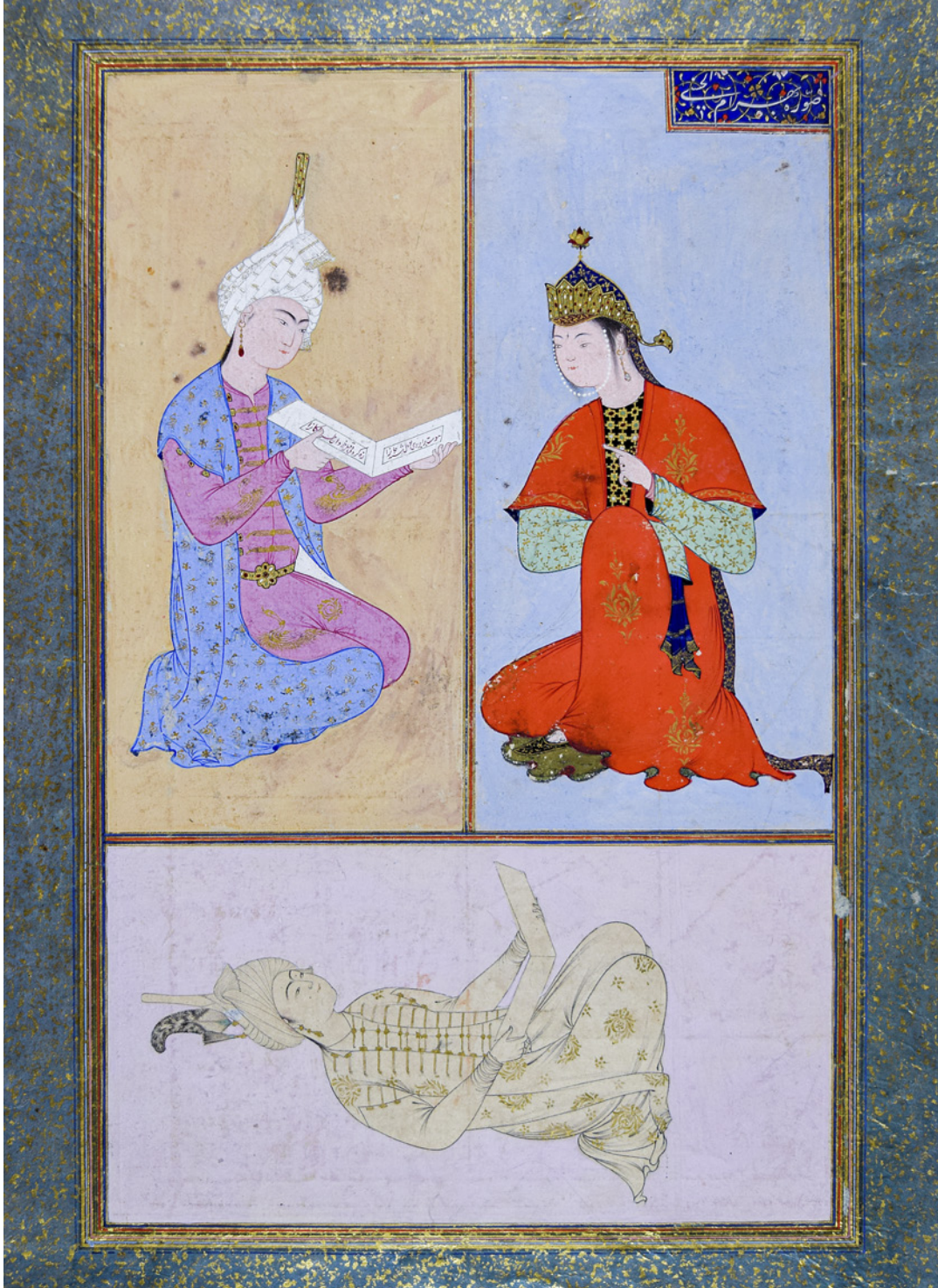
8 TSK H.2154/85a

görülen motifler uyum içindedir. Sayfada ayrıca hayvansal figürler (kuğu) ve hatâyî grubu bitkisel bezemeler yer almaktadır.