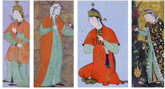
21 TSK H.2154/74a, 121b, 85a ve 53a'daki kaftanlar

Behrâm Mirza Albümü 'nün erkek figürlerinde genellikle iki farklı kaftan modeli karşımıza çıkmaktadır. İlki, uzun kolun omuz kısmından kesik açılarak iç kolun çıkartılıp uzun kumaş parçasının sarkıtıldığı hil'atlardır, bunlar saltanat üyelerine özel hazırlanmıştır. 34 Diğer kaftan modeli ise, TSK H.2154/138b örneğinde görüldüğü gibi, kruvaze yakalı ve tek parçadır. TSK H.2154/1b'de kolun içinde kaldığı kaftan örneği görülmektedir. Kaftanlar genellikle kemer veya kuşak ile tamamlanmıştır. Kadın figürlerinde gösterişsiz, kısa kollu, önden düğme veya kemer gibi aksesuarların kullanılmadığı, tek parça kaftanlara rastlanmaktadır. Turuncu rengi kaftanlar da yoğun kullanılmıştır.