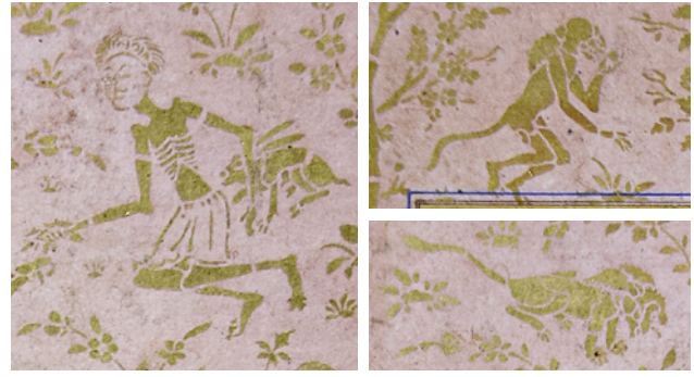
2 TSK H.2154/1b'de sayfa kenar süslemelerine örnekler

vahiy hâline geldi, günümüzde uygulanan resim tarzı onun icadıdır. ” 17