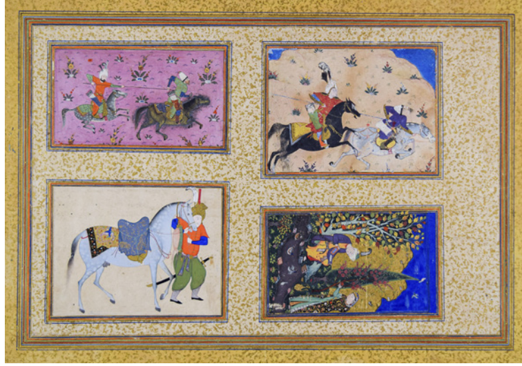
4 TSK H.2154/53a

nehir kenarındaki tasviridir. Ana zeminde krem rengi üzerine zerefşan uygulanmıştır.