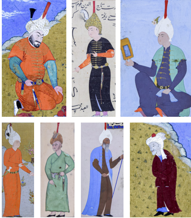
18 TSK H.2154/1b, 138b, 140b, 140b, 148a, 138b, 140b ve 1b'deki kaftanlar

Kaftanlarda sıklıkla hatâyî grubu bitkisel motifler görülse de başta kuğu olmak üzere hayvan figürlerine de zaman zaman rastlanmaktadır.