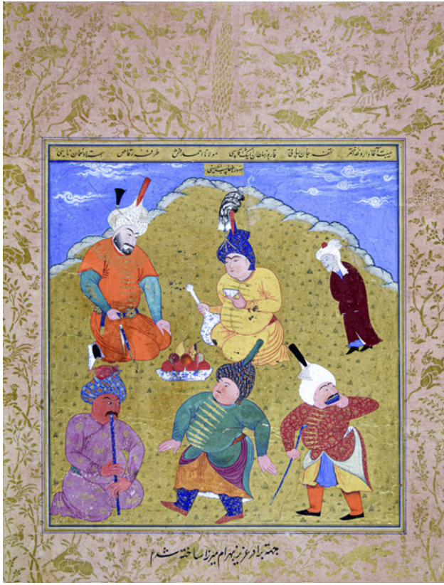
1 TSK H.2154/1b

da bulunduğu İlhanlı ve Celâyirli nakkaşların isimlerini içermektedir. 13 Miraçnâme sahneleri ve Orta Asya üslup özellikleri barındırdığından dolayı ayrıca kıymetli olan eserin Dost Muhammed tarafından yazılmış önsözünden, Şah Tahmasb'ın kardeşi Behrâm Mirza adına bir albüm hazırlanması emrini verdiği 14 ve Behrâm Mirza'yı Timurlu devlet adamı Baysungur ile karşılaştırdığı 15 anlaşılmaktadır. 16 H.951'de yer alan Behrâm Mirza Albümü 'nün mukaddimesinde Dost Muhammed'in şu açıklamaları yazılıdır: “Sanatımı babasından öğrenen Usta Ahmed Mûsâ ile vesayetin görüntüsü