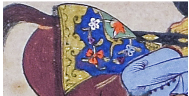
30 TSK H.2154/134b'deki eyer örtüsü detayı