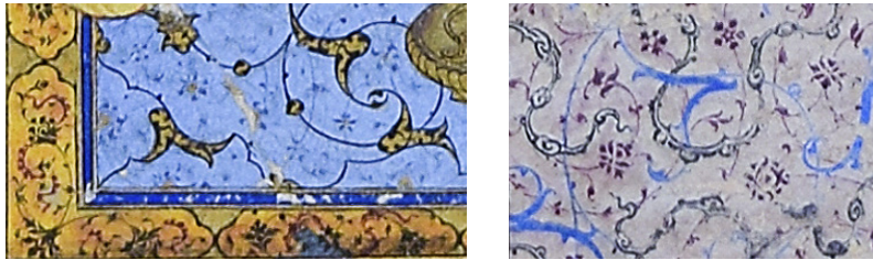
26 TSK H.2154/144b'deki halı detayı