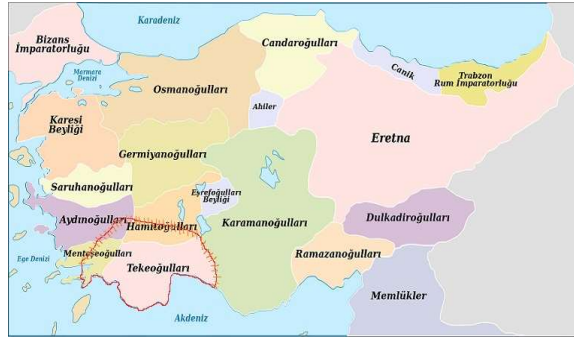
Şekil 1. Teke Yöresi Sınırları

Toplumsal yaşamın doğal bir çıktısı olarak Türkmen/Yörük kültüründe sanatsal değer üretme yaygın olarak görülür. Tarihsel süreçte göçebe Türkler göç yollarında karşılaştıkları kültür unsurlarını kendi kültürleri içinde sentezleyerek kullanmışlardır 9 . Bu olgu, üretilen sanatsal değerlerin çeşitlenmesine de imkân sağlamıştır. Kültürel değişim ve dönüşüme neden olan içsel ve dışsal kaynakların etkisiyle üretilen sanatsal değerler çeşitlilik kazanmış ve Türkler yerleşik yaşama geçişten sonra da sanatsal değer üretmeye devam etmiştir.