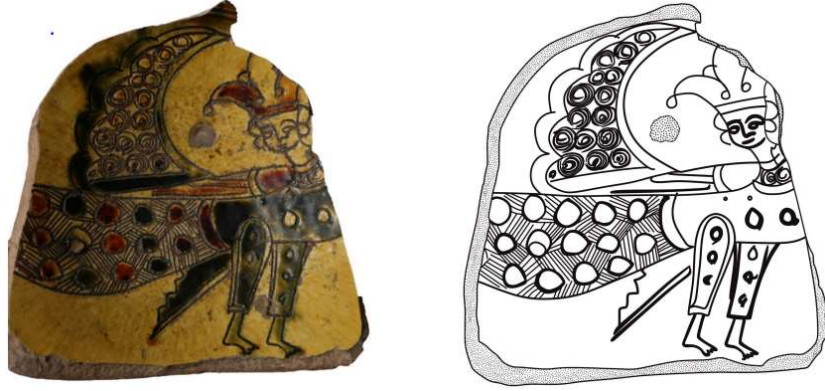
Görsel 30. Konya Karatay Medresesi Çini Eserler Müzesi 1254 Envanter numaralı kayıtlı Siren figürü. (Özdemir, 2021, s. 126).

Huand Hatun Hamamının duvarlarını kaplayan sır altı tekniğindeki çiniler, gerek form, gerekse desen, renk ve üslup açısından Kubad Abad Sarayı figürlü çinilerinin paralelleridir ve onlar gibi zengin bir repertuar sunarlar: Köpek ve pantere benzer dört ayaklı hayvanlar; yırtıcı ve avcı kuşlar; tavus kuşu, ördek, kaz gibi av hayvanları; hayat ağacının yanında simetrik kuşlar; çift başlı kartal ve Siren gibi fantastik yaratıklar; yazılar ve bitkisel desenler Kubad Abad sarayında, sekiz kollu yıldız çinilerde işlenen tasvirlerin benzeridir. (Arık, Oluş, 2007, s. 256).