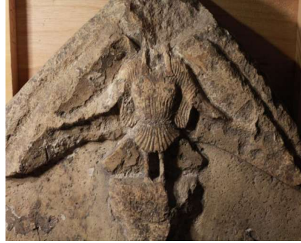
Görsel 35. Sirenli Alınlık, B. 289 Alınlığı, Sol sfenks baş detayı the British Museum (Karademir, 2016, s, 214).