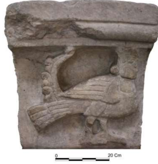
Görsel 31. Konya Kalesi'nde bulunan ve İnce Minare Taş ve Ahşap Eserler Müzesi'nde sergilenen 886 envanter numaralı siren. (Özdemir, 2021, s. 127).

Karatay Medresesi Çini Eserler Müzesi'ndeki siren/harpi tasviriyle benzer bir örnek, (Görsel 31) Konya Kalesi'nde bulunan ve İnce Minare Taş ve Ahşap Eserler Müzesi'nde sergilenen 886 envanter numaralı siren/harpi figürlü levhada görülmektedir. Bu levha, bir kemerin kilit taşı olduğu düşünülen 56x60 cm ölçülerindedir. Yüksek kabartma tekniğiyle işlenmiş olan levhanın cephesinde, siren/harpi figürü bulunur. Figürün gövdesi, başı ve ayakları profilden verilmiş olup, kıvrımlı saçlar, iri badem gözler, küçük burun ve küçük ağız gibi detaylarla betimlenmiştir. Kanat ayrıntıları çizgisel olarak tasvir edilmiş olup, gövdeden yukarıya doğru uzanarak, volüt şeklinde sonlanan ikinci bir kanadı da mevcuttur. Ayaklar ve pençeler ise kabaca işlenmiştir. (Özdemir, 2021, s. 127.).