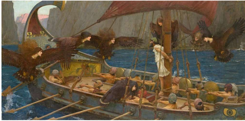
Görsel 20. JW Waterhouse British, Ulysses ve Sirenler, Victoria Ulusal Galerisi, Melbourne. https://www.ngv.vic.gov.au/essay/j-w-waterhouses-ulysses-and-the-sirens-breaking-tradition-and-revealing-fears-2/#10 Erişim Tarihi: 12.03.2024.