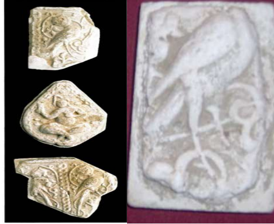
Görsel 25. Siren figürü bezemeli alçı levha. Konya, Alaaddin (Kılıç Arslan) Köşkü. Türk İslam Eserleri Müzesi. Bağdaş kurmuş kadeh tutan figür ve iki siren. Alçı levha parçası, Konya, Alaaddin (Kılıç Arslan) Köşkü. Türk İslam Eserleri Müzesi.

Uygur sanatında Siren, minyatürler ve seramiklerde sıkça tasvir edilmiştir. Selçuklular döneminde ise taş, alçı, ahşap, maden gibi çeşitli malzemelerle yapılan bezemelerde Siren figürüne sıkça rastlanmıştır. Örneğin, Konya Kılıç Arslan Köşkü'nün alçıları ve 1. Alaaddin Keykubad'ın yaptırdığı Konya surlarının taş kabartmalarında Siren figürüne sıkça yer verilmiştir.