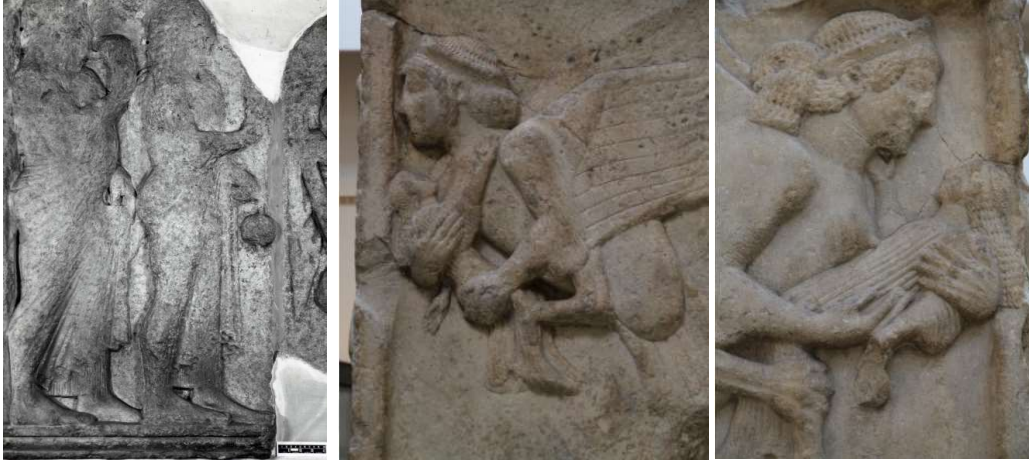
Görsel 37. Harpi Anıtı, Güney, Sol Siren of the British Museum. (Karademir, 2016, s, 198).