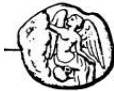
Görsel 40. Siren Gümüş Sikke. (Taylor, 2013, s, 185).

Sirenli Alınlık, (Görsel 35-36) Ion başlıklı bir sütunun merkezinde yer alan ve kanatları iki yana açık bir Siren figürünü içeren Üçgen formundaki bir alınlıktır. Sütunun her iki yanında, ellerinde birer asa tutan ve karşılıklı olarak oturan iki insan figürü bulunmaktadır. Sağ taraftaki figür, uzun kıvrık sakallı bir erkek figürüdür ve sakalı, burun şekli, giysi düzeni ve vücut duruşu bakımından yaşlı bir figürle benzerlik göstermektedir. Sol taraftaki figürün cinsiyeti, aşınmış kafa yapısı nedeniyle tartışmalıdır, ancak figürün sakalsız olduğu gözlemlenmiştir. Her iki figür de bir veda sahnesini andırır şekilde karşılıklı olarak tasvir edilmiştir. Siren figürü, Harpi Anıtı'ndaki Sirenlere tipolojik olarak benzerdir ve giysileri ve vurgulanan kadın göğüsleriyle ölümü sembolize etmektedir. Bu nedenle, Sirenli Alınlık'taki kanath yaratığın varlığı, yapısal olarak mezar işlevi görebileceği düşüncesini akla getirmektedir. Figürlerin ayakları kayıptır ve etek bitimleri verilmemiştir, bu da bloğun alt kısmının eksik olduğunu göstermektedir. Bloğun altında kabartmalı bir blok olabileceği düşünülmektedir ve figürlerin ayak kısımlarının işlendiği varsayılmaktadır. Ayrıca, bloğun arkası da işlenmiştir ve bir başka bloğa yatay olarak bağlandığını düşündüren kenet yuvalarına sahiptir. Bu bulgular, bloğun orijinal kontekstinden kesilerek çıkarılmış olabileceğini ve ikinci bir kullanımda bu birleştirme yuvalarının açılmış olabileceğini öne sürmektedir. (Karademir, 2016, s, 72, 144).