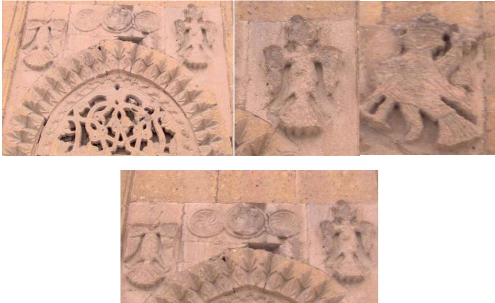
Görsel 32-33-34. Niğde Hüdavent Hatun Türbesi Sirenleri.

Karatay Medresesi Çini Eserler Müzesi'ndeki siren/harpi tasviriyle benzer bir örnek, (Görsel 31) Konya Kalesi'nde bulunan ve İnce Minare Taş ve Ahşap Eserler Müzesi'nde sergilenen 886 envanter numaralı siren/harpi figürlü levhada görülmektedir. Bu levha, bir kemerin kilit taşı olduğu düşünülen 56x60 cm ölçülerindedir. Yüksek kabartma tekniğiyle işlenmiş olan levhanın cephesinde, siren/harpi figürü bulunur. Figürün gövdesi, başı ve ayakları profilden verilmiş olup, kıvrımlı saçlar, iri badem gözler, küçük burun ve küçük ağız gibi detaylarla betimlenmiştir. Kanat ayrıntıları çizgisel olarak tasvir edilmiş olup, gövdeden yukarıya doğru uzanarak, volüt şeklinde sonlanan ikinci bir kanadı da mevcuttur. Ayaklar ve pençeler ise kabaca işlenmiştir. (Özdemir, 2021, s. 127.).