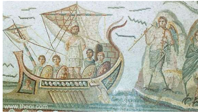
Görsel 2. Odysseus ve Sirenler, Dougga'dan Greko-Romen mozaïği Bardo Ulusal Müzesi, Tunus https://www.theoi.com/Gallery/Z41.1B.html Erişim Tarihi 12.03.2024