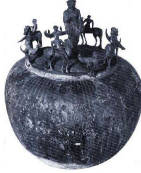
Görsel 19. Capua'dan Sirenli ve bronz kül vazosu (Öpghaffen, 2009, s. 52).

figürü bulunmaktadır. Siren'in uzun saçları vardır. Geniş çelengi ve sırt sırta kanatları vardır ve bir kayışla tutturulmuş mızrapla lir çalmaktadır. Önünde, bir asaya yaslanmış, geniş çelenkli, sakallı bir erkek figürü bulunmaktadır.