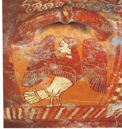
Görsel 1. Hydria: siren. Yunan, Geç Korint dönemi, (135), Staatliche Kunstmuseen Dresden. (Tsiafakis, 2004, s. 75).

Siren figürü, M.Ö. 8. Yüzyıl sonu ve 7. Yüzyılın başı itibaren Yunan Sanatında sfenksler ve grifonlar ile birlikte bronz kapların üzerine veya vazo resimlerinde karşımıza çıkar. Siren figürü, antik çağda dekoratif bir unsur olarak çeşitli yüzeylerde görülmüştür, özellikle Kiklad Adaları'ndaki Yunan atölyelerinde popüler bir figürdür. Yunan atölyeleri arasında, Klazomenia, Güney İtalya ve Sicilya atölyeleri dışında, sirenlerin cinsiyeti konusunda belirgin bir ayırım yapılmamıştır. Ancak, sakallı veya sakalsız sirenlerin varlığı, en eski Yunan sirenlerinin kadın veya erkek olabileceğini göstermektedir. Sirenlerin, erken dönem Yunan sanatını etkileyen sakalsız veya sakallı kuş temsilleri ile ilişkisi, her iki cinsiyete de ihtiyaç duyulduğu genel inancıyla birlikte, bu çifte temsilin nedenlerine ışık tutabilir. Beşinci yüzyıla gelindiğinde, sirenlerin insan kısmının hakimiyeti giderek artmış ve Homeros'un ismi ile insan başlı kuşların sirenlerle ilişkilendirilmesi, altıncı yüzyılın ortalarında Attika vazolarındaki yazıtlarla doğrulanmıştır. Sirenler, özellikle yeraltı dünyasıyla olan ilişkileri ve ölümün bir belirtisi olarak yorumlanmış olsalar da popülerlikleri ve tapınaklara sunulan adaklar gibi unsurlar, yalnızca ölümle ilişkilendirilen tatsız varlıklar olarak düşünülmeyle açıklanamaz. Sirenlerin melodik şarkıları, insanlara ölüm sonrası yaşamın umut verici bir mesajını iletebilir. (Tsiafakis, 2004, s. 74-75).