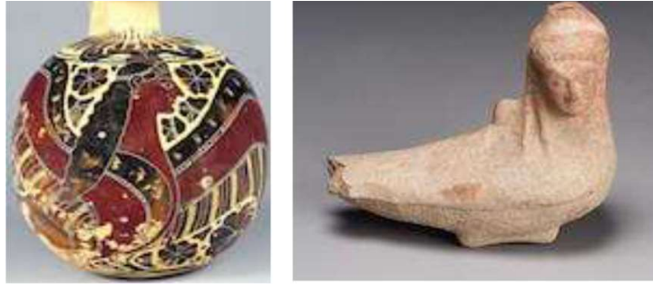
Görsel 12. Korint aryballos, Özel Koleksiyon (Andres, 2020, s. 38).