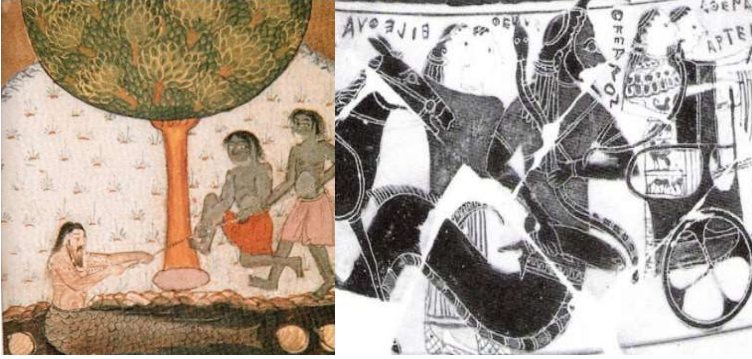
Görsel 22. Tarih-i Hind-i Garbi (And, 2004, s. 71)

Ünlü Selçuklu devri tarihçisi İbni Bibi'nin anlattığı içki alemleri, saray tasvirlerinde canlanmaktadır. Sfenksler ve sirenler, sultanın eş yüzü başlarındaki taçlarını andıran lacivert ve pathcan moru renklerdeki benekli gövdeleriyle, süslü kuyruklarıyla bu duvarlarda resmedilmiştir. Bu yaratıklar, inanca göre büyülü, tılsımlı, koruyucu ve uğur getirici olarak kabul edilirler. (Öney, 1992, s. 102).