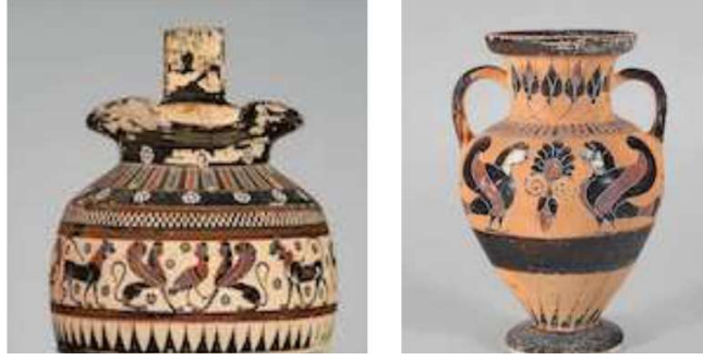
Görsel 10. Oinochoe, Boston Güzel Sanatlar Müzesi (Andres, 2020, s. 38).