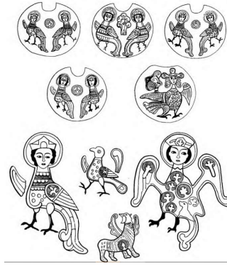
Görsel 24. Siren tasvirleri. (Rybakov, 1987, 581).

Selçuklu dönemindeki Harpi-Siren figürü, çeşitli kültürlerin etkileşimiyle şekillenen pek çok motif gibi, arkaik ve geç dönem anlam katmanları barındırıyor. Bu katmanları genel olarak, İslam öncesi Avrasya ile İslam Dönemi Yakın Doğu ve Anadolu coğrafyalarıyla ilişkilendirmek mümkün olsa da, figürün daha da geriye, Türkistan'dan itibaren Budist, Hristiyan ve Sasani etkileriyle harmanlandığı tahmin edilebilir. Harpi figürünün daha saf ve arkaik kökenlerine ulaşmak için ise, Avrasya coğrafyasında gelişen Türk ve Proto-Türk kültürlerine başvurmak mantıklı görünüyor. (Avşar, 20122, s.8).