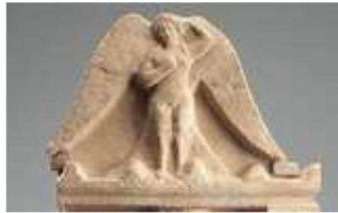
Görsel 14. Siren Kabartma, Berlin (Andres, 2020, s. 38).