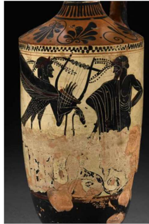
Görsel 18. Siyah Figürlü Lekythos. https://www.britishmuseum.org/collection/object/G_1842-0728-802 Erişim Tarihi: 12.03.2024.

Birkaç yüzyıl sonra, Siren kendisi de ölünün ardından yas tutmak için bu aynı jesti benimser. Görünüşü insanileştikçe, üzüntü gibi insan duygularını da gösterebilir hale gelir. Yale koleksiyonundaki MÖ 350-300 tarihli çok renkli ve tüylü bir mezar heykelinde görüldüğü gibi. (Görsel 17) Çoğu durumda, Siren kuş ayaklarını ve alt bedenini ve kesinlikle kanatlarını korur, ancak gövdesi ve yüzü giderek daha duygusal hale gelir.