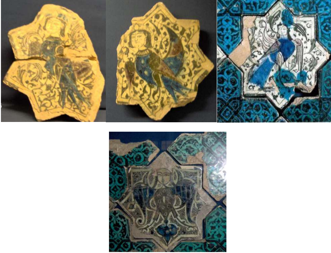
Görsel 27-28-29. Kubadabad Sarayı'nda Yer Alan Siren Figürlü Çiniler