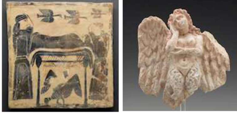
Görsel 16. Cenaze plaketi, Güzel Sanatlar Müzesi, Boston. (Andres, 2020, s. 38).