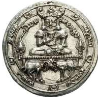
Fotoğraf 2: Adudüddeve Dönemi Gümüş Madalyon, Darp Yeri: Fars, 34.47 gr., https://www.acsearch.info/search.html?id=10848109 (Erişim Tarihi 27.3.2024).

Adudüddeve'nin Şâhanşâh ünvanına Fars'ta darbettiği bir altın madalyonda ve ardından da bir Arapça kitâbede yer verdiği görülmektedir. Madalyonun ön yüzünde Pehlevce: " Farreh Afzud Şâhânşâh " (Şâhanşâhın Şanı Artsın), arka yüzünde: "Dir Ziy Şah Şah-Pan a Husrev" (Şâh Fenna Husrev Uzun Yaşasın), ön yüz çevresinde Arapça olarak: " Lâ İlâhe İllallah Muhammedun Resulullâh " (Allah'tan başka ilâh yoktur, Muhammed Allah'ın elçisidir) yazmaktadır (Fotoğraf 2). Ancak sikkelerindeki Emîru'l-Adl Adudüddeve lakabı Irak'a hâkimiyeti sonrası yerini " el-Meliku'l-Adl Adudüddeve Ebu Şucâ "ya bırakmıştır. 980-981 (370) yılından itibaren dinarlar ve dirhemler " el-Melikü'l-Adl Şâhanşâh Adudüddeve ve Tâcûlmille Ebu Şucâ " adına darbedilmeye başlanmış ve ölümüne kadar böyle devam etmiştir. 35