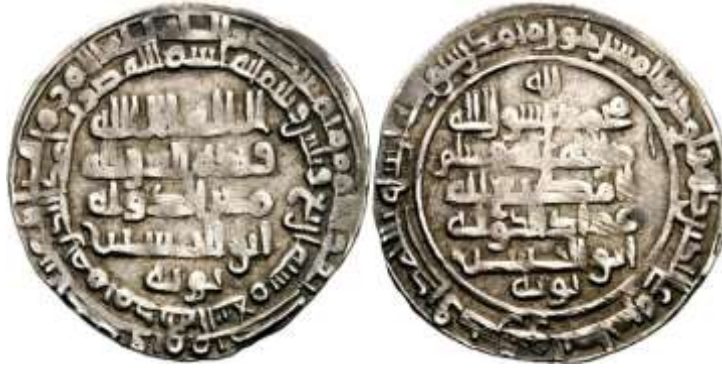
Fotoğraf 1: Muizzüddeve Dönemi Dirhem, Darp Yeri: Medînetü's-Selâm, Yıl: 945-946, 2.77 gr., https://www.acsearch.info/search.html?id=1243632 (Erişim Tarihi 27.3.2024).

Muizzüddeve -daha önce bahsedildiği üzere- Bağdat'a girdiğinde Halife Müstekfî'den kendisi için İzzüddeve (Devletin İzzeti) lakabını istemişti. Ancak Müstekfî onun bu isteğini kabul etmemişti. Bunun yerine ona, daha az gösterişli olan Muizzüddeve lakabını vermişti. Muizzüddeve Bağdat'ta hâkimiyetini sağlamlaştırdıktan sonra kendisine güven duymadığı Müstekfî'yi hilâfet makamından indirerek hal' etmiş ve yerine Mutî'-Lillâh'ı getirmiştir. Muizzüddeve, 959-960 (348) senesinde de kendisi için alamadığı bu lakabı, veliahdı olan oğlu Ebu Mansûr Bahtiyâr için istemiştir. Bunun neticesinde Bahtiyâr, Halife Mutî'-Lillâh tarafından emîrülümerâ tayin edilmiş ve beraberinde diğer hâkimiyet alametleri ile birlikte İzzüddeve lakabını almıştır. 26 Bununla beraber Birûnî'de geçen bir kayıta Bahtiyâr için Gurûruddeve (Devletin Gururu) lakabı da kullanılmıştır. 27