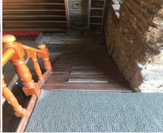
Kaynak: Araştırmacı tarafından çekilmiştir (12.09.2023)