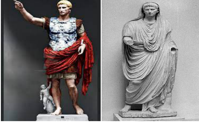
Görsel 7. Augustus'un iki farklı heykeli soldaki Batı, sağdaki Doğu garnizonları için yaptırılmıştır. (URL 12)

dönüşmüştür. Ritüeller törenler, kabartmalar, portreler, sikkeler, propogandaya yönelik olarak hikayeleştirilip, yüceltilir ve Tanrısal öğeler ile yüceltilirdi. Firavınlar, krallar ve imparatorlar okuma yazma bilmeyen halka, ezberletilen resim ve görsel okuyazarlık teknikleri ile kendi güçlerinin etkisini ortaya koymuşlardır (Durugönül, 2022, s. 1).