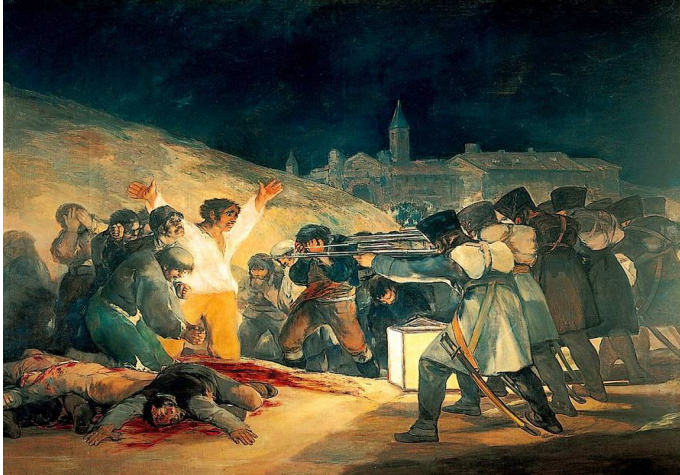
Görsel 11. Francisco Goya'nın 3 Mayıs 1808 adlı tablosu (Ayyıldız. 2021,1)