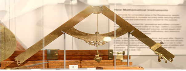
Galileo's geometrical and military compass, thought to have been made c. 1604 by his personal instrument-maker Marc'Antonio Mazzoleni

arasındaki çekişmeyi anlatmaktadır. Dünya siyasi tarihinin gizli anlatımı gibidir. Aynı zamanda kilisenin iktidar gücünü yeniden temize sorgulayan reformist bir yazardır. Yönetimle yakın çalışan Filozof Desiderius Erasmus ve Nicoolaus Copernicus genel anlamda çağından ileriye geçmiş önemli eğitimci ve bilim adamlarıdır. Copernicus sonrası Rönesans Dönemi bilim adamı Galileo Galilei ispata dayalı bilime yönelmiş bunun sonucunda fikirleri kiliseye ters düşmüş, ev hapsine mahkûm edilmiş, bir din adamı olarak bilim tarihinde yer almıştır. Yıllar sonra itibarı geri verilmiş adına müze açılmıştır (Erbay, 2016, s. 139).