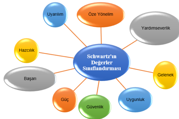
Şekil 1: Schwartz (2012) Değer Sınıflandırması

Değerler, bireylerde toplum tarafından arzu edilen, uygun görülen ve hedeflenen tutum ve davranışların temelini oluşturan mekanizmalardır (Askeland vd., 2020, s. 1). Latince "valere" sözcüğünden türetilmiş olan bu kavram, "kıymetli olmak" veya "güçlü olmak" anlamlarına gelmekte olup ilk kez Polonyalı sosyolog Florian Znaniecki tarafından kullanılmıştır (Bilgin, 1995, s. 83). Değerler, genel itibari ile bireysel olarak algılansa da onların asıl kapsamlı yönünü toplumlar oluşturmaktadır. Çünkü onlar, toplumdaki bireylerin ortak davranışlarının yine topluma yansımaları ile dikkat çekmektedir (Aydın, 2003, s. 122). Bu bağlamda, değerlerin, bir ayna niteliğinde olduğu söylenebilir. Değerler, bireysel olarak değerlendirilmesinin yanı sıra sosyolojide sosyal bağlamda paylaşılan inanç ve kanaatler fikrine odaklanmaktadır (Von Scheve, 2015, s. 4). Değer kavramı, çok yönlü bir kavram olup üzerinde fikir birliği sağlanamamıştır. Bu kavram ile ilgili çeşitli sınıflandırmalar yapılmıştır (Abreu & Camarinha-Matos, 2008: 1208; Maik & Yusof, 2013). Önemli psikolog ve değerler teorisyeni olan Schwartz (2012) değerleri dokuz başlık altında sınıflamıştır;