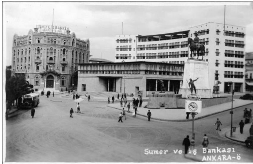
Şekil 15. Sümerbank ve İş Bankası, 1940.

Ankara Sosyal Bilimler Üniversitesi (Eski Sümerbank Binası) (Şekil15-16), dairesel giriş saçağı ve bu saçağın oluşturduğu boşluğa sahip, simetrik bir yapıda tasarlanmıştır. Giriş cephesinden, arkaya doğru genişleyerek açılan plan düzeninde, önde Sümerbank satış mağazası ve banka kısmı bulunmaktadır. Bu bölümün kat yüksekliği yapının diğer bölümlerine göre daha alçaktır (TMMOB Mimarlar Odası Ankara Şubesi, 2022).