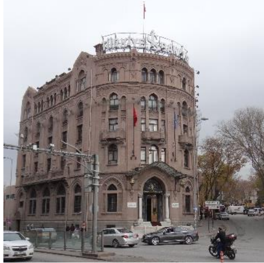
Şekil 20. İş Bankası Müzesi.

Kaynak: Yazar Kişisel Arşivi, 2 Aralık 2022.