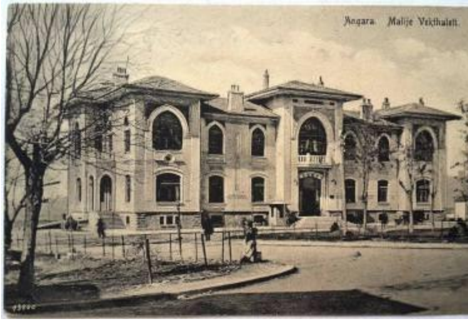
Şekil 23. Başvekâlet ve Maliye Vekâleti Binası, T.Y.