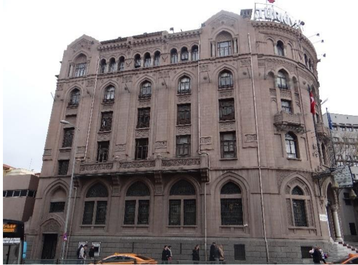
Şekil 22. İş Bankası Müzesi Cephesi.