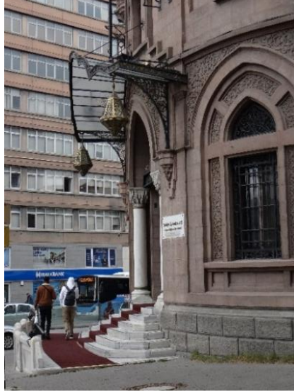
Şekil 21. İş Bankası Müzesi Girişi.