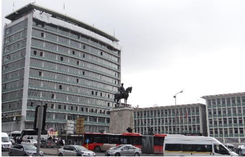
Şekil 12. Zafer Anıtı ve Ulus Çarşısı.