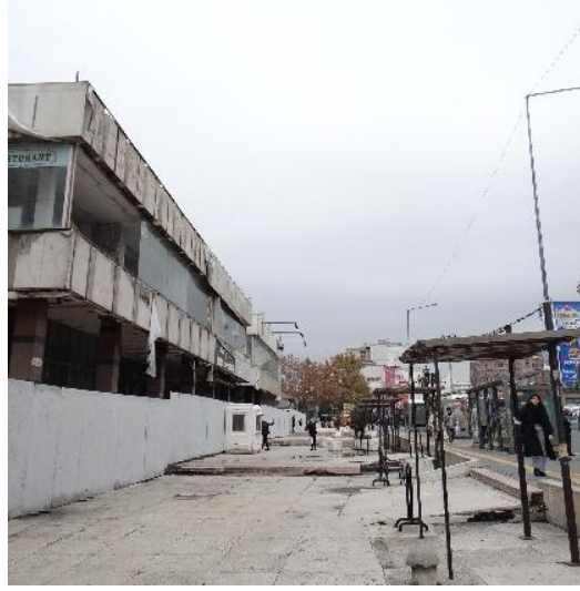
Şekil 10. Solda Yüzüncü Yıl Çarşısı Yaya Aksındaki Arayüzden Güney Yönüne Bakış.