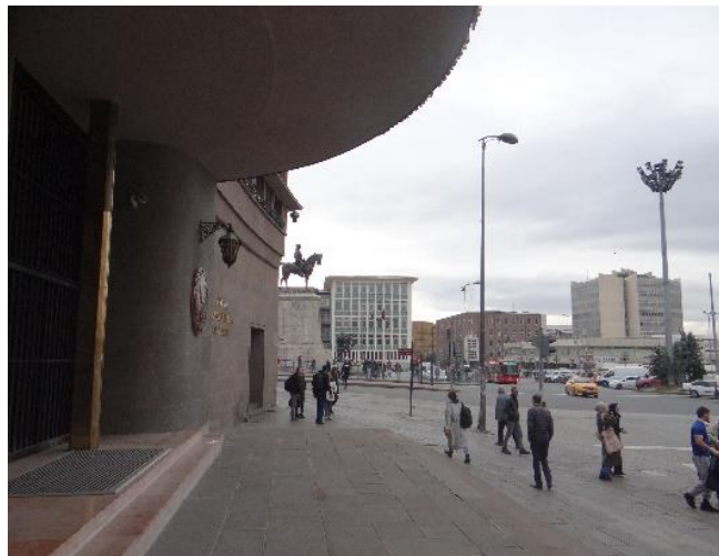
Kaynak: Yazar Kişisel Arşivi, 2 Aralık 2022.

Şekil 17. Eski Sümerbank Binası'nın Kütleli Biçimlenişi ile Oluşan Dağılma / Toplanma Alanı Arayüzü.