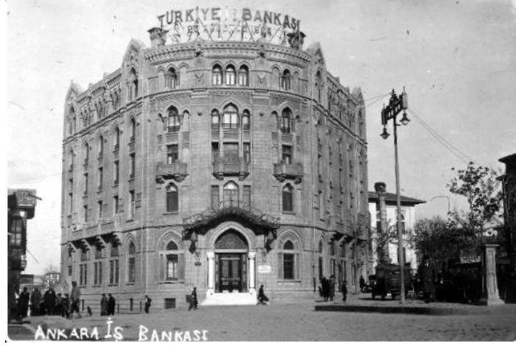
Şekil 19. Eski İş Bankası Binası, T.Y.

1929 yılında Ulus Meydanı'nda inşa edilen İş Bankası Binası, Cumhuriyet'in kurumsal yapısını yansıtmaya özelliği oluşturmuş ve çevresindeki yapılarla meydanı çevrelemiştir (Bayraktar, 2013). İş Bankası eski binası (Şekil 19), dairesel girişleriyle Ulus Meydanı'na bakan, meydanla ilişki kuran bir yapı niteliğindedir. Beş katlı ve ortası avlulu olarak tasarlanan yapının planı, simetrik bir düzen içermektedir. Meydana bakan yapı köşesinde bulunan ana girişin haricinde, yapıya yan cephelerden de giriş sağlanmaktadır. Cephelerde Batı ve Osmanlı mimarlığının etkileri açıkça görülmektedir (TMMOB Mimarlar Odası Ankara Şubesi, 2022).