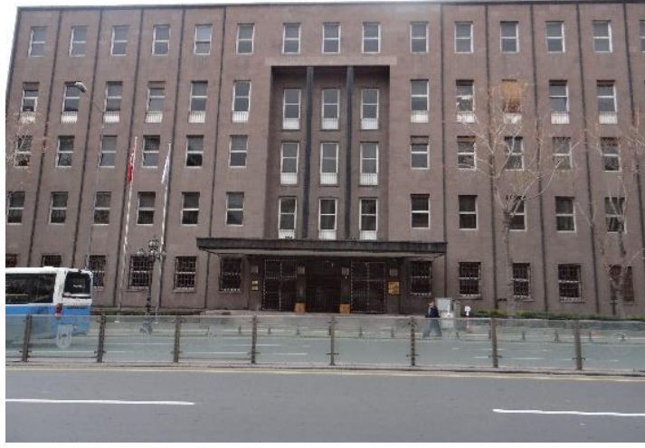
Şekil 6. Eski Merkez Bankası Binası Giriş Cephesi.