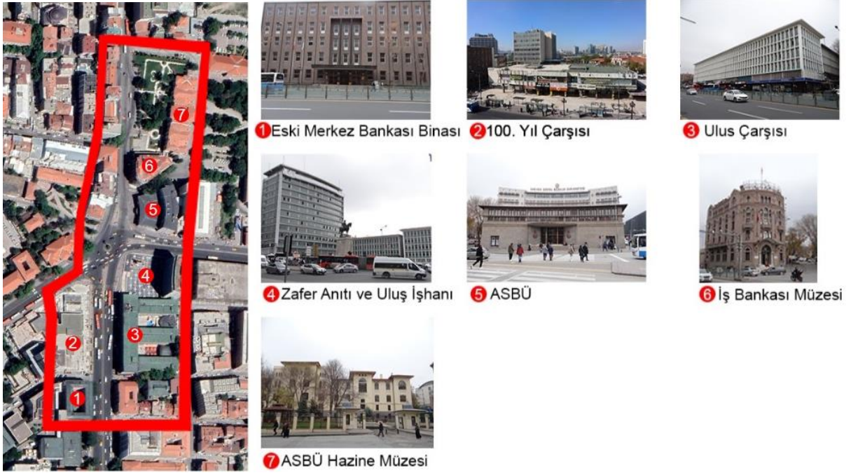
Şekil 3. Araştırma Alanı Sınırları ve Araştırma Alanındaki Önemli Yapılar.

Kaynak: Yazar Kişisel Arşivi, 1 Aralık 2022.