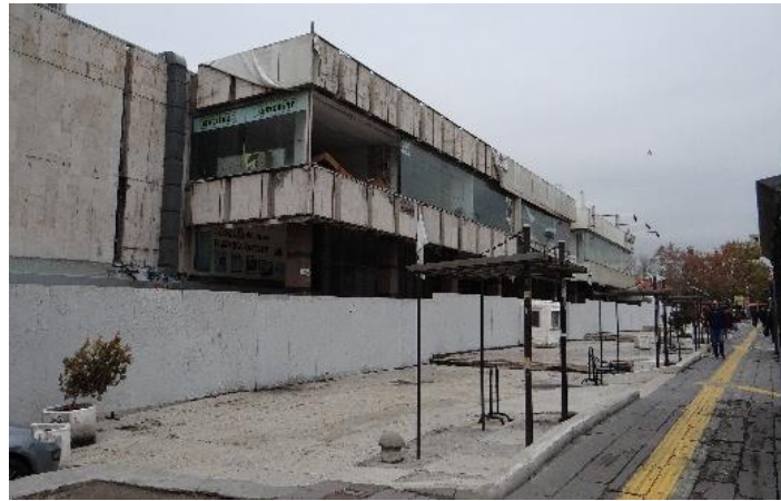
Şekil 9. Âtıl durumdaki Yüzüncü Yıl Çarşısı.

Kaynak: Yazar Kişisel Arşivi, 2 Aralık 2022.