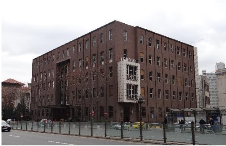
Şekil 5. Eski Merkez Bankası Binası.