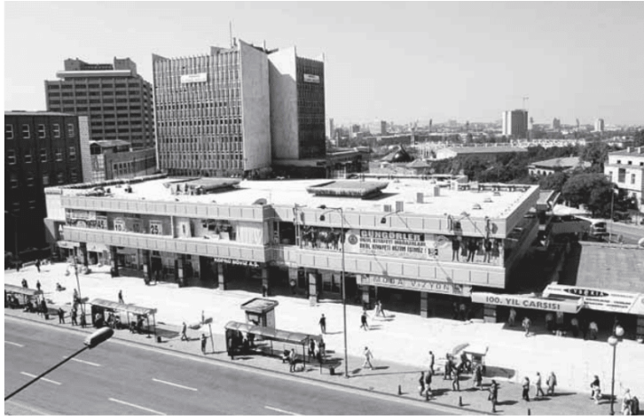
Şekil 8. Yüzüncü Yıl Çarşısı T.Y.