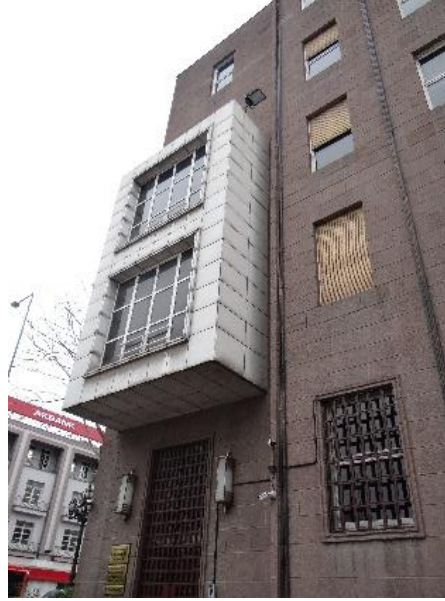
Şekil 7. Eski Merkez Bankası Binası Yan Cephe Çıkmaları.