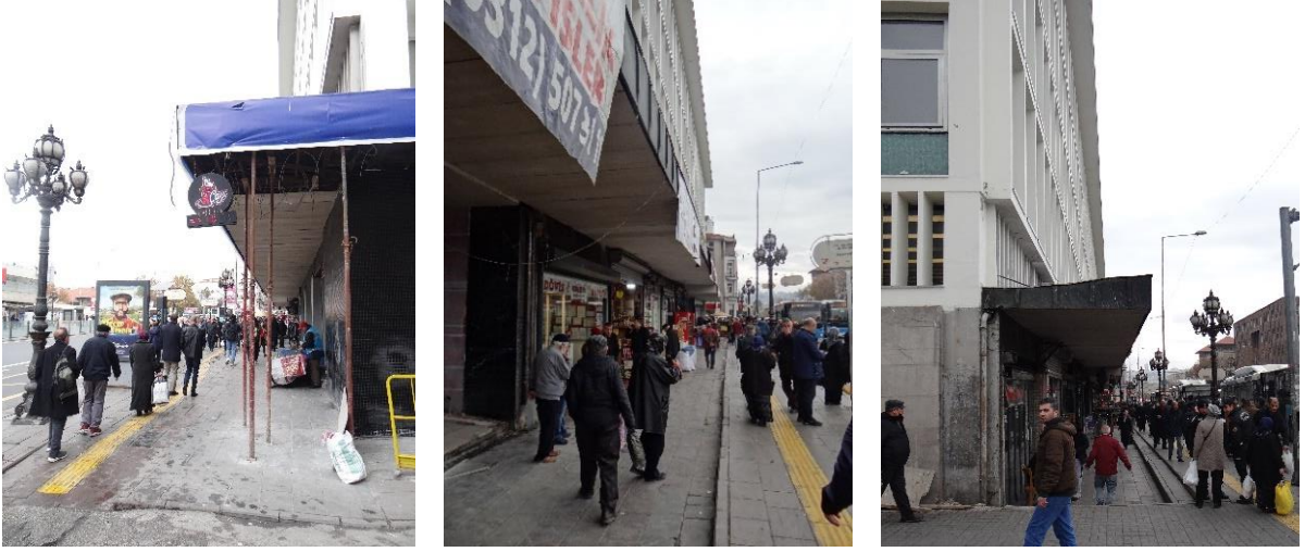
Şekil 14. Ulus Çarşısı Zemin Katındaki Açıklıkların ve Ticari Mekânların Oluşturduğu Arayüz.

Kaynak: Yazar Kişisel Arşivi, 2 Aralık 2022.