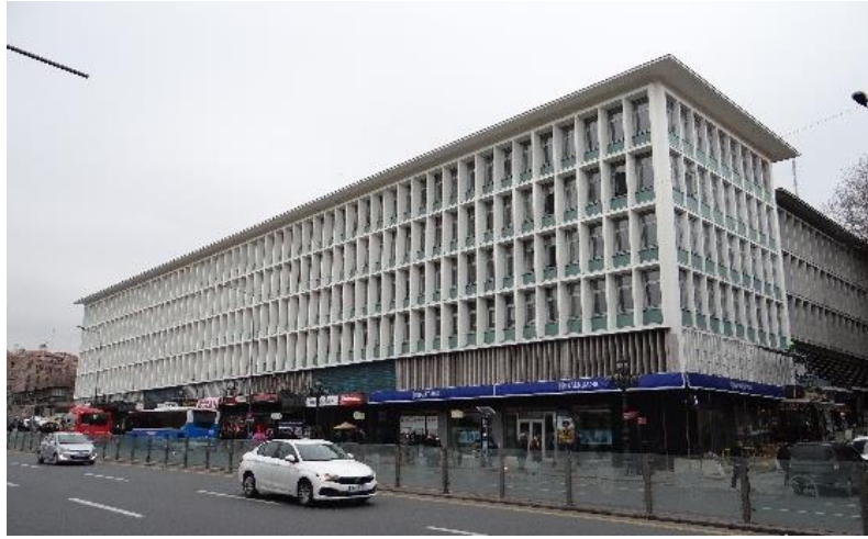
Şekil 13. Ulus Çarşısı.

Kaynak: Yazar Kişisel Arşivi, 2 Aralık 2022.