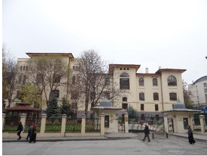
Şekil 24. ASBÜ Hazine Müzesi.