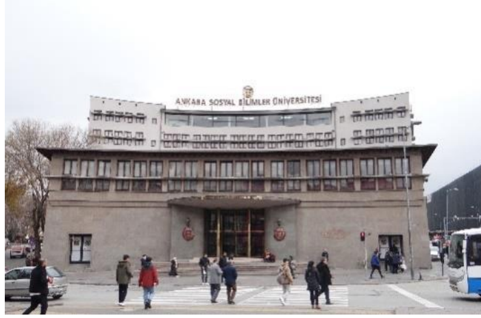
Kaynak: Yazar Kişisel Arşivi, 2 Aralık 2022.