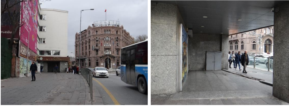
Şekil 25. Ulus Bankalar Caddesi'ndeki Açıklıklarda Oluşan Arayüzlerin Özelleşmesiyle Beraber İşlevselliklerini Kaybetmesi.