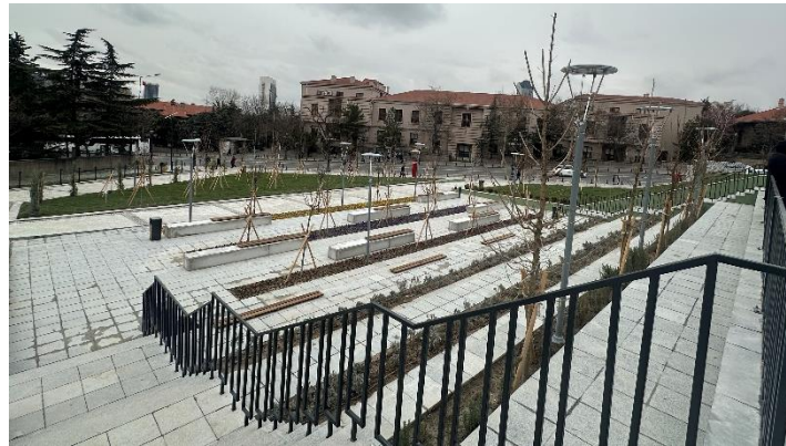
Şekil 11. Yüzüncü Yıl Çarşısı Yerine Yapılan Kentsel Açık Alan

Kaynak: Yazar Kişisel Arşivi, 15 Nisan 2024.