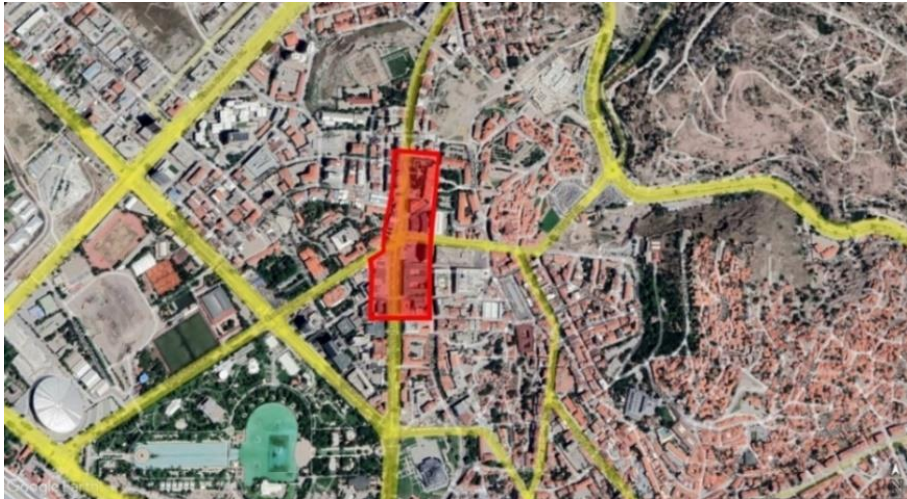
Şekil 2. Çalışma Alanı Sınırları

Çalışma kapsamında seçilen araştırma alanının sınırları ve araştırma alanındaki yapılar, Cumhuriyet'in ilk yıllarından itibaren hem kamusal hem de özel alan kullanımlarına olanak sağlamış, özel alan-kamusal arasındaki bağlantıların kurulmasıyla birlikte bölgenin ticari, sosyal, kültürel ve ekonomik faaliyetlerini destekleyen güçlü bir ulaşım aksı olmuştur. Bu sebeple seçilen örnek alan, özel alan ve kamusal alan arasındaki ilişki sürekliliğini desteklemekte ve araştırmanın çıkış noktası olan "kentsel arayüz" kavramına olanak sağlayan, kamusal potansiyeli barındıran alanlar barındırmaktadır.