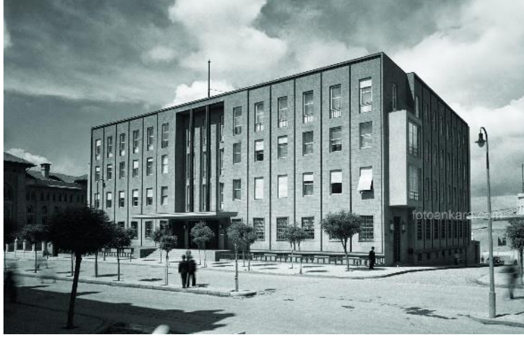
Şekil 4. Merkez Bankası Binası, 1940'lı Yıllar.