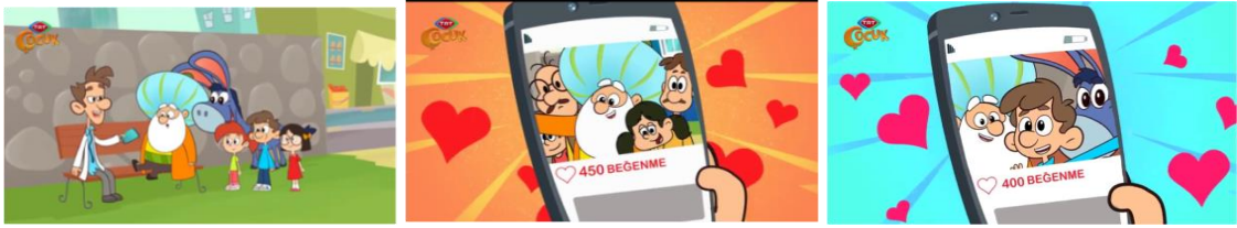
Görsel 5. 5.Bölüm - “Nasreddin Hoca” Alışverişte

Nasreddin Hoca “Oyun Bitti” isimli bölümde ekranda gördüğü Super Mario isimli videodaki karaktere “Koş evlatçım koş, hadi evladım kaç kaç” diyerek kendini oyuna kaptırması dikkat çekmektedir. Görsel. 6'da görüleceği üzere videodaki karakterin puan kazanması Nasreddin Hoca'yı mutlu etmektedir. Karakterin oyunda can haklarını kaybetmesi ise Nasreddin Hoca'yı oldukça üzmetmektedir. Bu durumu Nasreddin Hoca'nın “ne olacak zavallı çocuğa” sözleriyle dile getirmesi oyundaki kurguya kendini kaptırması olarak yorumlanabilir.