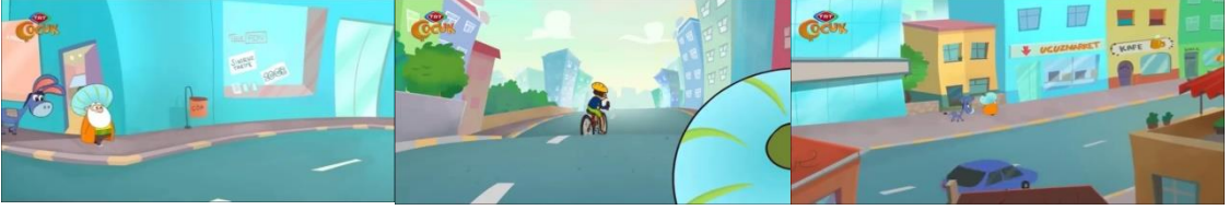
Görsel 2. 2. Bölüm - Aslan Terbiyecisi

Çizgi filminin “Aslan Terbiyecisi” isimli ikinci bölümü Nasreddin Hoca’nın modern toplumu merak etmesini konu edinmektedir. Bu bölümde Görsel 2.’de görüleceği üzere Nasreddin Hoca eşiği Küheylan ile modern toplumu keşfetmeye karar vermiştir. Nasreddin Hoca “Bakalım insanoğlu bizden sonra neler yapmış” diyerek Küheylan ile çarşıda yürümeye başlamıştır. Nasreddin Hoca çarşıda gezerken geleneksel zamandan alışık olmadığı yüksek katlı binaları görünce şaşkınlığa uğramıştır.