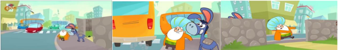
Görsel 1. 1. Bölüm - Zaman Yolcusu

“Nasreddin Hoca Zaman Yolcusu” çizgi filmi “Zaman Yolcusu” isimli birinci bölüm ile başlamaktadır. Bu bölüm Cemil Amca'nın, bir çınar ağacının gövdesinde uzun zamandır üzerinde uğraştığı zaman makinesini sonunda çalıştırmasını konu edinmektedir. Cemil Amca'nın zaman makinesi ile modern topluma yolculuğa çıkan ilk kişi ise Nasreddin Hoca'dır. Cemil Amca'nın çalıştırdığı zaman makinesi ile modern topluma ayak basan Nasrettin Hoca karşısında çınar ağacının gövdesine gelen Kerim, Ayşe ve Zehra'yı görünce şaşkınlığını gizleyememiştir. O sırada Nasreddin Hoca çocuklara (Kerim, Ayşe ve Zehra) dönerek “Burası neresi?” diye sormuş ve acelesi olduğunu belirterek pazara gitmek istediğini belirtmiştir. Nasrettin Hoca işte tam da bu sırada modern toplumda yaşanan değişimlerle yüzleşecektir. Görsel 1'de görüleceği üzere, çınar ağacından eşeği Küheylan ile çıkarak modern topluma adım attığı ilk anda Nasreddin Hoca karmaşık yapı karşısında şaşkınlığa uğramıştır. Nasreddin Hoca, gürültülü bir şekilde hızla akan araç trafiğinde karşıdan karşıya geçmekte çok zorlanmış ve karmaşadan kaçmaya çalışmıştır. Akan trafikte şaşkına uğrayan Nasreddin Hoca modern toplumu “Bırak yürümeyi iki dakika yaşamak zor” diye betimlemesi dikkat çekmektedir.