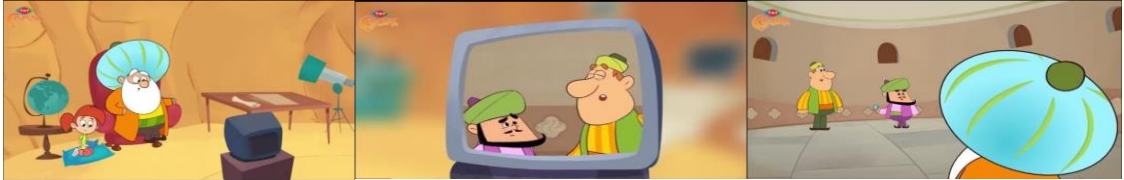
Görsel 8. 18. Bölüm.- “Nasreddin Hoca Film Setinde”

Elif: “Sadece bir film hocam. Üzülmeysin bu kadar.”