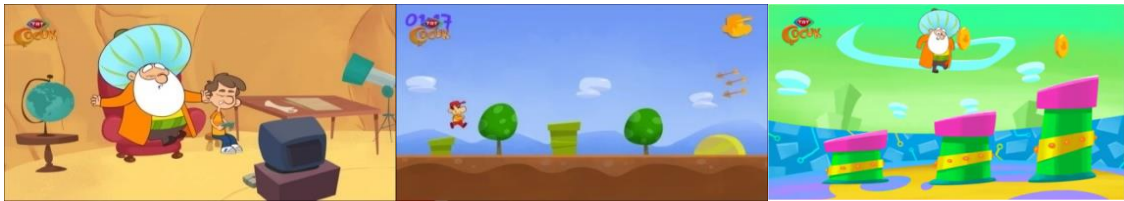
Görsel 6. 8. Bölüm - Oyun Bitti

Nasreddin Hoca “Oyun Bitti” isimli bölümde ekranda gördüğü Super Mario isimli videodaki karaktere “Koş evlatçım koş, hadi evladım kaç kaç” diyerek kendini oyuna kaptırması dikkat çekmektedir. Görsel. 6'da görüleceği üzere videodaki karakterin puan kazanması Nasreddin Hoca'yı mutlu etmektedir. Karakterin oyunda can haklarını kaybetmesi ise Nasreddin Hoca'yı oldukça üzmetmektedir. Bu durumu Nasreddin Hoca'nın “ne olacak zavallı çocuğa” sözleriyle dile getirmesi oyundaki kurguya kendini kaptırması olarak yorumlanabilir.