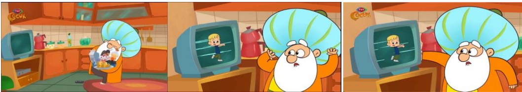
Görsel 3. 3. Bölüm - Evde Bir Başına

Çizgi filmin “Evde Bir Başına” üçüncü bölümüdür. Bu bölüm Nasreddin Hoca’nın evde tek başına kalmasını konu edinmektedir. Evde tek başına kaldığı süreyi dinlenerek geçiren Nasreddin Hoca uykusundan uyandığında bir anda karnının acıktığını hissederek mutfağa yönelmiştir. Mutfağa gittiği sırada çok fazla tabak gören Nasreddin Hoca “Bu asrın insanları çok müsrif” diyerek tüketim kültürüne göndermede bulunmaktadır. Ayrıca bu bölümdeki ilginç sahnelerden birinde Görsel 3.’te de görüleceği üzere ekranda koşan çocuğu görüp panikleyen Nasreddin Hoca televizyonu sallayarak yardım etmeye çalışır. Nasreddin Hoca aniden yerde bulunan televizyon kumandasının tuşuna basıp ekranda panik halinde koşan çocuğu görünce şaşkınlığa uğrar. O sırada ne olduğuna anlam veremeyen Nasreddin Hoca televizyonu sallayarak çocuğa yardım etmeye çalışmaktadır. Televizyonundaki çocuğa “Sende kimsin? Nasıl girdin o kutunun içine? Kaç kaç...şunlara bak yakalayacaklar zavallı çocuğu” demesi gerçek ile kurguyu ayırt edememesi olarak yorumlanabilir.