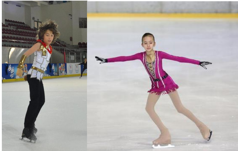
Resim 11 - 12. ( http://www.hurriyet.com.tr/haberleri/artistik-buz-pateni , Erişim Tarihi: 06.07.2017)