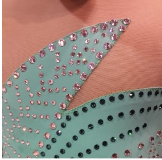
Resim 13. Artistik Buz Pateni Giysisinde Kullanılan Kumaş, Dikiş Tekniği ve Yapıştırma Taş Örneği (Ceranoğlu Özel Koleksiyonu, 2015)