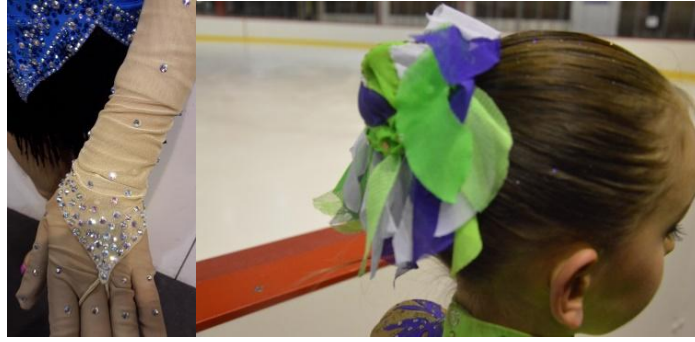
Resim 14 - 15. Artistik Buz Pateni Giysisinde Kullanılan Aksesuar Örnekleri (Ceranoğlu Özel Koleksiyonu, 2015)