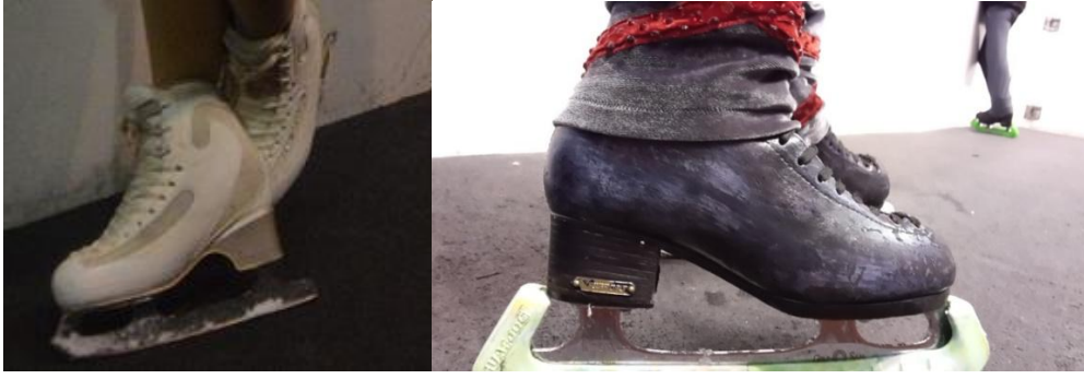
Resim 2 - 3. Günümüzde Kullanılan Patenler (Ceranoğlu Özel Koleksiyonu, 2015)

Buz pateni sporu, üç esas bölümden oluşmaktadır: