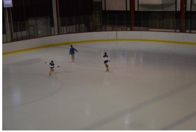
Resim 5. Buz Pateni Salonunda (Ankara Belpa) Artistik Buz Pateni Kayan Çocuklar

İlk uluslararası buz pateni yarışı, 1882 yılında Viyana’da gerçekleşmiştir. On yıl içinde artistik buz pateni sporunda gelişmiş bir organizasyon düzenlemek için International Skating Union (ISU) kurulmuştur. Bu kuruluşun web sitesine göre, uluslararası kış spor federasyonunda bu, onu en eski yönetim kurulu yapmaktadır. İlk başlarda erkek ayrıcalıklı olan bu sporun öncülerinden Norveçli Axel Paulsen (1855 - 1938), İsveçli Ulrich Salchow (1877 - 1949) ve Avustralyalı Alois Lutz (1898 - 1918), atlama repertuvarlarını yaratmada etkili olmuştur. Repertuvarların standartlarını sürdüren Paulsen, Salchow ve Lutz, yıllar içinde havada ekstra dönüşler dahil daha da karışık hareketler yapmıştır. Kadınlar, 1906’da resmi yarışmalara İsviçre’nin Davos şehrinde katılmıştır. Hatta onlar, hareketi uyduran 1957’nin Alman şampiyonunun ismini alan “Ina Bauer” gibi yeni figürlere isim vermişlerdir. 1908’de Rusya’nın Strasburg şehrinde çiftler için şampiyonluk uygulamaya koyulmuştur. Artistik buz pateni (kadınlar, erkekler, çiftler ve çeşitli figürler için), 1908’de Londra’da Olimpiyatın bir parçası olarak uygulanmıştır. Sonra 1924’te Fransa’nın Chamonix şehrinde ilk uygulanan Kış Olimpiyatları’nın bir parçası olmuştur. Buz dansı, resmi olarak 1976’da artistik buz pateninin ayrı bir branşı olarak kurulmuştur (Grau, 2010: 48).