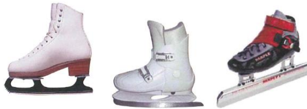
Resim 4. Soldan sağa artistik buz pateni, buz hokeyi pateni, sürat pateni (Çömük, 2009: 4)

Artistik buz pateni, figür pateni olarak da adlandırılmakta ve müzik, dans ve sporu bünyesinde birleştirmektedir. Esneklik, aerobik ve denge gibi unsurlara ihtiyaç duyan artistik buz pateni, son derece atletik ve estetik bir spor dalı olarak kabul edilmektedir. Artistik buz pateni kayan sporcuların giydikleri patenler ile buz hokeyi ve sürat pateni yapan sporcuların giydikleri patenler birbirinden farklı özelliktedir (Çömük, 2009: 3).