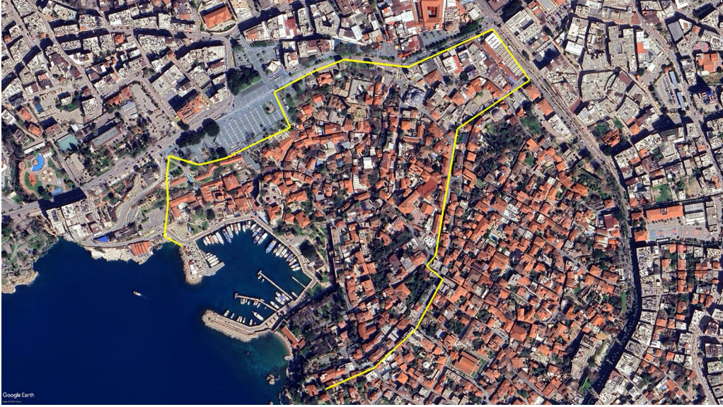
Fig. 1. Emir Mübârizeddin Ertokuş'un Camisinin Bulunması Muhtemel Bölgeyi Gösteren Antalya Kaleiçi Haritası (Google Earth, 2024)

rütmektedir. Nitekim Oktay Aslanapa da Mübârizeddin Ertokuş'un camisinin günümüze ulaşmadığına ve Antalya'da bulunan camilerin hiçbirisinin ona mal edilemeyeceğine işaret etmektedir 39 . Osman Turan ise elinde bu caminin hangi cami olduğunu gösterecek bir veri olmadığını belirtmektedir 40 . Günümüze ulaşmayan bu caminin bir zamanlar Antalya Kaleiçi'nde olduğu muhakkaktır 41 . Ancak caminin tam yerini belirlemek Kaleiçi'ndeki yoğun tahribat ve yapılaşma sebebiyle neredeyse imkânsızdır. Bununla birlikte Kaleiçi'nin Selçuklular zamanında Müslüman nüfus ile meskûn olduğu düşünülen ve Selçuklular dönemine ait Türk-İslam eserlerinin yoğunlaştığı bölgeden hareketle, kabaca bir tahmin yürütmek mümkündür. Buna göre Mübârizeddin Ertokuş'un camisinin günümüzde Dönerciler Çarşısı istikametinden Kaleiçi'ne giren Mescit Sokak ve devamında Hıdırlık Sokak boyunca devam ederek Mermerli mevkiine uzanan surların sağ tarafında, yani Antalya Kaleiçi'nin Kuzey ve Kuzeybatı kısmına düşen bölgede bir yerde bulunması gerektiği düşünülebilir (Fig. 1). Zira Selçuklular ve Beylikler dönemine tarihlenen tüm Türk-İslam eserleri, Sultan I. İzzeddin Keykâvus fetihnâmesini içeren sur hattı ve Sultan I. Alâeddin Keykubâd'ın kitabelerinin bulunduğu ikinci sur hattı bu bahsettiğimiz bölgenin içerisindeydi. Bu sur hatlarının dışındaki eserler Osmanlılar dönemine ait eserlerdir.