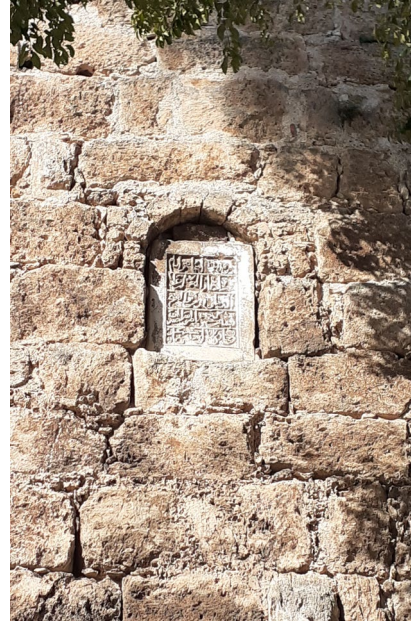
Fig. 5. Sultan I. Alâeddin Keykubâd'ın Hadrianus Kapısı'nın Sağ Burcu Üzerindeki Kitabesi (M. Demir)