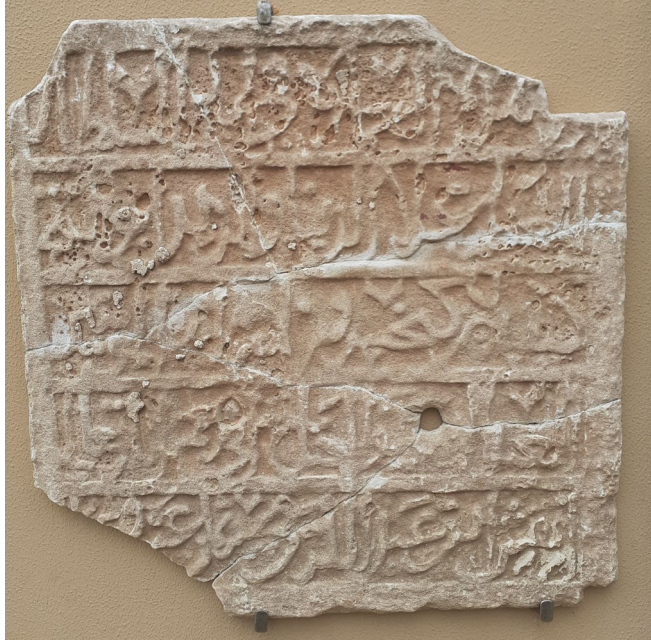
Fig. 2. Emîr Mübârizeddin Ertokuş'un Antalya Etnografya Müzesi'nde Sergilenen Kitabesi (M. Demir)