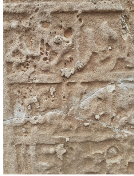
Fig. 3. Kitabe Üzerindeki Tahribat ve Kireç Tabakaları (M. Demir)