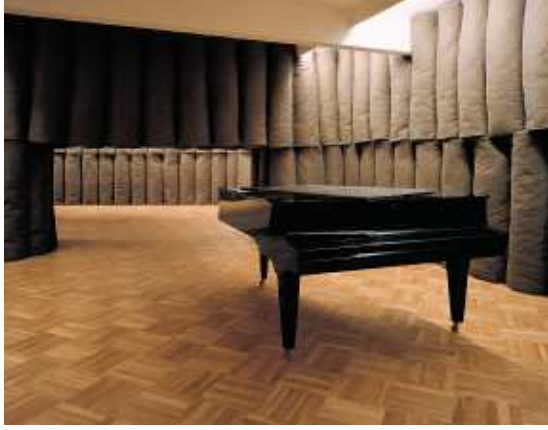
Görsel 6. Kötü durum (Plight), Joseph Beuys, 1958-1985 (Rew, 2013)

taşıyan yağ, keçe, toprak, taş, yiyecek maddesi, bakır ve demir plakaları gibi malzemelerin önemli bir yeri vardır. Çünkü sanatçı bu malzemelerle mekân kurgusu gerçekleştirerek yaşamla ilişkilendirmiştir. Beuys mekân kurgularken izleyicinin zevklerinden ziyade kavramsal boyuta daha çok yönelmiştir. Sanatçı eserlerinde daha çok galeriyi gerçek mekânla kurgulamış ve böylece izleyici sanatsal mekânla gerçek yaşamı özdeşleştirmiştir (Beyoğlu, 2019, s. 36).