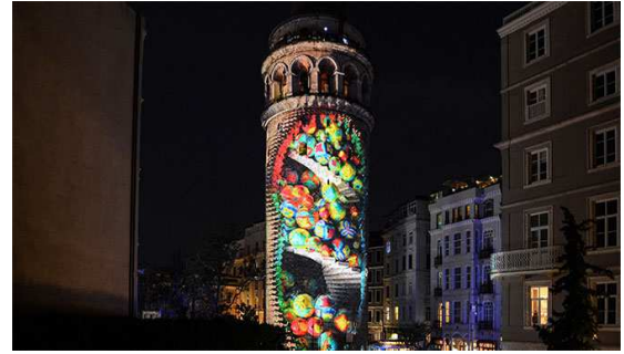
Görsel 9. Galata Kulesi İstanbul Video Mapping, 2018 (Sarıkoç ve Coşkun, 2018).