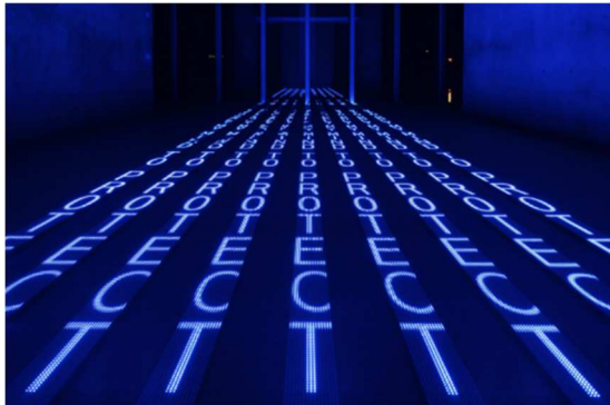
Görsel 7. Kind of Blue, Jenny Holzer, 2012.

Amerikalı sanatçı kent ve doğa bileşenlerinden, özellikle kimlikli mimarisi olan iç ya da dış mekânları malzeme ve mekân bağlamında bir laboratuvar gibi kullanmaktadır. Gözlem yaparak, malzeme toplayarak, yeni ilişkiler üreterek, kente ve doğaya ait dinamikleri kullanarak kavramsal işler üretmektedir. Kent binaları metin ve ışık ana malzemeleridir. Kent dokuları üzerine sorgulamalar yaparak izleyicisine yaşam ve mekân arasında farklı diyaloglar kurmayı hedeflemiştir (Karaçalı, 2017, s. 175).