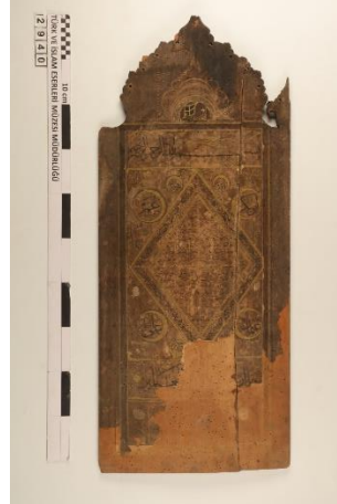
Görsel 6. 2940 Envanter Numaralı Hilye-i Şerif, İstanbul Türk ve İslam Eserleri Müzesi, Fotoğraf: Türk ve İslam Eserleri Müze Arşivi, İstanbul, 2018.