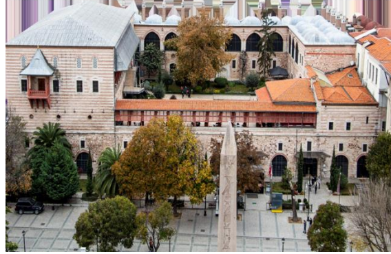
Görsel 1. İbrahim Paşa Sarayı, Türk ve İslam Eserleri Müzesi, Fotoğraf: Türk ve İslam Eserleri Müze Arşivi, İstanbul, 2018.

İstanbul Türk ve İslam Eserleri Müzesi koleksiyonu, tarihsel açıdan büyük bir çeşitlilik sergilemektedir. Bu koleksiyon, İslam sanatının en erken dönemlerinden 20. yüzyıla kadar olan süreçte, Abbasi, Emevi, Kuzey Afrika (Magrip), Endülüs, Selçuklu, Eyyubi, İlhanlı, Memluk, Timur, Safevi devletleriyle çeşitli Kafkas ülkeleri, beylikler ve Osmanlı dönemine ait eserleri içermektedir. Bu eserlerin birçoğu, geldikleri yerin bilinmesini sağlayan vakıf kayıtlarıyla birlikte bulunduğu için büyük bir belge değeri taşımaktadır. Görsel 2’de müzede bulunan eserlerin kronolojisi yer almaktadır. Türk-İslam sanatının altın çağı, özellikle Kanuni döneminde yaşanmış olup, bu döneme ait en güzel örnekler halen İstanbul Türk ve İslam Eserleri Müzesi çatısı altında korunmaktadır (Değirmenci, 2017:19), (Görsel 2).