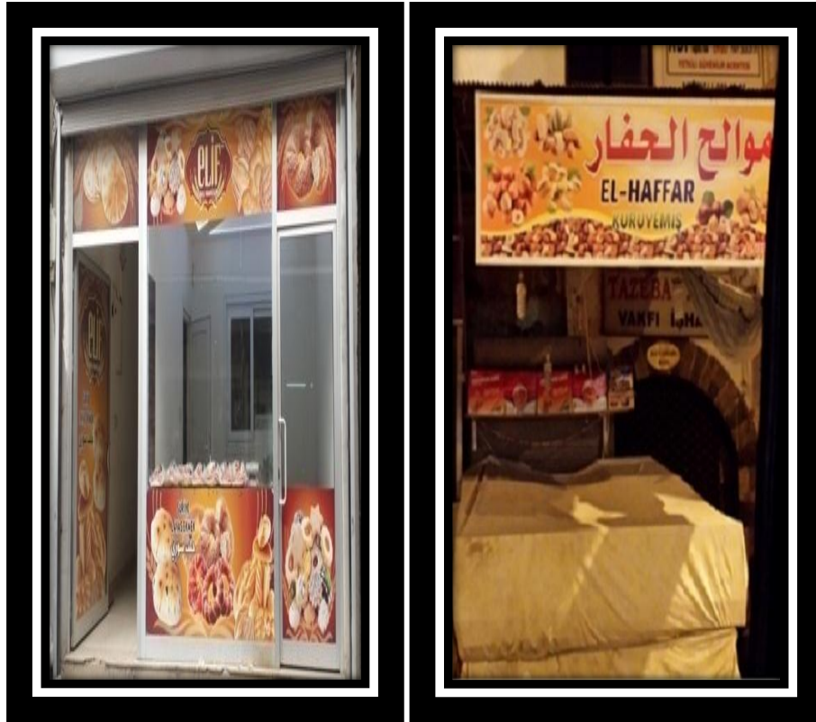
Resim 6.1. Suriyeli sığınmacıların işlettiği fırın/pastane ve kuruyemiş işletmeleri

Ankete katılan 100 örnekleme "Suriyeli sığınmacılar Kilis ili ekonomisine üretici olarak olumlu katkı yapıyor mu?" sorusu sorulmuştur. Tablo 6.5'de görüldüğü gibi örneklemelerden %54'ü kesinlikle yapıyor, %33'ü yapıyor, %6'sı kararsızım, %4'ü yapmıyor, %3'ü kesinlikle yapmıyor cevabını vermiştir. Girişimci ruhuna sahip olan bazı Suriyeli sığınmacılar çeşitli faaliyet alanlarında işyeri açmaktadırlar. Kentin her bir köşesinde Suriyeli sığınmacıların işyerlerini görmek mümkündür. Suriyeli sığınmacıların işlettiği bazı işyerleri Resim 6.1 ve Resim 6.2'de görülmektedir. Ancak yasalar gereği Suriyeliler işyerlerini anlaşmalı oldukları Türk vatandaşlarının adına açabilmektedirler. Bu yüzden de "vergi levhaları ve ruhsatları" Suriyeli işletmecilerin anlaşmalı oldukları Türk vatandaşlarına aittir. Sonuç olarak Suriyeli sığınmacılar Kilis ili ekonomisine üretici sıfatıyla olumlu katkı sağlamaktadır.