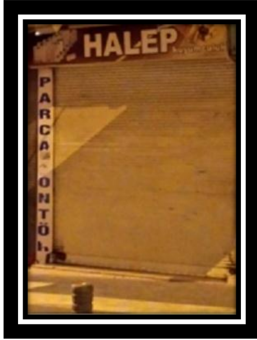
Resim 6.5. Suriyeli sığınmacıların kuyumcu işletmesi