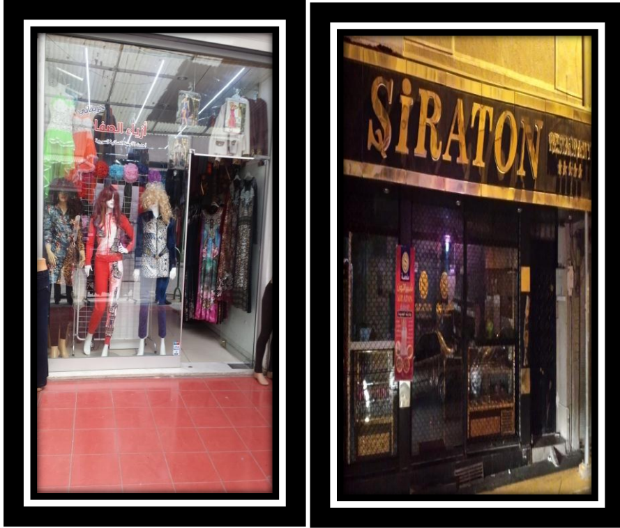
Resim 6.3. Suriyeli sığınmacıların Kilis'teki tekstil ve restoran işletmeleri

Sonuç olarak Kilis'te Suriyeli sığınmacıların çeşitli sektörlerde işyeri açması Kilis ilinin ticaret hacminin artmasına sebep olmuştur. Suriyeli sığınmacıların Kilis'te işlettiği ticarethanelerden bazıları Resim 6.3 ve Resim 6.4'te görülmektedir.