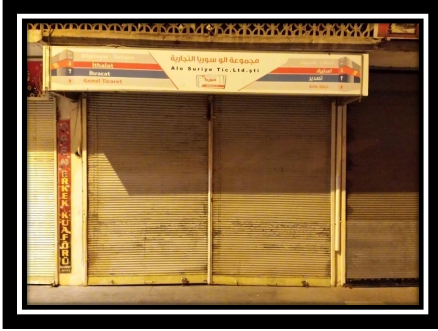
Resim 6.7. Suriyeli sığınmacıların ithalat ve ihracat faaliyet alanlı işletmeleri

Suriyeli sığınmacılar ithalat ve ihracat işlerini yürütebilmek için Resim 6.7'de görüldüğü gibi Kilis'e bir işletme açmıştır. Ancak Kilis halkı bu işletmenin varlığı ve faaliyet şekli hakkında fazla bilgiye sahip değildir. Bu yüzden de ankete katılan örneklemelerin büyük bir kısmı "Suriyeli sığınmacılar Kilis ili ekonomisine ihracat yaparak olumlu katkı yapıyor mu?" ve "Suriyeli sığınmacılar Kilis ili ekonomisine ithalat yaparak olumlu katkı yapıyor mu?" sorusuna kararsızım cevabını vermiştir.