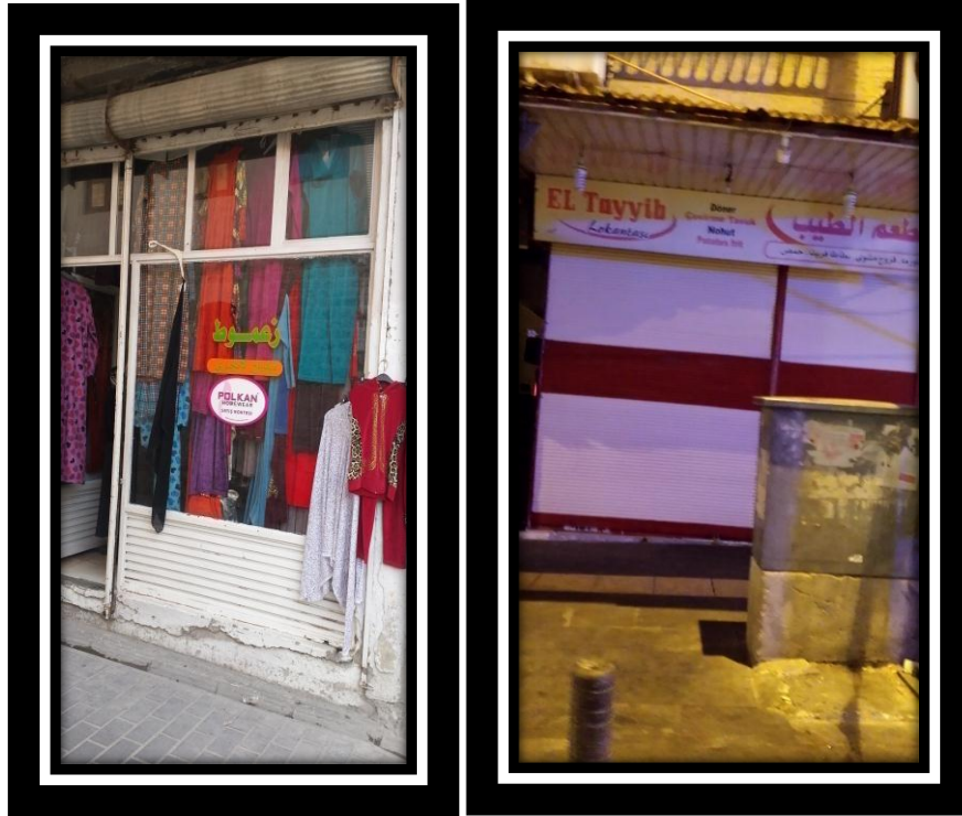
Resim 6. 6. Suriyeli sığınmacıların işlettiği tekstil ve restoran işletmeleri

Ankete katılan 100 örnekleme "Suriyeli sığınmacılar Kilis ili ekonomisine ihracat yaparak olumlu katkı yapıyor mu?" sorusu sorulmuştur. Tablo 6.5'te görüldüğü gibi örneklemlerden %20'si kesinlikle yapıyor, %21'i yapıyor, %44'ü karasızım, %7'si yapmıyor, %8'i kesinlikle yapmıyor cevabını vermiştir.