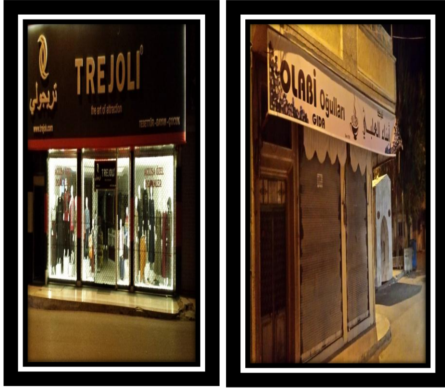
Resim 6.2. Suriyeli sığınmacıların işlettiği giyim ve gıda işletmeleri

Tablo 6.5'te ankete katılan 100 örneklemin "Suriyeli sığınmacılar Kilis ili ekonomisine sanayici olarak olumlu katkı yapıyor mu?" sorusuna verdiği cevaplar yer almaktadır. Şekil 6.10'da görüldüğü gibi örneklerden %46'sı kesinlikle yapıyor, %38'i yapıyor, %13'ü karasızım, %2'si yapmıyor, %1'i kesinlikle yapmıyor cevabını vermiştir. Ankete katılan örneklerden birçoğu Kilis'te en az bir tane Suriyelilerin işlettiği sanayi dükkanının olduğunu belirtmiştir.