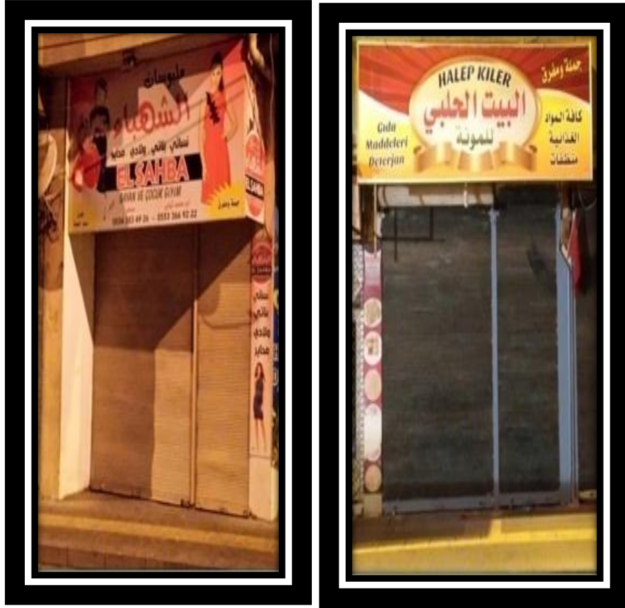
Resim 6.4. Suriyeli sığınmacıların Kilis'teki tekstil ve gıda işletmeleri

Ankete katılan 100 örnekleme "Suriyeli sığınmacılar Kilis ili ekonomisine yatırım yaparak olumlu katkı yapıyor mu?" sorusu sorulmuştur. Tablo 6.5'te görüldüğü gibi örneklemlerden %33'ü kesinlikle yapıyor, %47'si yapıyor, %17'si karasızım, %5'i yapmıyor, %3'ü kesinlikle yapmıyor cevabını vermiştir. Suriyeli sığınmacılar yatırım yaparak Kilis ili ekonomisine olumlu katkı sağlamaktadır.