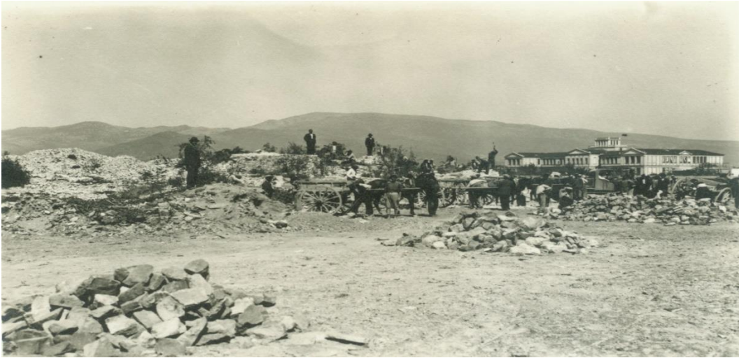
Resim 1: Kültürpark inşa sürecinde temizleme çalışmaları

Kültürpark'ın inşasında karşılaşılan zorlukların başında yangın alanındaki yıkıntının kaldırılması meselesi gelmiştir. İki milyon lira karşılığında bu işi üstleneceklerini ileri süren firmalara karşı Behçet Salih Uz, enkazın otuz bin liraya kaldırılacağını ileri sürmüştür. Bu meblağı temin için de Kültürpark çevresindeki arsaların bir kısmının verilmesi söz konusu olmuştur. Ayrıca Uz, Reşat Leblebicioğlu'nun kefil olmasıyla bankadan kendi namına yirmi sekiz bin liralık kredi çekmiş ve bu parayla molozların bir kısmı temizlenmiş, alandaki bazı bölümleri tapulu olan yerler satın alınmış, etraftaki yollar açılarak alan, alçak bir duvarla çevrelenmiştir (Baran, 2003: 98).