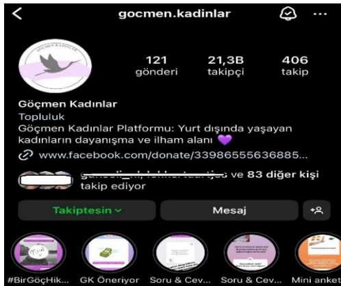
Göçmen Kadınlar Instagram Profil Sayfası

Göçmen Kadınlar Instagram sayfasında genel olarak; dünyanın dört bir yanındaki göçmen kadınların ilham verici deneyim ve hikâyelerine, göçmenlerin ve göç etmeyi planlayanların karşılaşabileceği durum ve sorunlara yönelik pratik çözüm önerilerine, göçmen olmak veya kadın