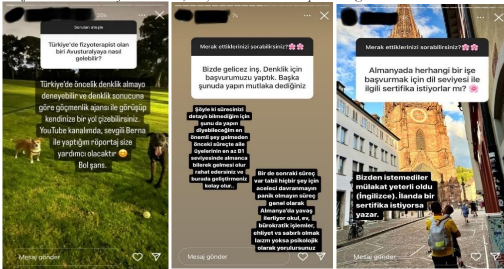
Bazı Katılımcıların Profillerinde Gerçekleştirdikleri Soru-Cevap Etkinliği

Katılımcılardan 10'u göç etmek isteyen kişilerden göç süreçleriyle ve göç ettikleri ülkeyle ilgili sorular aldıklarını ve bu kişilerin sorularını cevaplayarak onlara destek olduklarını belirtmişlerdir. Katılımcılardan GK-16 ve GK-23'ün ifadeleri şu şekildedir: