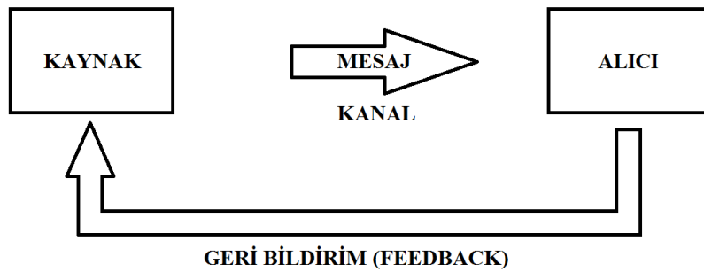
Şekil 2. İletişim Sürecinin Öğeleri

Tanımlamaların hemen hepsi açık veya kapalı olarak iletişimi bir süreç olarak ele alır. İletişim; sürekli eylemler dizisini içeren bir süreçtir. Bu süreçte, iletişim değişen ve tekrarlanamayan karşılıklı ilişkiler olarak ortaya çıkar. İnsanlar, çevre-ler, beceriler, tutumlar, deneyimler, statüler ve duygular arasındaki karşılıklı ilişkiler, bir iletişimde kimine ne ve ne zaman yapacağını belirler. İletişim, ilişkilerde ve iletişim çabalarında süreklilik sağlar (Erdoğan, 2002: 33).