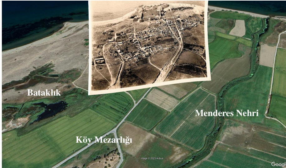
Görsel 2: 20'nci Yüzyıl Başlarında Kumkale Köyü Sınırları

Kumkale, Çanakkale Boğazı girişinin Anadolu yakası ucunda; batı ve kuzeyini kaplayan deniz, güneyini kesen bataklık ve doğusunu kesen Menderes nehri arasında konumlanmaktadır. Köyün güneyindeki bataklık ile Menderes nehri arasında bir köy mezarlığı bulunmaktadır. Kumluk arazide, etrafı coğrafi sınırlılıklarla tespit edilmiş bu alan, askerî açıdan da sınırlılıklar barındırmaktadır. Kumkale muharebesi, içerisinde kale ve boşaltılmış yerleşim mekânları da olan, yaklaşık 0,6 kilometrekarelik dar bir alanda gerçekleşmiştir. (Bkz. Görsel 2)