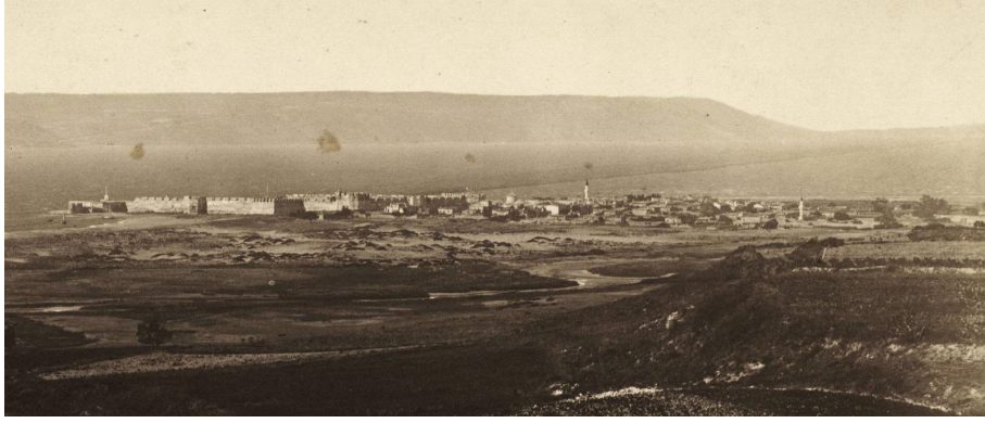
Görsel 1: 19'uncu Yüzyıl Sonlarına Doğru Kumkale Köyü

Kumkale, Çanakkale Boğazı girişinin Anadolu yakası ucunda; batı ve kuzeyini kaplayan deniz, güneyini kesen bataklık ve doğusunu kesen Menderes nehri arasında konumlanmaktadır. Köyün güneyindeki bataklık ile Menderes nehri arasında bir köy mezarlığı bulunmaktadır. Kumluk arazide, etrafı coğrafi sınırlılıklarla tespit edilmiş bu alan, askerî açıdan da sınırlılıklar barındırmaktadır. Kumkale muharebesi, içerisinde kale ve boşaltılmış yerleşim mekânları da olan, yaklaşık 0,6 kilometrekarelik dar bir alanda gerçekleşmiştir. (Bkz. Görsel 2)