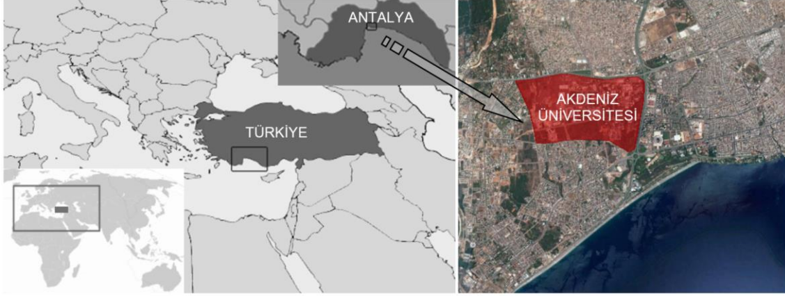
Şekil 3. Akdeniz Üniversitesi'nin konumu

3.483.589 m 2 arazi yüzölçümü ve 615.105 m 2 'lik yapı alanıyla geniş bir yerleşim alanına sahiptir (Akdeniz Üniversitesi, 2016).