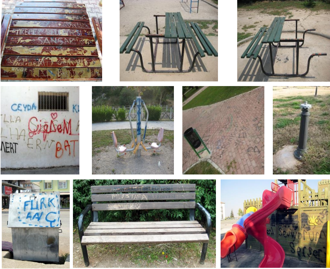
Şekil 2. Vandalizm eylemlerine maruz kalan donatı elemanları

Farklı şekillerde ortaya çıkan vandalizm eylemleri yaşamımızın hemen hemen her alanında görülebilmektedir (Şekil 2). Bu tür olayların sıklıkla meydana geldiği mekânların uzun bir liste oluşturacağını belirten Van Vliet (1984), bu mekânları beş grupta sınıflandırmaktadır. Bunlar: