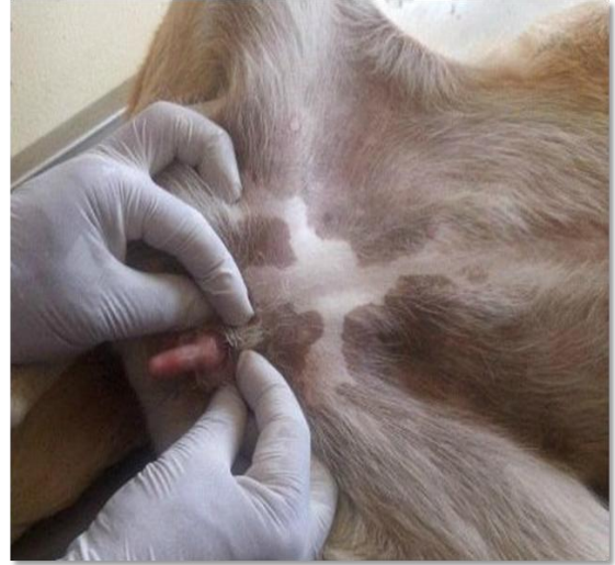
Figür 1: Klinik muayene sırasında belirlenen penis benzeri klitoris