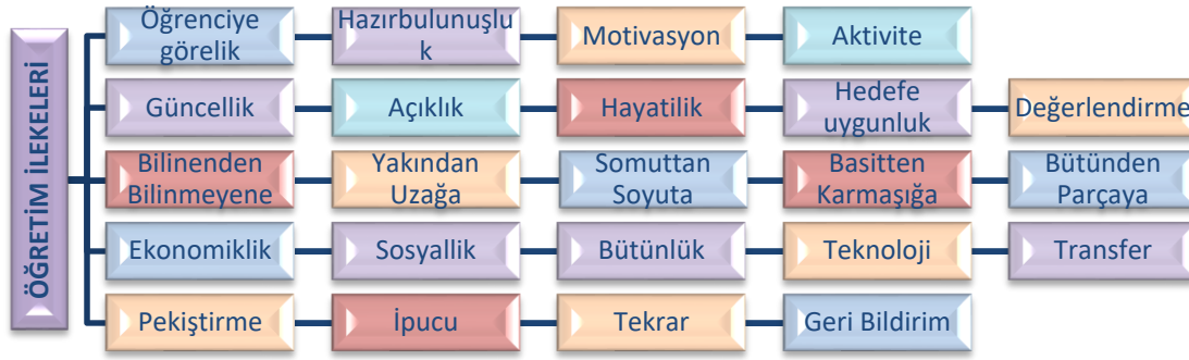
Şekil 1. Öğretim ilkeleri

Öğretimi bu ilkeler ışığında planlamak, tarihsel süreçte denenmiş ve başarılı sonuçlar alınmış uygulamalardan faydalanmak anlamına gelmektedir (Aslan, 2021). Öğretmenlerin öğretim ilkelerinin farkında olması ve bu doğrultuda derslerini işlemesi ne kadar önemli ise öğretmen ve öğrencilerin kullanımına sunulan ders kitaplarının öğretim ilkelerine göre hazırlanmış olması da aynı nedenle önemlidir (Aşçı, 2020). Bu bağlamda sosyoloji dersi öğretim programında belirlenen genel amaçlara ulaşılması amacıyla hazırlanan ortaöğretim sosyoloji ders kitabının öğretim ilkeleri açısından incelenmesi, bu araştırmanın problem durumunu oluşturmuştur.