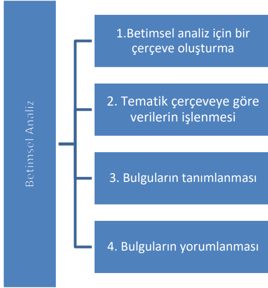
Şekil 2. Betimsel analiz yönteminin aşamaları

Araştırmada betimsel analiz yönteminin aşamaları doğrultusunda öncelikle ortaöğretim sosyoloji ders kitabından elde edilen verilerin hangi temalar altında işleneceği belirlenerek bir çerçeve oluşturulmuştur. Çerçevelerin oluşturulması aşamasında göz önünde bulundurulmuş ilkeler ise şunlardır: Açıklık, bilinenden bilinmeyene, bütünden parçaya, bütünlük, değerlendirme, ekonomiklik, etkin katılım, güncellik, hayatilik, hazırbulunuşluk, hedefe uygunluk, ipucu, somuttan soyuta, sosyallik, teknoloji ve yakından uzağa ilkesi. Ardından temalara göre veriler tablolara işlenmiş ve bulgular tanımlanmıştır. Son aşamada ise her ünite için ayrı ayrı hazırlanan tablolardan elde edilen veriler yorumlanmıştır. Analiz işlemlerinin nasıl yapıldığına ilişkin örnek şekil 3'te verilmiştir.