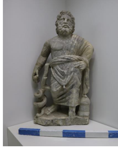
Resim 2: Savatra'da tespit edilen Asklepios heykelciği. (Konya Arkeoloji Müzesi)