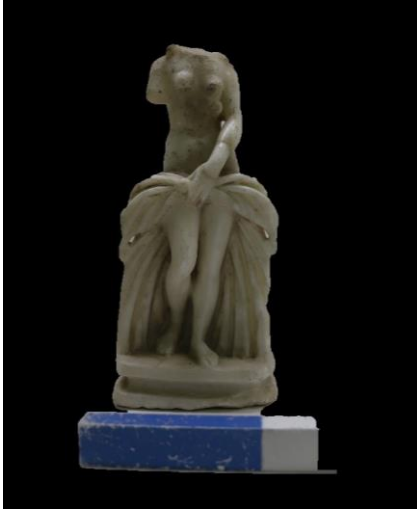
Resim 1: Savatra'da tespit edilen Aphrodite Landoline heykelciği. (Konya Arkeoloji Müzesi)