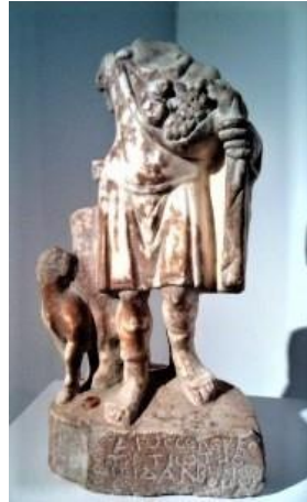
Resim 13: İspanya'da ele geçen Zeus Dalbenos'a adanan adak, Yébenes Perea, 2015: 313 Fig. 1. (yük. 28,5 cm, gen. 15 cm)