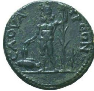
Resim 8: Savatra sikkelerinde görülen, ayakta tasvir edilmiş nehir tanrısı, https://rpc.ashmus.ox.ac.uk/coins/4/72 54