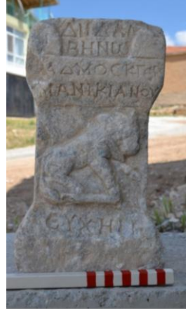
Resim 12: Savatra Antik Kenti'nde tespit edilmiş Zeus Dalbenos'a adanmış diğer adak.