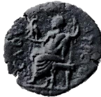
Resim 10: Savatra sikkelerinin arka yüzünde yer alan Zeus tasviri, von Aulock, 1976: no: 155.