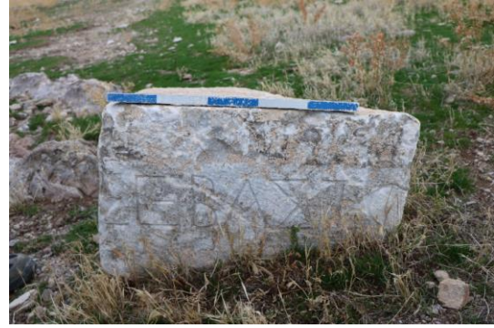
Resim 6: Savatra Antik Kentinde bulunan Σεβαστ[ῶ] yazılı mimari parça. (Savatra Kazı Arşivi)