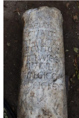
Resim 4: Zeus ile birlikte Eirene'ye adanan adak yazıtı. (yük. 66 cm, gen. 35 cm)