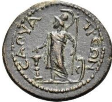
Resim 3: Savatra'da tespit edilen Athena tasvirli sikke