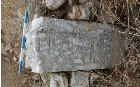
Resim 7: Savatra Antik Kenti'nde bulunan [πα]τρὶ πατρίδο[ς] yazılı mimari parça. (Savatra Kazı Arşivi)