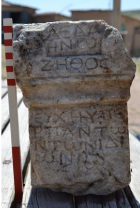
Resim 11: Savatra Antik Kenti'nde tespit edilmiş Zeus Dalbenos'a adanmış adak.