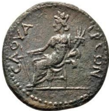
Resim 9: Savatra'da ele geçen Tykhe betimli sikke, https://rpc.ashmus.ox.ac.uk/coins/4/72 52