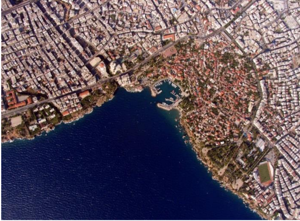
Foto 1- Antalya'da geleneksel yerleşim alanı etrafında oluşan yeni yerleşim alanları 2005.

Photo 1- New residential areas around Antalya's old city centre.