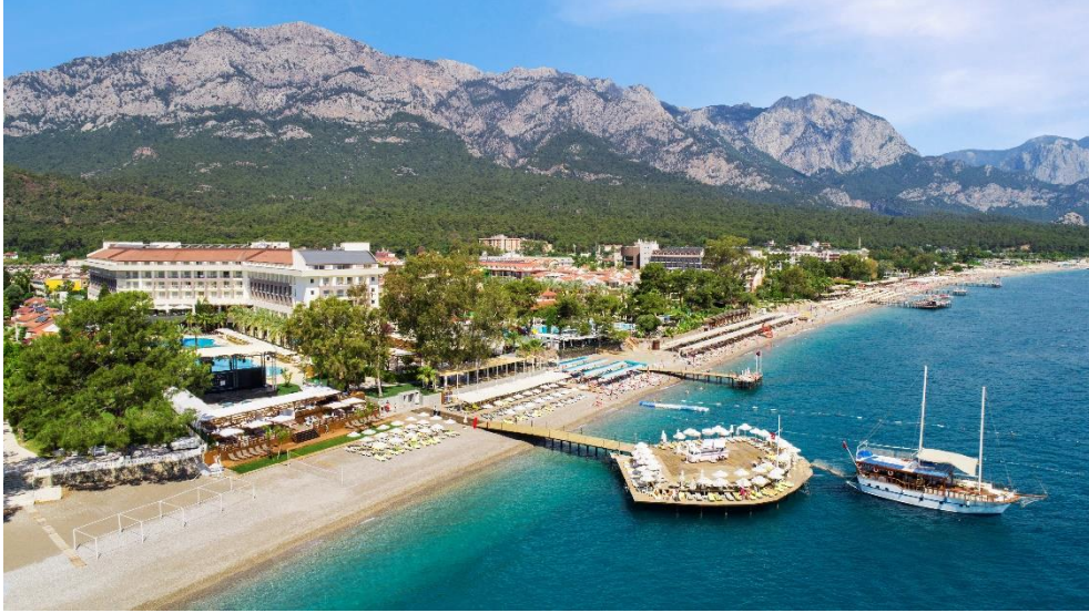
Foto 4- Kemer kıyılarında yer alan konaklama tesisleri. (Kaynak Double Terece by Hilton). Photo 4- Accommodation facilities on the coastal zone in Kemer.