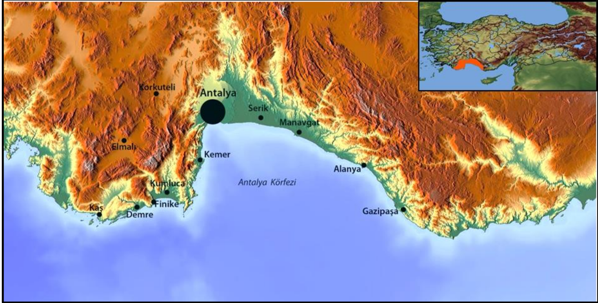
Şekil 1- Antalya'nın lokasyonu Figure 1- The location of Antalya

( http://yigm.kulturturizm.gov.tr (2)), Antalya'nın Türkiye turizmindeki önemini göstermesi bakımından önemli bir ipucu olarak kabul edilebilir.