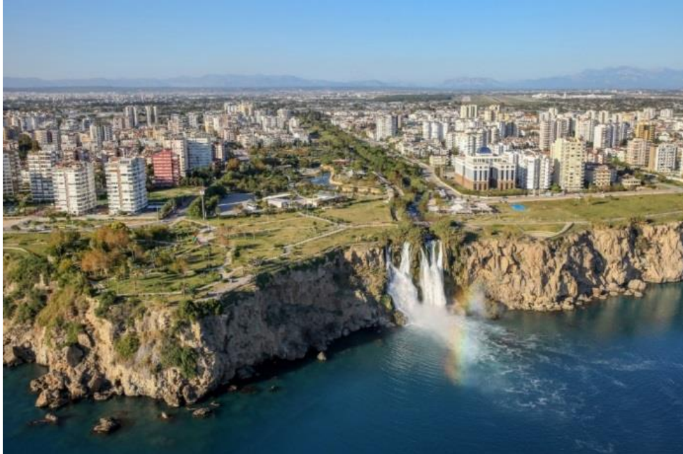
Foto 2- Yerleşim alanlarının genişlemesiyle oluşan kentin yeni görünümü.

Photo 1- New residential areas around Antalya's old city centre.