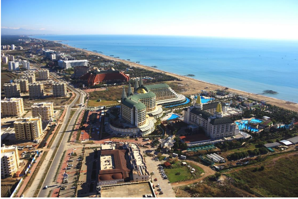
Foto 3- Antalya- Kundu Oteller bölgesi 2012. Photo 3- Hotels area in Antalya-Kundu.