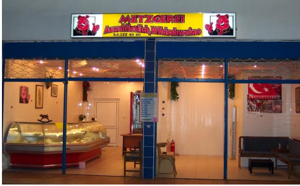
Foto 5- Alanya'da domuz kasabı Photo 5- A pork butcher in Alanya.