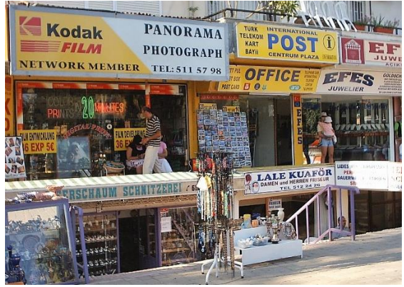
Foto 8- Yabancı dillerde tabelalar Photo 8- Signboards in foreign languages.