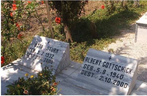
Foto 7- Alanya'da Hıristiyan mezarlıkları Photo 7- Christian cemeteries in Alanya.