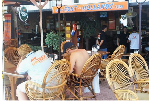
Foto 6- "Gerçek Hollandalı" adında bir bar Photo 5- A bar called "Real Dutch".