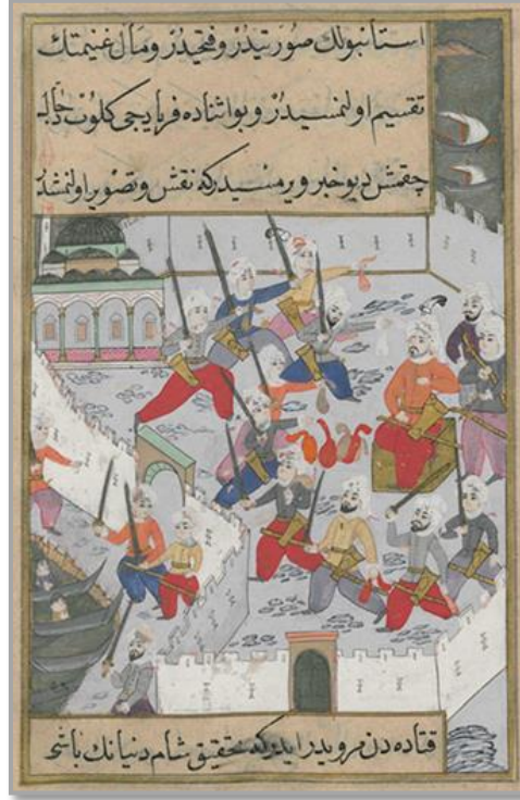
Şekil 4: İstanbul'un Fethi. ( Tercüme-i Miftah-ı Cifrü'l-Cami TSMK B.373 s.262)

Tercüme-i Miftah-ı Cifrü'l-Cami , 1597-98 yılları arasında Arapça'dan Türkçe'ye tercüme edilmiştir. Eserin çevirisini Şerif bin Seyyid Muhammed bin Şeyh Seyyid Burhan yapmıştır. Yazmanın aslı Abdurrahman b. Ali el-Bistâmi'nin tarafından kaleme alınan ed-Dürrü'l-Munazzam fî Sırrı'l-İsmi'l-A'zam 'dir. Eser genel olarak