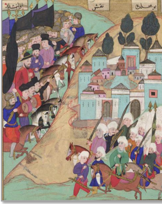
Şekil 7: Halep önlerinde Mehdi Ordusu ile Hristiyanların Karşılaşması. (Tercüme-i Miftah-ı Cifrü'l-Cami İÜK, T6624 s.164)

Tercüme-i Miftah-ı Cifrü'l-Cami adlı eserde şehir ve kale kuşatmalarını tasvir eden minyatürlerin yanında savaş meydanında bire bir çarpışan askerlerin tasvirleri bulunur. İncelediğimiz minyatür metinden anladığımız üzere Hristiyan ordularının Halep önlerine gelişini anlatmaktadır.