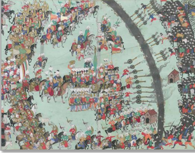
Şekil 2: III. Mehmet ve Haçova Meydan Muharebesi. (Şehnâme-i Sultan Mehmet III veya Eğri Fetihnâmesi TSM, H.1609 s. 50b-51a)

Minyatür, Sultan III. Mehmet'in Haçova Meydan Muharebesini tasvir etmektedir. Eser, Tâlikîzâde Suphi Çelebi tarafından şâhnâme tarzında yazılmıştır. Topkapı Sarayı Müzesinde H.1609 numaralı kaydıyla yer almaktadır. 1596 yılında bitirilerek hükümdara sunulmuştur.