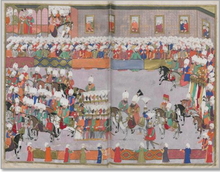
Şekil 3: III. Mehmet'in Haçova Meydan Muharebesinden İstanbul'a Dönüşü. (Şehnâme-i Sultan Mehmet III veya Eğri Fetihnâmesi TSM, H.1609 s. 68b-69a)

Savaş konulu minyatürlerden bir diğeri yine Şehnâme-i Sultan Mehmet III veya Eğri Fetihnâmesi adlı eserde yer almaktadır. Sefere çıkış, savaş alanı tasviri ve ardından savaştan dönüş minyatürü bütüncül olarak bir savaşın panoramik fotoğrafını çekmektedir.