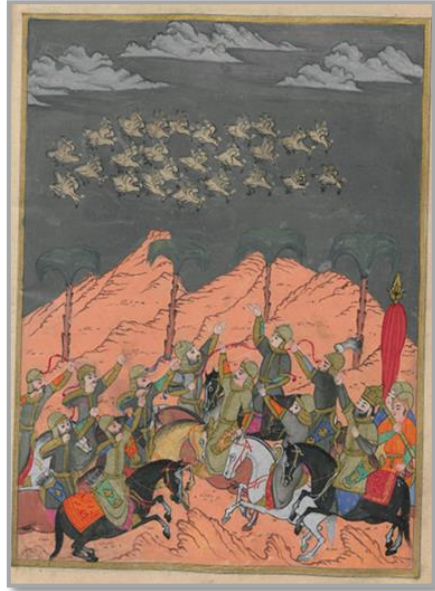
Şekil 6: Ebrehe'nin ordusu ve Ebabil Kuşları. (Siyer-i Nebî TSM, H.1221 s.264)

Peygamber efendimizin yaşamını ortaya koyan siyer kitapları, Hz. Muhammed'e (SAV) sunulan muhabbet ve hürmeti kaleme alan edebî türün ürünüdür. İncelediğimiz Siyer-i Nebî , Mustafa Darîr tarafından yazılmıştır. Eser, Topkapı Sarayı Müzesi Kütüphanesi'ndedir. (H.1221-H. 1222-H. 1223) III. Murad tarafından, 1595 yılında altı cilt olarak hazırlanmıştır. Eser, Sultan III. Murad'ın Ocak 1595'te vefatı sebebiyle yarıda kalmış