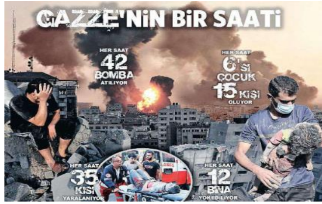
Görsel 20. Sözcü Gazetesi- 4 Kasım 2023