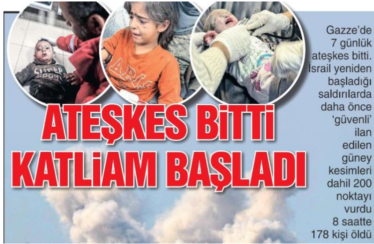
Görsel 26. Sözcü Gazetesi-2 Aralık 2023

Değerlendirme: Sözcü Gazetesi çatışmaların ilk günlerinde Gazze'ye ait haberlere ana manşetinde yer verirken ilerleyen günlerde Dünya sayfasında yer veriyor. Katliam haberleri çocuklar üzerinden resmediliyor.