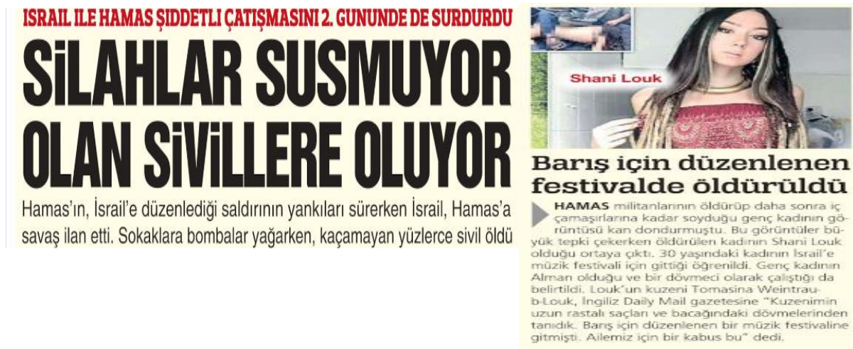
Görsel 4. Sözcü Gazetesi – 9 Ekim 2023

Değerlendirme: İsrail-Filistin arasındaki çatışmanın devam ettiği, sivillerin hayatını kaybettiği vurgulanıyor. Savaşın iki tarafının da mağduriyeti belirtiliyor.