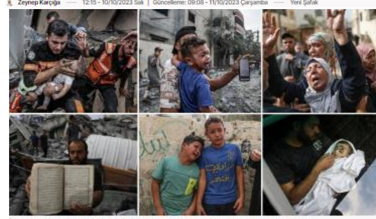
İsrail'in Gazze'ye düzenlediği hava saldırısında çok sayıda kişi hayatını kaybetti.