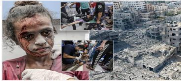
Gazze'de İsrail saldırıları sonucu bir gecede 110 Filistinli hayatını kaybetti

Sivil katliamının durdurulması yönünde dünyadan yükselen çağrılara rağmen gözlerini kan bürümüş İsrail güçleri ayırım yapmadan Gazze'yi bombalamaya devam ediyor. İsrail ordusu son bir gün içerisinde abluka altındaki Gazze Şeridi'nde 400 yeri vurduğunu duyururken, yapılan saldırılar sonrası bir gecede 120 Filistinli hayatını kaybetti.