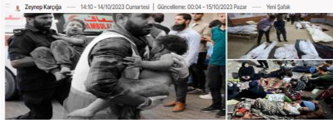
İşgalci İsrail'in Gazze'ye yönelik devam eden saldırıları nedeniyle evlerini terk eden çok sayıda aile, Şifa Hastanesi'ne sığındı.