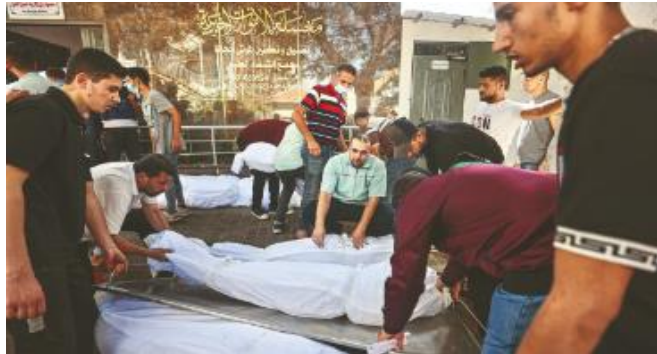
Görsel 19. Yeni Şafak 1-3 Kasım 2023

08:14 - 2/11/2023 Perşembe | Güncelleme: 08:53 - 3/11/2023 Cuma — AA