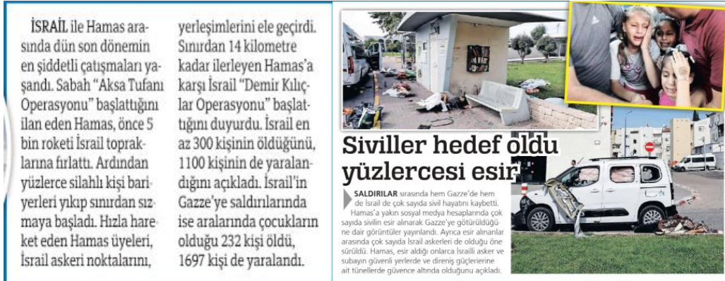
Görsel 1. Sözcü Gazetesi- 8 Ekim 2023

"İsrail ve Gazze'de yüzlerce sivil hayatını kaybetti. İsrail 'Demir Kılıçlar Operasyonu' başlattığını duyurdu. İsrail en az 300 kişinin öldüğünü, 1.100 kişinin de yaralandığını açıkladı. İsrail'in Gazze'ye saldırılarında ise aralarında çocukların olduğu 232 kişi öldü, 1.697 kişi de yaralandı."