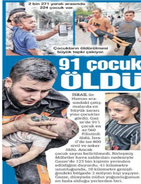
Görsel 6. Sözcü Gazetesi- 10 Ekim 2023

Değerlendirme: Sözcü Gazetesi çatışmalar sonucunda İsrail ve Gazze'den birçok insanın öldüğünü bildirirken aynı şekilde Yeni Şafak'ta da ölen sivillerin sayısı bildirilmiştir.