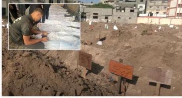
Görsel 23. Yeni Şafak- 14 Kasım 2023

Değerlendirme: Haberlerin genel söylemi ölüm üzerinden devam ederken haberlerin görsel malzemesi ceset fotoğraflarına mezarlık görüntüleri de eklenmeye başlamıştır.