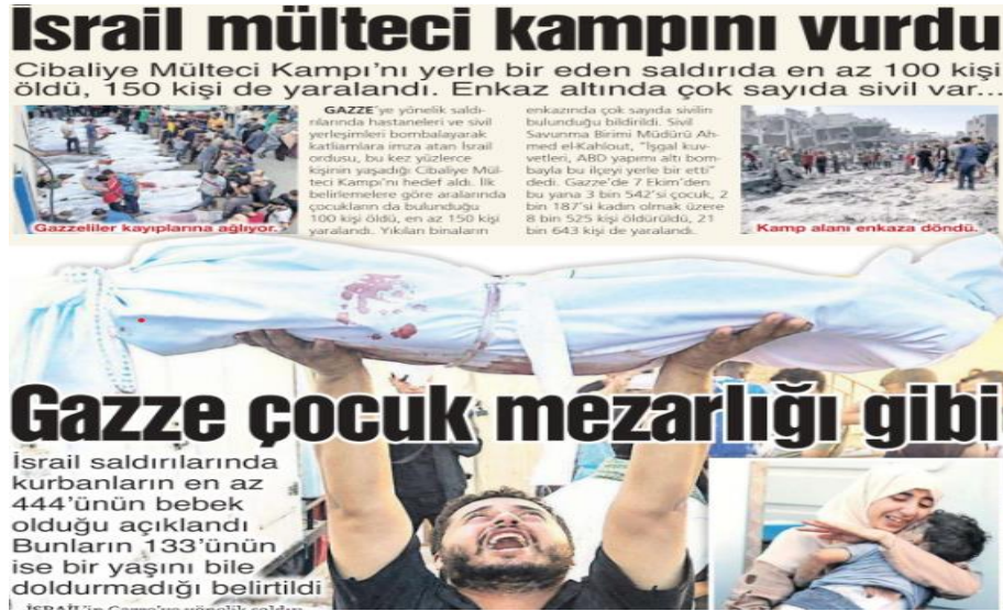
Görsel 18. Sözcü Gazetesi-1 Kasım 2023