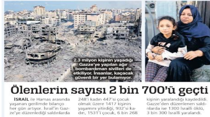
Görsel 10. Sözcü Gazetesi- 13 Ekim 2023

Değerlendirme: Sözcü Gazetesi'nde Hamas'ın İsrail'i roketle vurduğu ve 1000 kişiyi aşan ölü sayılarına ulaşıldığı belirtilirken İsrail'in de Gazze'yi bombaladığı bildirilir. Bütün çatışmalarda çocukların üzerinden haber metninin işlendiği gözden kaçmamaktadır. Savaşın iki tarafının da sorumlu olduğu tabir edilir. Yeni Şafak haber metninde ise İsrail'e dair "işgalci" nitelemesi devam ederken saldırıların faili olarak İsrail suçlanmaktadır. İlerleyen tarihlerdeki haberlerde politik ve siyasi söylemler haber metnlerine dahil Sözcü Gazetesi ölen insanların haberini aynı sıklıkla vermemiştir. Yeni Şafak haber sayfası ise gün içerisinde ondan fazla çatışmaya dair haber bildirerek Gazze yanlısı tutumunu devam ettirmiştir.