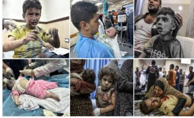
Gazze'de hastaneler acı ve gözyasıyla dolu.