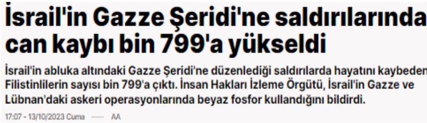
Görsel 11. Yeni Şafak- 13 Ekim 2023

Değerlendirme: Sözcü Gazetesi Haber.1 ve Haber.4, Haber.6 ve Haber.8'de nesnel ve genel bir haber dili kullanmış, çatışmalar karşılıklı bir şekilde ilerlerken hem İsraili hem de Filistinli sivillerin ve çocukların öldüğünden bahsedilmiş, özellikle Haber.10'da çatışmaların seyrinin değişmesiyle birlikte Filistin, Gazze odaklı haber vermeye başlamıştır. Aslında Yeni Şafak bu odağı ilk haberinden itibaren yapmıştır.