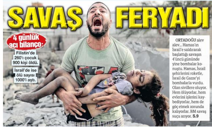
Görsel 8. Sözcü Gazetesi- 11 Ekim 2023

Değerlendirme: İlk haberlerde bombalama ve enkaz görüntüleri verilirken ilerleyen günlerinde çocukların görüntüleri paylaşılarak ölü ve yaralı sayıları verilmiştir. Çocuk ölümleri haberlerin manşetine taşınmıştır.