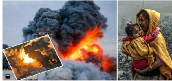
Katil İsrail katliama doymuyor

Seda Ekinci — 08:39 - 5/11/2023 Pazar | Güncelleme: 06:59 - 6/11/2023 Pazartesi — Yeni Şafak