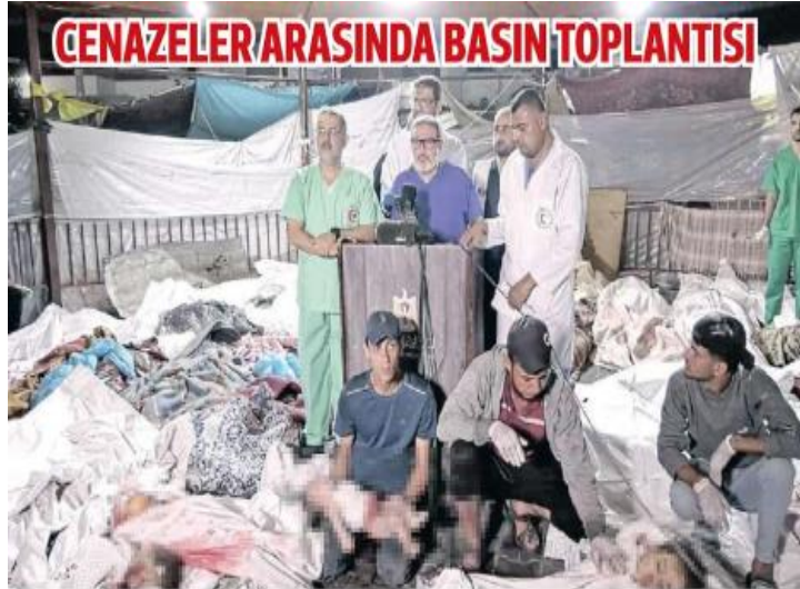
Görsel 14. Sözcü Gazetesi-19 Ekim 2023