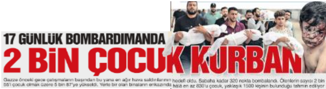
Görsel 16. Sözcü Gazetesi- 24 Ekim

Değerlendirme: Sözcü haberini sürmanşet olarak vermiştir. Yapılan haberlere göre üstü kapalı cenazeler yerde yatarken aralarında bebeklerin de olduğu görsel çarpıcıdır, artık haber odaklarında cenazeler ve yaralı çocuk görüntüleri yer alır.