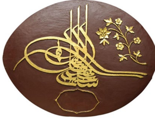
Fotoğraf 1: Sultan III. Selim’e Ait Tuğra Örneği

Tuğranın sere bölümünde sülüs ve dîvanî hat ile “ Selim Han bin Mustafa el-muzaffer daima ” yazılmıştır. Tuğranın sere kısmı dışında beyzeler, kollar ve zülfeler de yuvarlak satırlı oyma tekniğindedir. Tuğlarda ise düz satırlı oyma tekniği kullanılmıştır. Tuğranın sağ üst tarafında bir kıvrık dal üzerine işlenen çiçek ve yaprak motiflerinden oluşan bitkisel süsleme yer almaktadır. Bitkisel kompozisyon, kıvrımlı dalın iki yanında çiçek ve seberg yaprak motiflerinin yüzeye oyulmasıyla oluşturulmuştur.