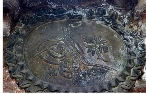
Fotoğraf 13 (İstanbul Deniz Müzesi Arşivinden): Örnek 3'e Ait Fotoğraf