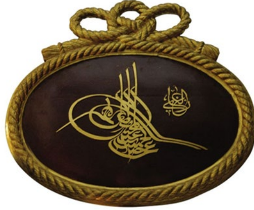
Fotoğraf 9 (İstanbul Deniz Müzesi Arşivinden): Sultan II. Abdülhamid'e Ait Tuğra Örneği