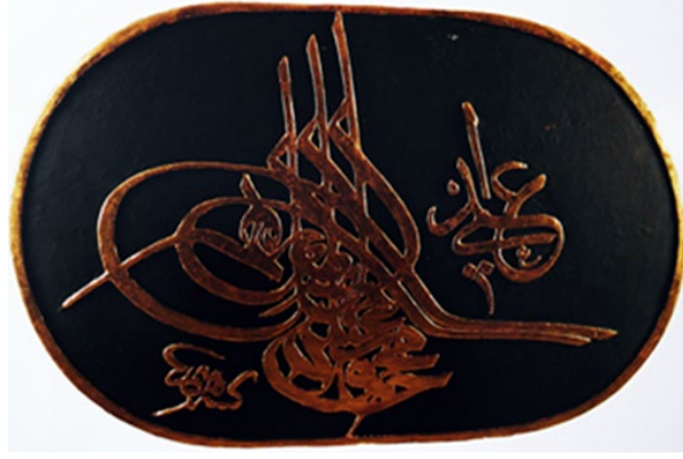
Fotoğraf 2 (İstanbul Deniz Müzesi Arşivinden): Sultan II. Mahmud'a Ait Tuğra Örneği