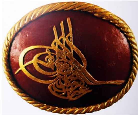
Fotoğraf 7: Sultan Abdülaziz'e Ait Tuğra Örneği

119 envanter numaralı levha, 39x30,5 cm. ölçülerinde, kırmızı zemin üzerine altın varaklıdır. Sultan Abdülaziz (1861-1876)'e ait levha, yuvarlak şekle yakın oval formda gürgen ağacından yapılmıştır. Tuğra, kırmızı zemin üzerine düz ve yuvarlak oyma tekniğindedir. Kürsü bölümünde “ Abdülaziz Han bin Mahmud el-muzaffer daima ” sülüs ve dıvanî hat ile yazılmıştır. Tuğrayı dıştan çevreleyen altın varaklı bordür halat şeklindedir. Halat üzerindeki ayrıntıları göstermek için kazıma tekniğinde yivli şekiller yüzeye işlenmiştir. Tuğranın çevresindeki halat bordürü dışında, eser oldukça sade ve süslemesiz şekilde tasarlanmıştır.