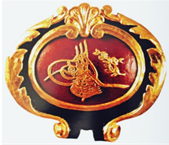
Fotoğraf 10: Sultan II. Abdülhamid'e Ait Tuğra Örneği

Tuğranın seresinde “ Abdülhamid Han bin Abdülmecid el-muzaffer daima ” yazısı bulunmaktadır. Bu örnekte de tuğra ve bitkisel motifler düz ve yuvarlak sathlı olacak şekilde yüzeye işlenmiştir. Tuğranın sağ tarafına kıvrık dal, yaprak ve gül motifi işlenmiştir. Tuğranın bulunduğu oval levhayı dıştan “C” kıvrımlı ve uçları volütlü bir şerit çevrelemektedir. Dıştaki simetrik bitkisel motifler “C” şekilli, uçları kıvrımlı yaprak motiflilerinden oluşmaktadır. Levhanın üst orta bölümde dilimli stilize beş dilimli basit yaprak motifi yer almaktadır. Dıştaki bitkisel motif ile oval levha arasında kalan süslemesiz bölüm siyah renkte boyanmış ve derin bir şekilde oyulmuştur.