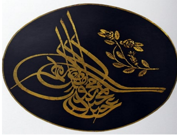
Fotoğraf 4: Sultan Abdülmecid'e Ait Tuğra Örneği

Tuğranın sağ tarafında yer alan bitkisel bezemede ise stilize yaprak ve gül motifleri kullanılmıştır. Bitkisel kompozisyon kıvrımlı dallar üzerine dilimli yaprak motifleri tepe kısmına kadar oyulmuştur. Tepe bölümünde ise iki adet gül motifi oyulmuştur.