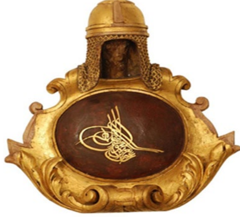
Fotoğraf 5(İstanbul Deniz Müzesi Arşivinden): Sultan Abdülaziz'e Ait Tuğra Örneği

Miğferin gövdesindeki yüz kısmı zincir örme bir zırh peçelikle sınırlandırılmıştır. Miğferin başlık kısmı yatay iki şeritle ayrılmış yarım küre biçimindedir. Ayrıntılı bir şekilde yüzeye işlenen peçelik, yuvarlak satırlı oyma tekniğinde ve az derinlikli olacak şekilde yapılmıştır.