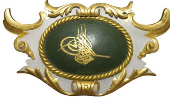
Fotoğraf 8: Sultan Abdülaziz'e Ait Tuğra Örneği

yapraklar levhayı süslemektedir. Tuğranın seresinde “ Abdülazîz Han bin Mahmud el-muzaffer daima ” duası sülüs ve dîvanî hat tekniğinde işlenmiştir. Dıştaki bitkisel kompozisyonda ise akant yaprağı ve volüt kıvrımlar birlikte kullanılmıştır. Volüt kıvrımların iki tarafına akant yaprakları oyularak düzenlenmiştir. Tuğra bölümü ise düz ve yuvarlak satırlı oyma tekniğinde yüzeye oyulmuştur. Altın varaklı bitkisel kompozisyon, yuvarlak satırlı oyma tekniğinde oldukça derin olacak şekilde oyulmuştur. Böylece söz konusu bitkisel kompozisyonda plastik etki artırılmıştır.