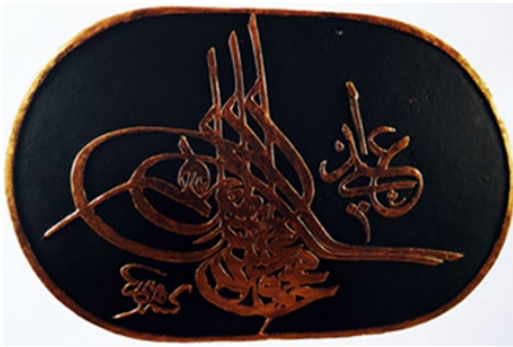
Fotoğraf 11: Örnek 2'ye Ait Fotoğraf

Örnek 5 şekil bakımından, incelenen eserler arasında en dikkat çekici tasarıma sahiptir. Eser, diğer örneklerde olduğu gibi Barok tarzında bitkisel süslemelere sahiptir. Ancak, eserin üst kısmında bulunan miğfer ve aşağı doğru dökülen peçelik incelenen örnekler arasında benzersiz özelliğe sahiptir. Eser, Sultan Abdülaziz'in tuğrasını taşımanın yanında militarist özelliktedir. Bu bakımdan tuğra bir bütün olarak değerlendirildiğinde; levha ve levhayı çevreleyen bitkisel motifler insan gövdesi, zırlı miğfer ise gövdeye ait kafayı andırarak biçimde tasarlanmıştır.