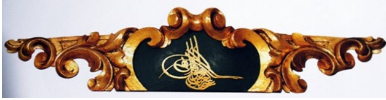
Fotoğraf 6 (İstanbul Deniz Müzesi Arşivinden): Sultan Abdülaziz'e Ait Tuğra Örneği