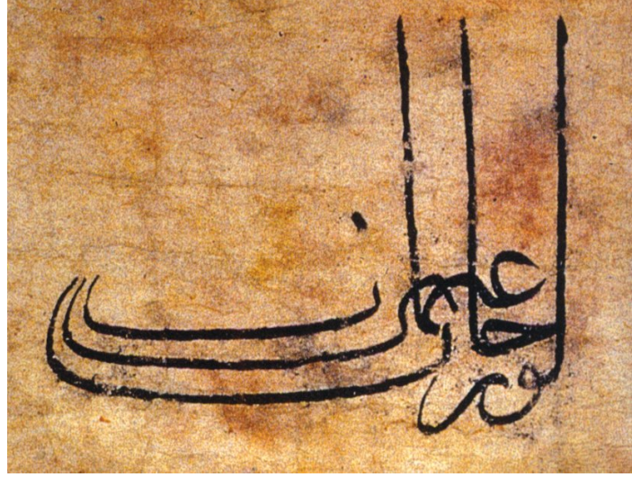
Resim 1 (Derman, 2012: 336): Orhan Gazi Tuğrası

Osmanlı'da ilk padişahlara ait tuğralar sade çizgiler kullanılarak yazılmışlardır. Ayrıca Osmanlı'nın ilk tuğra örneklerinde padişah babasının ismiyle anılacak şekilde düzenlenmiştir (Orgun, 1949: 201). Osmanlı'nın Orhan Gazi'ye ait ilk tuğra örneğinde Arapça "Orhan bin Osman" yazmaktadır. Orhan Gazi'den sonraki dönemlerde ise padişah tuğralarına han, şah ünvanları ve "muzaffer daima", "muzaffer el-daima" duası eklenmiştir (Umur, 1982: 28).