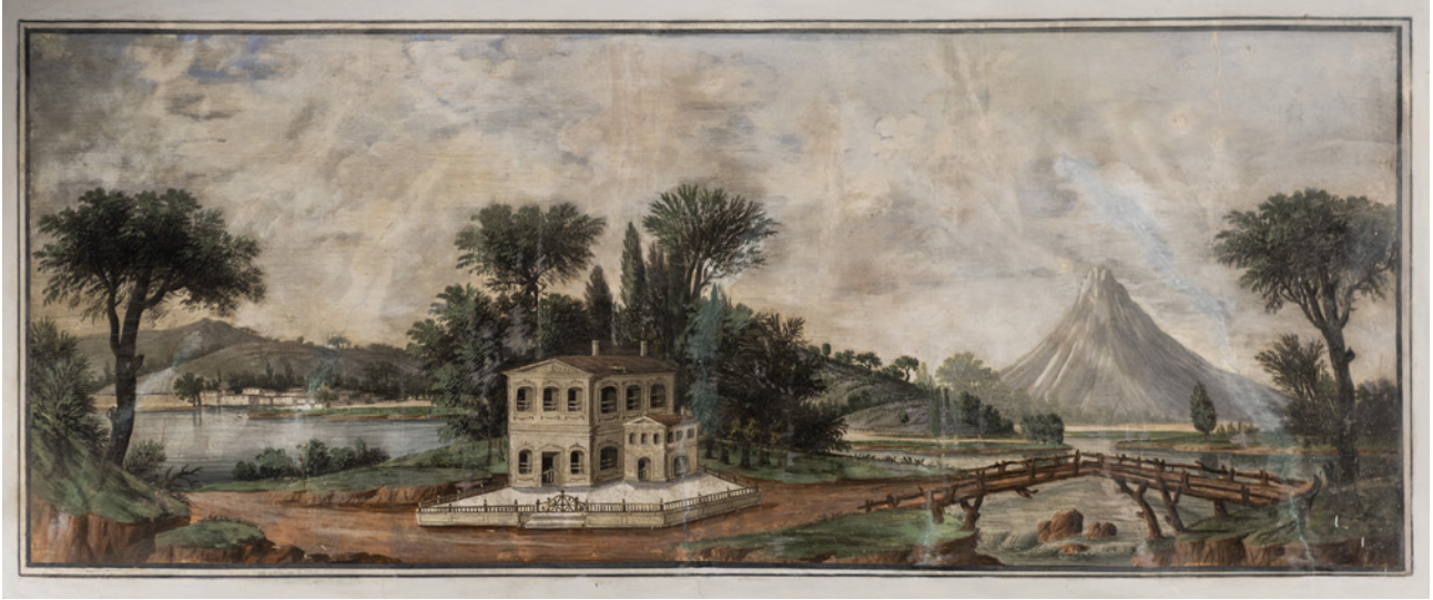
9 Bâbü's-Saâde revak saçak altı manzara resmi

tarihlenen resimlerde dağ, deniz, ağaçlar gibi doğa motiflerinin yanı sıra Türk evi, köprü, İyon sütunlu yıkıntı gibi mimari unsurlar da yer almaktadır. 27 (Resim 9-10)