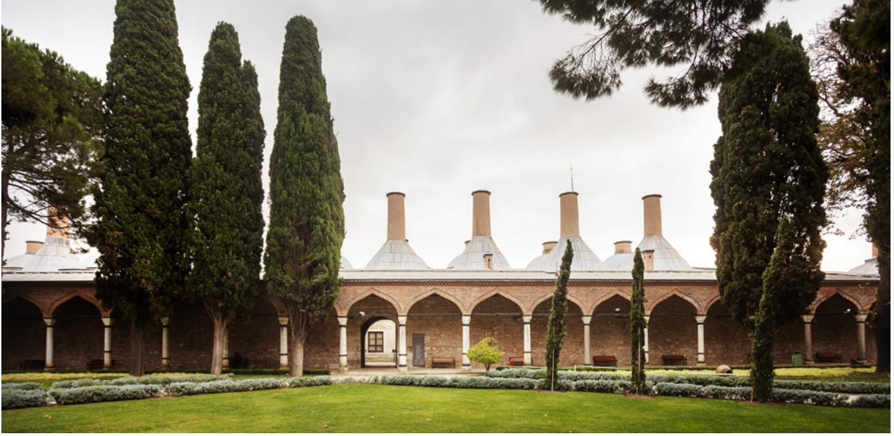
14 Marmara Denizi yönündeki avlu revakları

Avlunun Marmara Denizi'ne bakan cephesindeki revak alanı, mutfak duvarına bitişik, uzun ve kesintisiz bir şekilde boydan boya devam etmektedir. Kırk bir adet mermer sütunla taşınan revak, tuğladan sivri kemerli, gergi çubuklu ve iki sıra kirpi saçaklı bir görünümündedir. İkinci Avlu'dan Matbah-ı Âmire bölümüne, revak duvarında yer alan üç adet kapı ile geçilmektedir. Bu üç kapı; Babü's-Selâm'dan Bâbü's-Saâde yönüne doğru sırasıyla, sekiz ile dokuzuncu, yirmi dört ile yirmi beşinci ve otuz beş ile otuz altıncı sütunlar arasında yer almaktadır. Revak alanında tüm sütun başlıkları baklavali, sade bir biçimde olup sadece kapı hizasında olanlar, belki girişi vurgulamak adına mukarnaslı başlıklıdır. Mutfak duvarlarına paralel revak alanı yaklaşık 4,20 m genişliğine, sütun araları ise 3,30 m ölçüsüne sahiptir. (Resim 14)