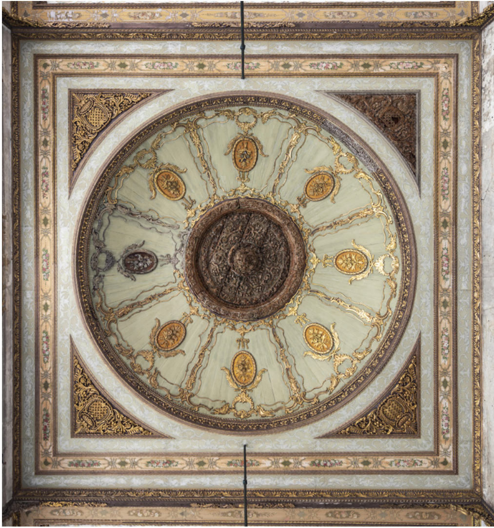
4 Bâbü's-Selâm revak tavan detayı

Fatih Sultan Mehmed döneminde yapılan Bâbü's-Selâm'ın kulelerinin şeklinin Kanûnî zamanında değiştirildiği, İkinci Avlu'ya bakan geniş saçaklı revak alanının ise Sultan III. Mustafa döneminde bugünkü görünümünü aldığı görüşü benimsenmektedir. 20