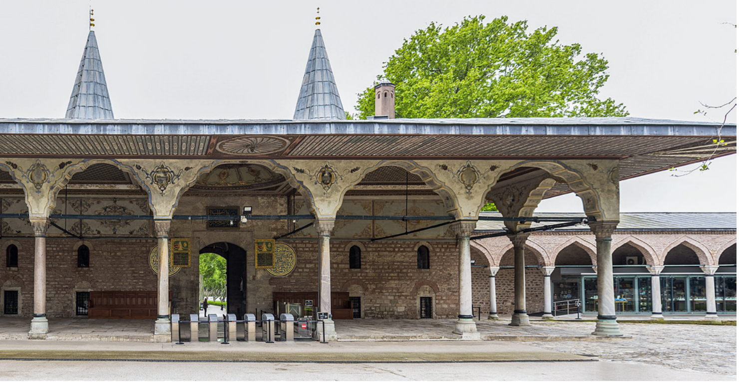
2 Bâbü's-Selâm revakı