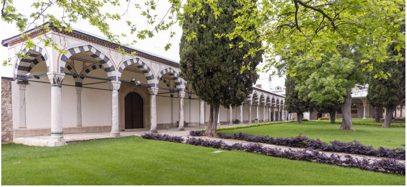
15 Haliç yönünde uzanan avlu revakları

taş malzemedendir. (Resim 15) Diğer avlu revak duvarları sıvasız bırakılmış olduğu hâlde bu alanda duvarlar beyaza boyanmış ve duvar üzerine her sütunun hizasında sütun, sütun başlığı ve siyah-beyaz kemer resmi yapılmıştır. Beyaz renkli mermer sütunların sütun başlıkları altında ve kaideleri üstünde görülen siyah renkteki birer bilezikle beyaz renk monotonluğu kırılmaktadır. Tavanlar, Bâbü's-Saâde yanında uzayan revak tavanları ile aynı şekilde, yıldızlı çitalarla sarı ve gri tonlarında renklendirilmiştir.