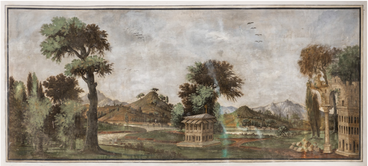
10 Bâbü's-Saâde revak saçak altı manzara resmi