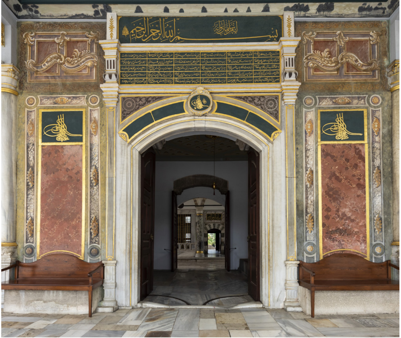
8 Kapı üzerindeki kitâbeler

Kapının İkinci Avlu'ya bakan cephesinde görülen, yeşil zemin üzerine altın varakla yazılmış kitâbeleri, yapıya ayrıca estetik bir değer katmaktadır. Üstelik giriş kapısının en üstündeki celî sülüs hatlı kitâbe bizzat Sultan II. Mahmud tarafından yazılmıştır. Altındaki celî ta'lik kitâbe ise Sultan I. Abdülhamid zamanında yapılan onarımlara aittir. Kapı kemerinin üzerindeki Sultan II. Mahmud'un tuğrası, Hattat Râkım Efendi tarafından yazılmıştır. Kapının sağında ve solunda ise Sultan I. Abdülhamid'i öven, tuğra şeklinde iki levha mevcuttur. 26 (Resim 8)