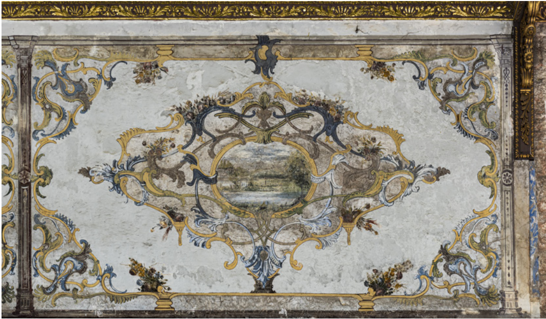
6 Saçak altı manzara panolarından biri

Kapının giriş aksı üzerinde yer alan bu zengin tavan ve saçak süslemeleri, duvarda yer alan kitâbeler ve manzara resimleri, estetik yönden avlu girişine büyük bir zenginlik katmaktadır.