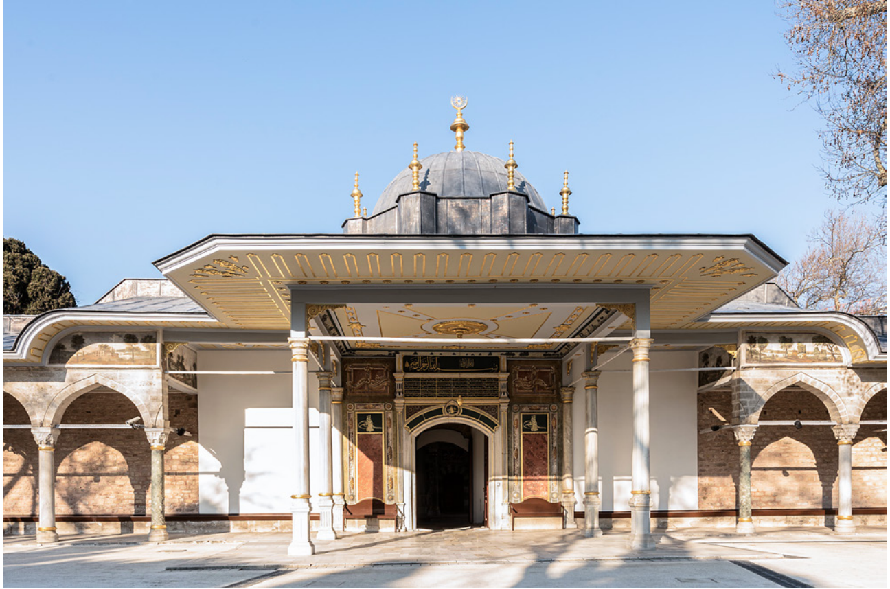
7 Bâbü's-Saâde revakı

Kapının üzerinde, âdeta yapının önemini vurgular nitelikte, altı adet alemlî küçük kulelerle yükselen kurşundan bir kubbe vardır. Kubbenin üzerine yıldızlı bir alem konulmuştur. 25 Ahşap süslemeli