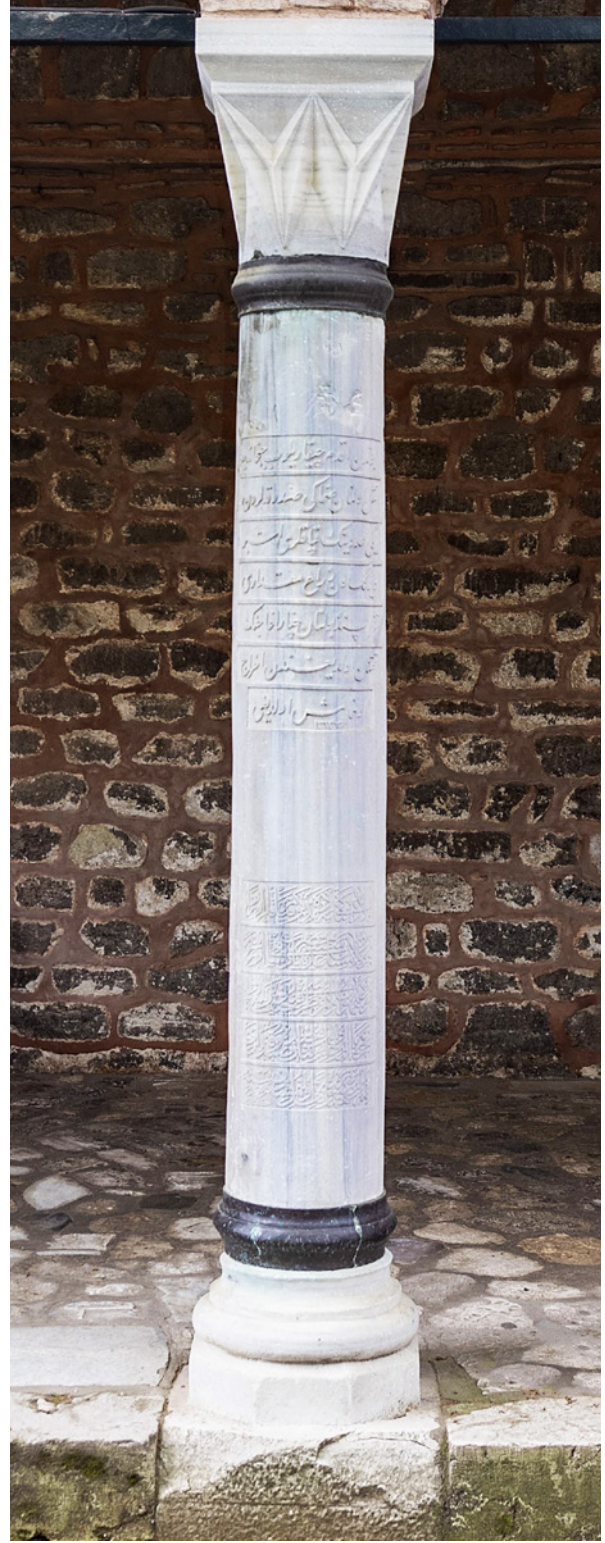
13 Kitâbeli sütun