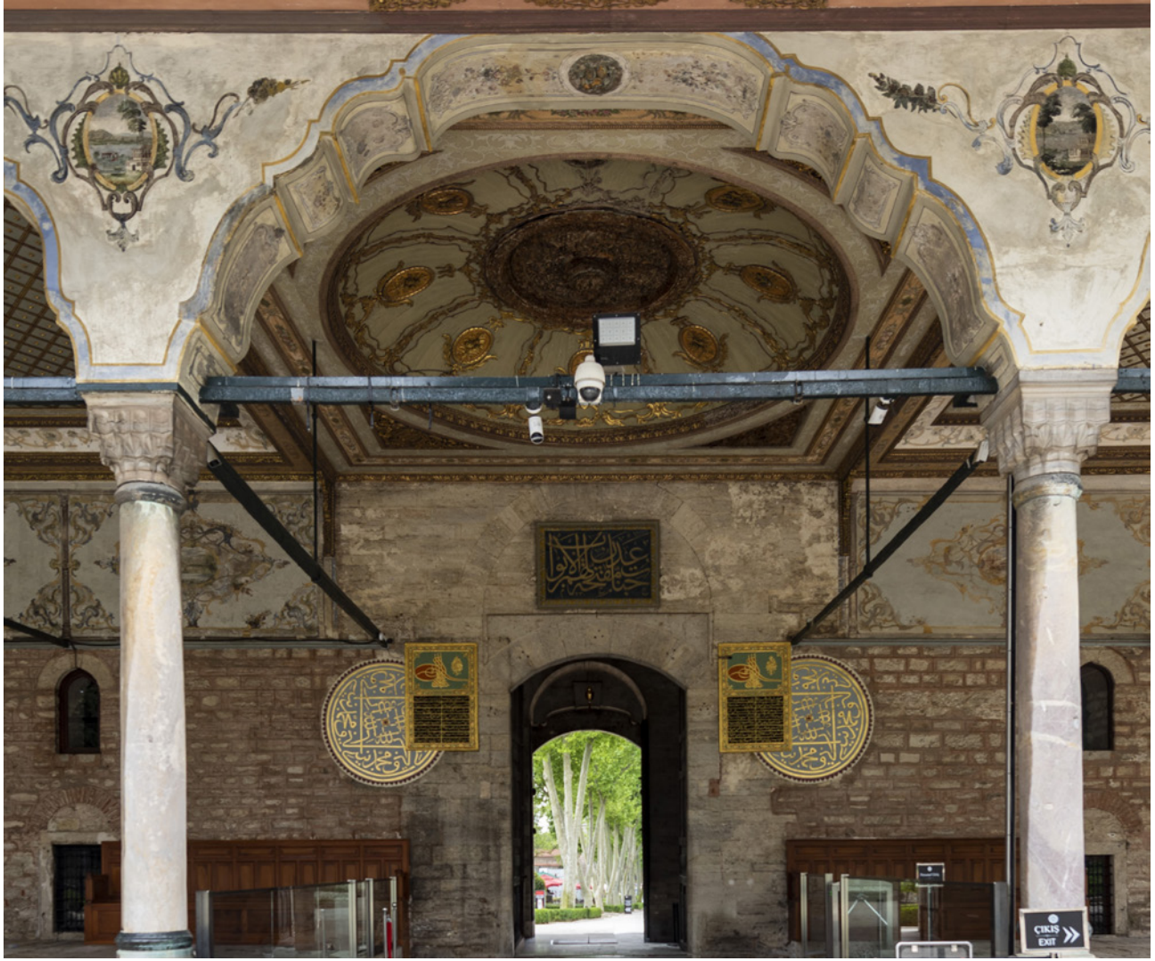
3 Bâbü's-Selâm II. Avlu giriş kapısı

konumlandırılmıştır. Kitâbelerdeki yazılar dikkate alındığında, revakla ilgili ifadeler bulunduğu saptanmıştır. Sağ taraftaki kitâbede “ Seyredince sakf-ı eyvanın o Cem-cah-ı be-nam ” ile “ Emredub hedmin binâ-yı köhne tarh-ı sakfın Tarz-ı üslûb-ı kadîmin eyledi tecdid-i tamam ” ifadeleri geçmektedir. Sol taraftaki kitâbede ise “ Ziyet-i nakşine nisbet çarh-ı atlas bî nûkûş Sakafine tak-ı felek olmaz ziyânında köhne bâm ” 18 yazılıdır. Kitâbelerde geçen