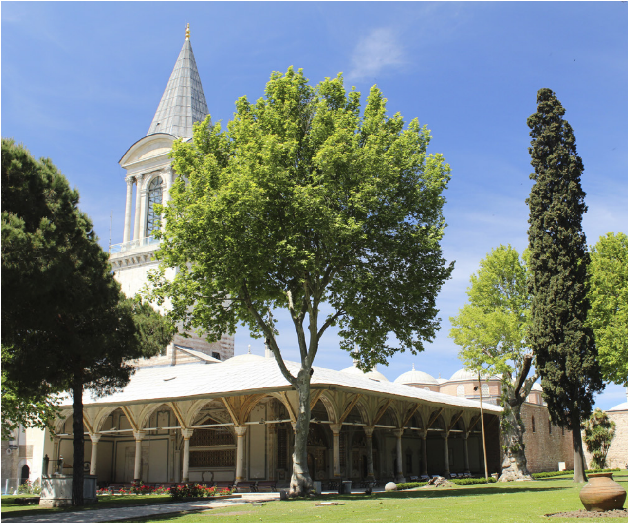
11 Divan-ı Hümâyûn revakı

şeklinde, geniş saçaklı bir revak bölümü bulunmaktadır. (Resim 11) Duvardan 6 m, avlu yönünde 35 m genişliğinde, yan cephede ise 20 m boyunca uzayan revak, Divanhâne önünde giriş revakı niteliğinde bir mekân oluşturmaktadır. Avlu cephesinde her iki sütun, yerden 25 cm yüksekliğinde ve 70 cm boyunda kaideler üzerine yerleştirilmiştir. 2,70 m yüksekliğindeki sütunlar, 4,30 m aralıklarla konumlanmaktadır. Revak döşemesi mermerden yapılmıştır, ayrıca Divanhâne'nin iki giriş kapısı önünde kenarları kıvrımlı birer mermer basamak yer almaktadır.