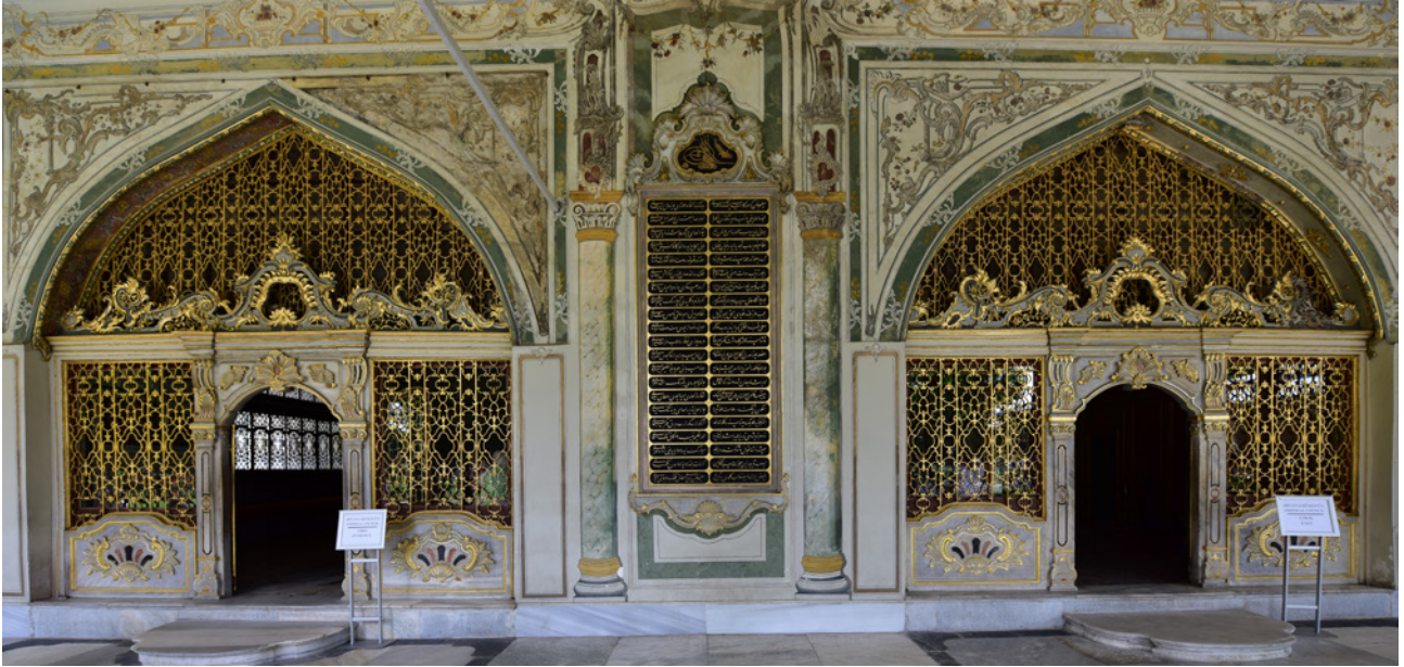
12 Divan-ı Hümayûn giriş kapıları

giriş kapıları yer almaktadır. Kapının her iki yanında, süslü mermer levhalar üzerine oturtulmuş, altın yaldızlı demir parmaklıklar bulunmaktadır. Mermer kapının üzerinde üç bölümlü, Barok ve Rokoko kıvrımlı, bitkisel ve dalga motifleri içeren yaldızlı bir süsleme vardır. Kapı duvarına revak sütunlarının karşısına gelecek şekilde kalemî, bitkisel ve çiçek motifleriyle desteklenen sütun ve sütun başlıkları resmedilmiştir. Sadrazam Dairesi'nin giriş cephesi ve kapısı üzerinde de aynı üslupta kalemîleri devam etmektedir. Revak bölümündeki yaldızlı süslemeler ve kalemîleri dışında, mekâna estetik değer katan kitâbeler de vardır. Giriş cephesi kapısının sağında ve solunda görülen Sultan II. Selim ile Sultan II. Mahmud'a ait iki adet onarım kitâbesi ve Sultan III. Mustafa'ya ait tuğralar, mekânının estetik değerini artırır niteliktedir. Her iki levha da yeşil zemin üzerine altın varakla, celi ta'lik hattı ile kabartma tekniğinde hakkedilmiştir. 30 (Resim 12)