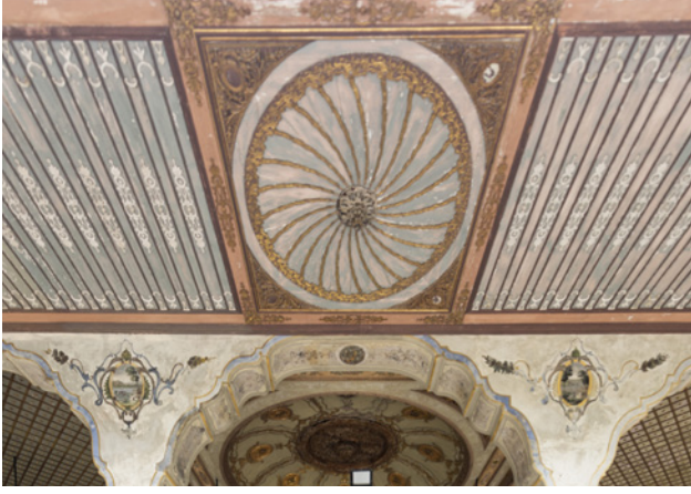
5 Bâbü's-Selâm revak saçak detayı

ile ortasından aşağıya sarkan bir bitkisel bezeme yer almaktadır. (Resim 5) Giriş hizasında bulunan iki sütun arasındaki kemer aralarında, beyzi bir formun içinde manzara resmi görülürken, diğer avlu tarafına bakan kemer aralarındaki beyzi bölüm boş bırakılmıştır. Kapı hizası dışındaki tavan süslemeleri, ortaları yıldızla noktalanmış ahşap çıtalarla baklava deseninde veya kafes örgüsü şeklinde döşenmiştir. Saçak altları ise ince uzun