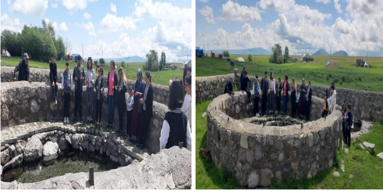
Görsel 3-4. Balıklı Göl'e Gelen Ziyaretçiler

Bireyler, zorlu zamanlardan geçişte, ruhsal iyileşmede ve bedensel şifalanmada bir köprü işlevi gören ritüelleri yaratıp uygulayarak karanlık dönemleri geride bırakmaktadırlar. Bu dönemlerde kutsal olayları sembolize eden mumlar aracılığıyla aydınlanma, ışık, umut, doğum ve dua gibi kavramlarla manevi bir bağlantı kurmaktadırlar. Böylece mumlar dileklerin gerçekleşmesi için ritüellerde birer sembolik araç hâline gelmektedir. Balıklı Göl'de kaynak kişilerden elde edinilen bilgilere göre, bölge halkı dileklerinin yerine gelmesi için bazı cuma günleri gölün etrafında mumlar yakıp isteklerini dile getirmektedirler. Perşembe akşamları ise özellikle genç kızlar, bu alanda mum yakarak ve ekmeğe doğrayarak buradaki ritüellere katılmaktadır (KK-1, KK-3). Genç kızların dileklerinin gerçekleşmesi umuyla veya gerçekleşen dileklerinin ardından Balıklı Göl'de bulunan balıklara ekmeğe doğrayıp atması, gölün saçı alma 4 yetisine sahip olduğunu göstermektedir.