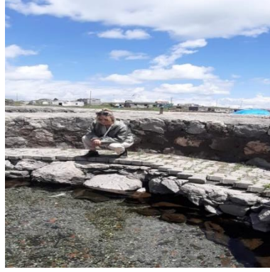
Görsel 8. Balıklı Göl'e Dilek Dilemeden Bir Görüntü

Görüşmelerde kaynak kişilerin verdiği ortak bilgilerden biri, Balıklı Göl'ün iyileştirici özelliğinin sadece göle inanan kişilerde görüldüğüdür. Kaynak kişilerin tamamına yakını göle niyaz ederek girdiklerini belirtmektedir. Tedavi amacıyla gidilen bu mekânın, ziyaret için belli bir gün ve zamanı yoktur, ihtiyaç duyulduğu her an ziyaret edilebilmektedir.