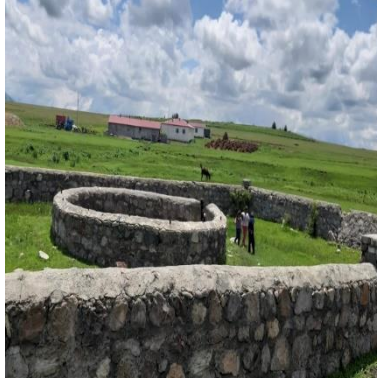
Görsel 1. Kars İli Selim İlçesi Dölbentli Köyü'ndeki Balıklı Göl ve Çevresi

Bölgede anlatılan diğer bir rivayete göre, bu balıklar Sarıkaş Harekâtı'nda Allahuekber Dağları'nda yaralanan askerlerdir. Öyle ki kaybolup geri dönen balıkların yaralı oldukları görülmüştür (KK-5). Söz konusu inançlardan dolayı göl, bölge halkı tarafından "şehitlik" ve "ziyaret" olarak anılmaktadır.