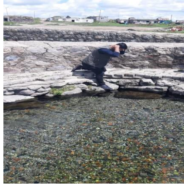
Görsel 7. Balıklı Göl'den Şifa Beklentisiyle El Yüz Yıkama

Kutsal sular, tarih boyunca halk hekimliğinde büyük bir öneme sahip olmuştur. Hem bedensel hem de zihinsel açıdan sağlık ve refah üzerinde olumlu etkiler sunarak önemli bir deneyim sağlar. Mide rahatsızlıkları yaşayan kişiler gölün suyundan içer ya da daha sonra içmek için suyu yanında götürürler (KK-9).