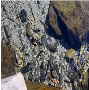
Görsel 2. Balıklı Göl'deki Balıkların Görünümü