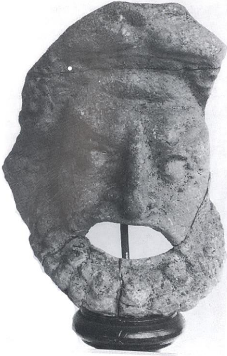
Tiyatro Maskeleri (İstanbul Arkeoloji Müzesi)