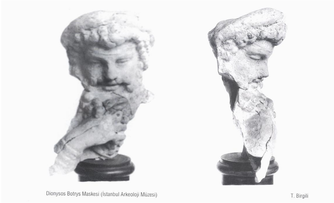
Dionysos Botrys Maskesi (İstanbul Arkeoloji Müzesi)