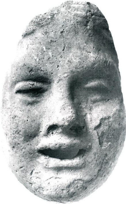
Tiyatro Maskeleri (İstanbul Arkeoloji Müzesi)