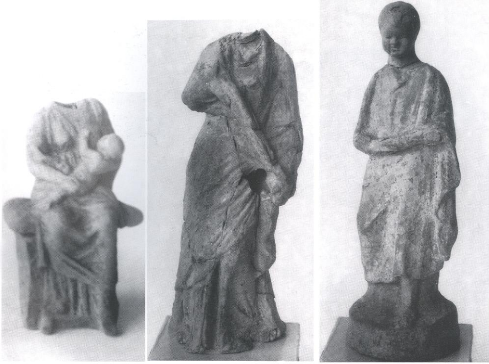
İki Kadın ve Epheb Heykelciği (İstanbul Arkeoloji Müzesi)