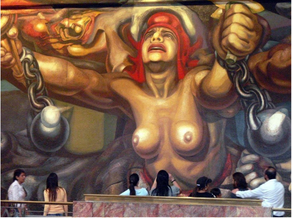
(Resim2: David Alfaro Siqueiros, La Nueva Democracia ("Yeni Demokrasi"), 1945, Siqueiros.)

Av resimlerine -süreç içerisinde deęişen kořullarla beraber- kutsallık atfedildięi de gözlemlenmektedir. İnsanın doğadaki yerini arayışı ve bulma çabası hiçbir zaman bitmemiştir. Kutsal olanın yüceltilmesi de yine bu arayışın ve bulma çabasının bir sonucudur. Birçok sanatçı av resimleri aracılığıyla din, politika, statü vb. konularda çeşitli göndermeler yapmış olsa da kutsal olanın arayışını da eserlerine yansıtmıştır. Makalenin omurgasını belirleyen Peter Paul Rubens'in, birçok çalışmasında bu durumu sıklıkla görmekteyiz. Yine bu