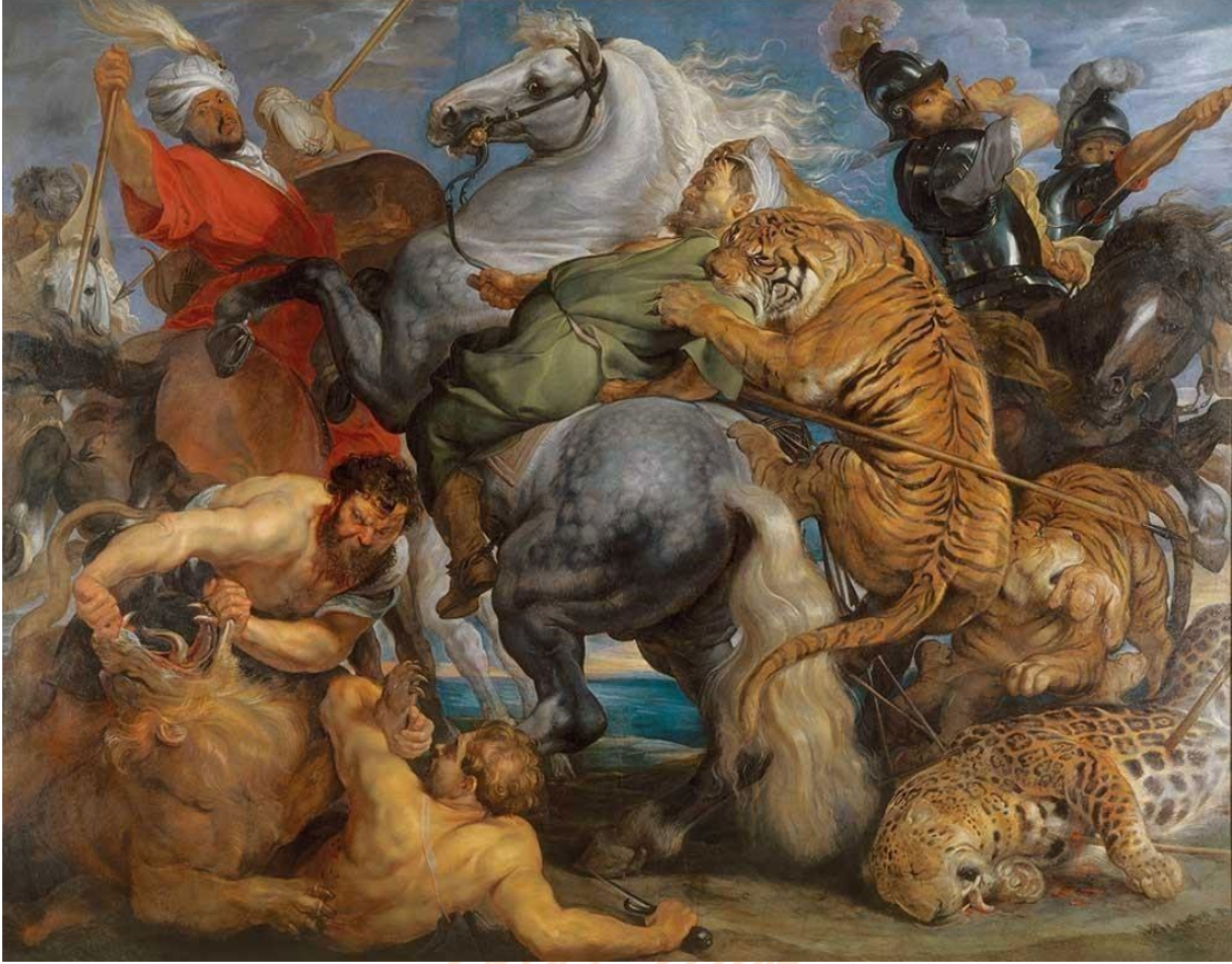
(Resim 3: Peter Paul Rubens, "Kaplan ve Aslan Avı", 253x319 cm, Tuval üzerine yağlıboya, 1618, Musee des Beaux Arts de Rennes.)

Figürlerin iç içe geçişi ile elde edilen ritim ve kullanılan renkler, Barok döneminin üslubuna hizmet etmektedir. İnsanın gücü elinde tutan tarafta olduğunun iddiası ise artık bir iddia olmanın ötesine geçmektedir.