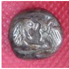
Res.1 Env: 3808 Ön Yüz

Lidya Kralı Kroisos'un (karun) krallığı dönemi elektron sikke