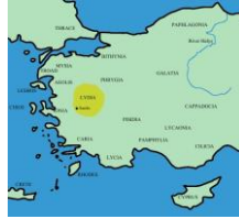
Şekil 2- Lydia bölgesi

Sikke geleneği, M. Ö. VII. asırda Anadolu'da Lidyalılar tarafından icat edilmiştir. Bu tabii elektronu ilk defa altın ve gümüşe ayırarak sikke kestiren Krezüs (Kroisos)'dür 19 .