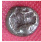
Res.2 Arka Yüz