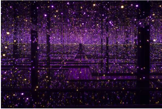
Görsel 3. Yayoi Kusama, Infinity Mirror Rooms (2021)

Claudel'in geleneksel malzemeler olan bronz ve mermeri kullanarak yarattığı eserler, dönemin sanat anlayışını ve estetik değerlerini yansıtır. Dijital teknolojiler, Claudel'in heykellerini koruma, analiz etme ve sergileme süreçlerinde önemli bir rol oynamaktadır (Jucquois-Delpierre, 2021, s. 177).