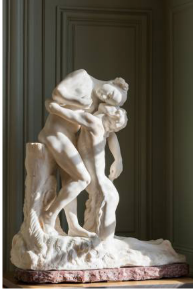
Görsel 6. Camille Claudel, Vertumnus and Pomona (1905)