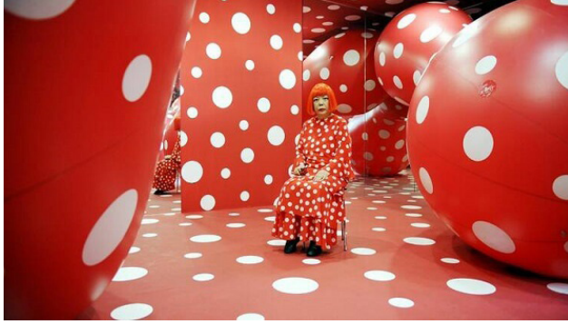
Görsel 1. Yayoi Kusama, You, Me and the Balloons Sergisi (2023)

kılarda bulunmuş, ancak Rodin bazı bölümleri kendi eseri olarak sahiplenmiş ve Camille'in diğer işlerinden bazılarını da kendi adına almıştır (Ayral-Clause, 2019, s. 35). Camille'in hamile kaldığı ve sonrasında bir kaza sonucu bebeğini kaybettiği, bu durumun skandal olarak nitelendirildiği ve ailesi tarafından reddedildiği için evden ayrılmak zorunda kaldığı belirtilmektedir (Rogers, 2007, s. 50). Rodin ile yaşadığı tutkulu ve fırtınalı ilişki, Camille'i duygusal ve maddi olarak tükettiği dönemler yaşatmıştır (Cooper, 2008, s. 25). Annesinin reddi ve Rodin'in ihmalinin birleşimi, Camille'in yaşadığı travmaları artırmış ve sonunda Rodin'den ayrılmasına neden olmuştur (Holzer, 2016, s. 60). Sanatçı bu nedenle bunalıma sürüklenmiştir. Camille Claudel, yaşamının son yıllarını zihinsel hastalıklarla mücadele ederek geçirmiş ve bu süreçte çok az eser üretebilmiştir (Ariot et al., 2023, s. 55). Ancak ürettiği eserler, sanat dünyasında büyük ilgi görmüş ve sanatçının yeteneği, yaşadığı zorluklara rağmen takdir edilmiştir (Pepper, 2012, s. 35).