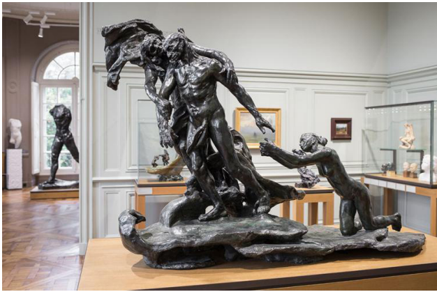
Görsel 2. Camille Claudel, The Age of Maturity, 1893-1900, [S.1380]