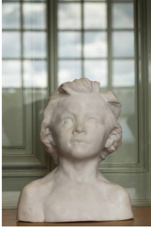
Görsel 8. Camille Claudel, La petite Châtelaine (1892)