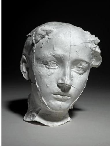
Görsel 4. Camille Claudel, Masque de Camille, vers 1884, plâtre, [S.1742] (1884)