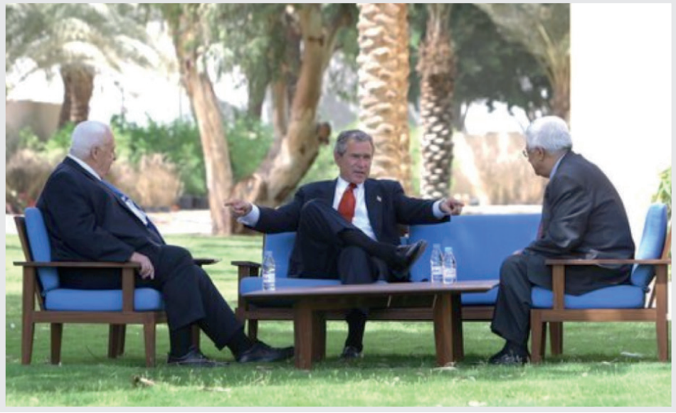
Resim 1: Müzakere Gücü