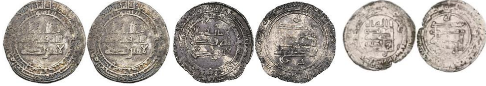
Fig. 4. Antakya darphanesinde Abbasi halifesi; el-Muti- Billâh [Sol: [H 334 (M 945), 5.17 gram, Madinat Antakya, Stephen Album, 1993, No:74); Sağ: H 354 (M 965), 2.24 gram, Madinat Antakiya, NumisBids Arşivi] ve Muktedir Billah adına (H 308 (M 920), 263 gram, Madinat Antakya, Sixbid Numismatic Auctions Arşivi) basılan dirhem örnekleri.

(28 mm, 3.48 gram) ve Halife Muti billah dönemine H 339 / M 950 tarihlenen sikkeler (Porter 1921, 322), Abbasiler döneminde 8. yüzyıl ile 10. yüzyıl arasında Antakya'da faaliyet gösteren İslam darphanesinin varlığını desteklemektedir. Bu darphanede ayrıca Abbasi yönetimi süresince dirhemler de basılmıştır (Hizmetli 2010, 88; Miles 1951, 56-106) (Fig. 4,5).