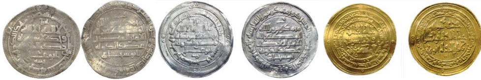
Fig. 3. Hatay Arkeoloji Müzesi koleksiyonunda satın alma Büveyhi dönemi dirhem; https://www.numisbids.com/n.php?p=lot&sid=4642&lot=323 İstanbul Arkeoloji Müzesi'nde Büveyhi emirleri İmadüddevle ve Rüküddevle adına basılan dirhem ve dinar örneği (H 335/M 947) Erişim: https://islamansiklopedisi.org.tr/buveyhiler Erişim Tarihi: 26.04.2024.