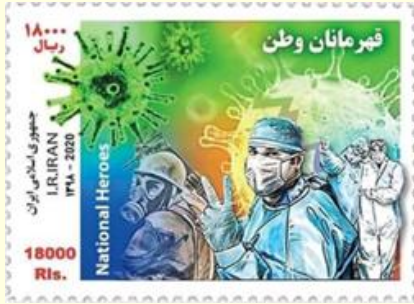
Pul 1. İran, 2020

Fas'ta 7 Mayıs 2020 tarihinde basılan posta pulunun üzerinde "Le Maroc uni contre le COVID-19" mesajı yer almaktadır ( Tablo 1 ). "Fas COVID-19'a karşı birlikte" sloganıyla salgına karşı dünya ile birlik ve dayanışma içinde olduğu vurgulanmıştır. Pulun piyasa değeri 3.75 + 5.00 Fas Dirhemi olarak belirlenmiş olup tutarın 5 Fas Dirheminin COVID-19 ile mücadele fonuna aktarılması planlanmıştır. Hatıra pullarında koronavirüs ile mücadelede ön saflarda yer alan çeşitli meslek grupları resmedilmiştir ( Pul 2 ).