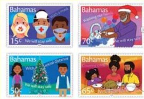
Pul 18. Bahamalar

Bahamalar'da 3 Aralık 2020'de Bahama Posta Servisi tarafından "Yılbaşı ve COVID-19" teması kullanılarak COVID-19 korunma yollarına dikkat çekilmiştir ( Pul 18 ). Dört puldan oluşan seride farklı korunma yollarına dikkat çeken pullar görselleştirilmiştir. Her pul bir korunma yolunu ön plana çıkarmış ve temalar "Maske ile Güvende Kalacağız", "Sosyal Mesafe ile Güvende Kalacağız", "Öksürürken ve Hapşırırken Ağızımızı ve Burnumuzu Kapatarak Güvende Kalacağız" ve "Ellerimizi Yıkayarak Güvende Kalacağız" olarak belirlenmiştir. Pullar için belirlenmiş olan satış bedeli sırasıyla 15 Bahama senti, 50 Bahama senti, 65 Bahama senti ve 70 Bahama sentidir. Yayınlanan pul serisinde maske, mesafe, hijyen kurallarının yanı sıra "evde kal" mesajına da yer verilmiştir ( Pul 18 ). Benzer şekilde Yunanistan'da 15 Haziran 2020'de ayında piyasaya sunulan dört puldan oluşan seride de "evde kal" mesajı yer almaktadır. Serinin her bir pulu 1 avro değerindedir. Pul aracılığıyla pandemi döneminde aktif rol alan tüm çalışanlara teşekkür edilmiştir. Pulların üzerinde yer alan "Teşekkürler; Evde Kaldık ve Kazandık" ifadesi salgınla mücadelede evde kalmanın koruyucu bir önlem olduğunu göstermektedir ( Pul 19 ).