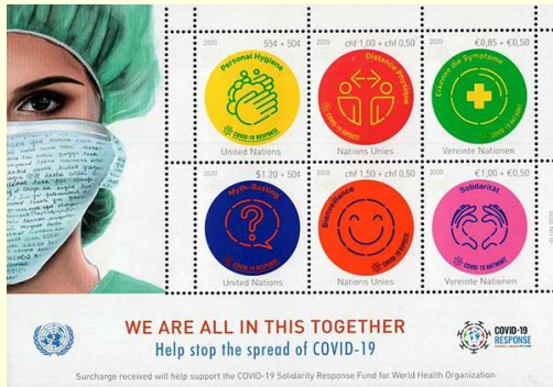
Pul 32. Birleşmiş Milletler, 2020

Birleşmiş Milletler Posta İdaresi Dünya Sağlık Örgütü tarafından düzenlenen "COVID Dayanışma Müdahale Fonu"nu desteklemek için bir pul serisi yayınlamıştır. Posta idaresinin 11 Ağustos 2020'de yayınladığı 150 x 105 mm ölçülerindeki altı puldan oluşan koleksiyonda topluma "Bu işte hepimiz beraberiz" mesajı verilmiş ve koronavirüse karşı birlikte mücadele ve dayanışmanın önemine vurgu yapılmıştır ( Pul 32 ). Rorie Katz'ın tasarladığı altı puldan oluşan serinin 128,000 adet baskısı yapılmıştır. Bu seri ile dünyaya "Birlikte hayat kurtarabilir, kaynakları koruyabilir ve birbirimize önem verebiliriz" mesajı verilmiştir. "Kişisel Hijyen", "Efsane Avcısı", "Fiziksel Mesafe", "İyiliği Yayımak", "Belirtileri Bilin", "Dayanışma" temaları pulların konuları arasındadır ( Pul 32 ).