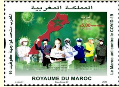
Pul 2. Fas, 2020

Çin Halk Cumhuriyeti 11 Mayıs 2020'de "Ön Cephe Savaşçıları" isimli özel bir pul serisi piyasaya sürmüştür ( Tablo 1 ). Bir çift posta pulu 1,20 Çin Yuanı bedel ile satışa sunulmuştur. Wang Huming, Liu Xiangping tarafından tasarlanan pul serisi, COVID-19'a karşı savaşanların onuruna ve bu virüse yenik düşenlerin anısına basılmıştır. "Ön Cephe Savaşçıları" pullarının üzerinde bir tarafta koruyucu giysiler içindeki bir sağlık görevlisi; diğer tarafta sağlık çalışanları, askerler ve polislerden oluşan bir pandemi mücadele birimi resmedilmiştir. Bu pullar bir yanda askerler, gönüllüler ve araştırmacılar; diğer yanda sağlık dünyası olmak üzere toplumun bireyleri arasındaki iş birliği vurgulanmıştır ( Pul 3 ).