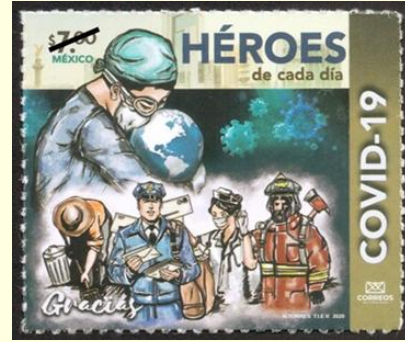
Pul 8. Meksika, 2020

Vietnam, COVID-19 mücadelesindeki dayanışmayı göstermek için 31 Mart 2020 tarihinde "COVID-19'un önlenmesi ve kontrolünde el ele verin" teması ile iki puldan oluşan bir seri çıkardığını açıklamıştır ( Tablo 1 ). Vietnamlı ressam Pham Trung Ha tarafından tasarlanan pullar, Vietnam Pul Şirketi ile Sağlık Bakanlığı iş birliğiyle hazırlanmıştır ve piyasaya sürülmüştür ( Pul 9 ). COVID-19'a karşı birlikte mücadele etmek toplumun dayanıklılığını artıran önemli bir unsurdur. İlk pulda insanların sağlığını ve ülkenin huzurunu korumak için gece gündüz kalkan gibi çalışan sağlık sektörü, ordu ve polis güçlerinden temsilciler görselleştirilerek onurlandırılmıştır. Bu pulun ölçüleri 31 x 46 mm iken 4.000 Vietnam Dongu değerinde satışa sunulmuştur. İkinci pul, COVID-19 için en etkili tedavi rejimini geliştirmek ve hastalığa karşı bir aşı üretmek üzere araştırma yapan Vietnamlı bilim insanlarını simgelerken, satışa 15.000 Vietnam Dongu değerinde sunulmuştur ( Pul 9 ).