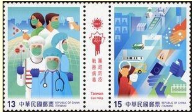
Pul 21. Tayvan, 2020

Farklı ülkelerden COVID-19 ile mücadelede aşının önemine vurgu yapılan pul örneklerine rastlanmaktadır. Dominik Cumhuriyeti'nde ve Antigua ve Barbuda'da 5 Doğu Karayip dolarından piyasaya sunulan, tüm dünyadaki sağlık çalışanlarına atfedilen pullarda COVID-19 aşısı görseli yer almaktadır. Sağlık çalışanları şükranla anılmış aşının önemine dikkat çekilmiştir ( Pul 22-23 ). 12 Haziran 2020'de Cibuti'de COVID-19'a dikkat çekmek için üç puldan oluşan 300 Cibuti Frangı değerinde bir pul serisi satışa sunulmuştur. Pullardan birinde aşı çalışmalarına dikkat çeken bir görsele yer verilmiştir ( Pul 24 ). Çad Cumhuriyeti 30 Kasım 2020 tarihinde 9x365 Orta Afrika CFA Frangı değerinde bir seri yayınlamıştır. Çad Posta İdaresi tarafından onaylanan seri dokuz puldan oluşmaktadır. Pullarda hapşırırken ağzı kapatma, karantina, el yıkama, maske takma gibi korunma yöntemlerine yer verilmiştir. Ayrıca bir pulda virüs görseli ile aşı çalışmaları resmedilmiştir ( Pul 25 ).