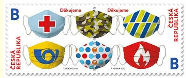
Pul 13. Çekya, 2020

Tayland'da 14 Ağustos 2020'de piyasaya sunulan pulun tasarımcısı Udorn Niyomthum'dur. Görselinde maske, siperlik, önlük gibi koruyucu ekipmanlar resmedilmiştir. Ayrıca bir hastanede muayene sırası bekleyenlerin sosyal mesafeye uymaları konusundaki tedbirler de görselleştirilmiştir. Üzerinde "COVID-19'a Karşı Birlikte Mücadele Ediyoruz" mesajı yer almaktadır. Pulun ölçüleri 48 x 30 mm iken, satış bedeli 3,00 Baht olarak belirlenmiştir ( Pul 14 ).