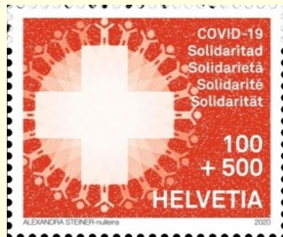
Pul 29. İsviçre, 2020

Cibuti'de yayınlanan üç serilik pullardan birinde dünyanın etrafını farklı saç renkleri ve cinsiyetlerde insanların çevrelediği birlik mesajına vurgu yapan görsele yer verilmiştir ( Pul 24 ). İsviçre, 6 Nisan 2020'da sadece internet üzerinden temin edilebilen ve satış bedelinin bir kısmının yardıma ihtiyacı olan insanlara aktarılacağı "COVID-19 Dayanışma" posta pulunu çıkarmıştır. Pulun tasarımını Alexandra Steiner yaparken, 33 x 28 mm ebatlarındaki pulda COVID-19 virüsünden etkilenenlerle dayanışma çağrısı dört dilde ifade edilmiştir ( Pul 29 ). Tuvalu'da basılan bir pulda da zorlu pandemi döneminde "umut" kavramına dikkat çekilmiştir ( Pul 16 ).