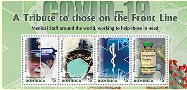
Pul 22. Dominik Cumhuriyeti, 2020

Farklı ülkelerden COVID-19 ile mücadelede aşının önemine vurgu yapılan pul örneklerine rastlanmaktadır. Dominik Cumhuriyeti'nde ve Antigua ve Barbuda'da 5 Doğu Karayip dolarından piyasaya sunulan, tüm dünyadaki sağlık çalışanlarına atfedilen pullarda COVID-19 aşısı görseli yer almaktadır. Sağlık çalışanları şükranla anılmış aşının önemine dikkat çekilmiştir ( Pul 22-23 ). 12 Haziran 2020'de Cibuti'de COVID-19'a dikkat çekmek için üç puldan oluşan 300 Cibuti Frangı değerinde bir pul serisi satışa sunulmuştur. Pullardan birinde aşı çalışmalarına dikkat çeken bir görsele yer verilmiştir ( Pul 24 ). Çad Cumhuriyeti 30 Kasım 2020 tarihinde 9x365 Orta Afrika CFA Frangı değerinde bir seri yayınlamıştır. Çad Posta İdaresi tarafından onaylanan seri dokuz puldan oluşmaktadır. Pullarda hapşırırken ağzı kapatma, karantina, el yıkama, maske takma gibi korunma yöntemlerine yer verilmiştir. Ayrıca bir pulda virüs görseli ile aşı çalışmaları resmedilmiştir ( Pul 25 ).