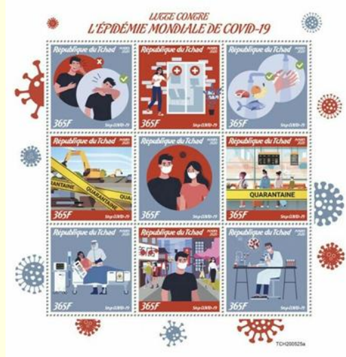
Pul 25. Çad Cumhuriyeti, 2020