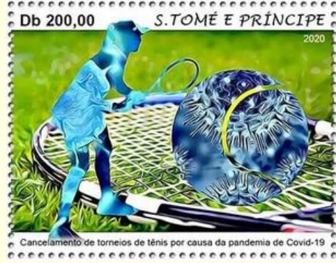
Pul 35. Sao Tome Principe, 2020