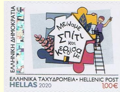
Pul 19. Yunanistan, 2020

Singapur'da öğrencilere yönelik kendilerini ve arkadaşlarını güvende ve sağlıklı tutmaları konusunda rehberlik edecek genç süper kahramanlardan oluşan bir pul serisi yayınlamıştır. El yıkama, maske takma, yüzüne dokunmama, yüzeyleri silme ve hastalandığında doktora gitme gibi öğrencilerin kolaylıkla anlayabileceği ve benimseyebileceği davranışları vurgulamaktadır. Ölçüleri 40.8 mm x 29.85 mm olan pulların satış bedeli 3 dolardır. COVID-19 ile mücadelede çocukların da önemli rollerinin olduğunu simgeleyen pul seti, öğrencilerin güvenliğini ve öğrenimini sağlamak için ellerinden geleni yapan tüm öğretmenleri onurlandırmaktadır ( Pul 20 ). Toplumun her bireyini mücadeleye davet eden bir diğer örnek ise