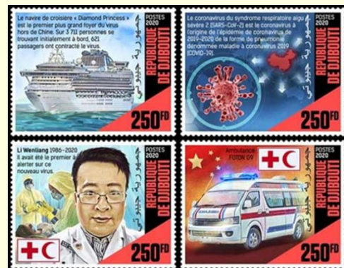
Pul 10. Cibuti, 2020

Amerika Birleşik Devletleri (ABD) Beyaz Saray Sağlık Danışmanı ve bulaşıcı hastalıklar uzmanı Dr. Anthony Fauci COVID-19 dönemi sembolü haline gelmiş bir isimdir. Doktor Fauci'ye 2019 koronavirüs salgını sırasında gösterdiği yorulmak bilmez ve benzersiz liderliği için teşekkür niteliğinde bir pul serisi