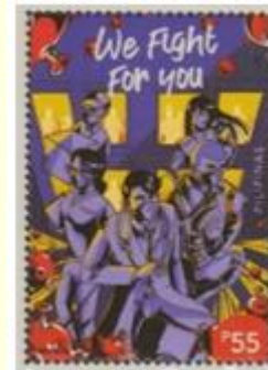
Pul 6. Filipinler, 2020

Portekiz Posta İdaresi 9 Ekim 2020'de basılan pulda COVID-19 temasına yer vermiştir (Tablo 1). Portekiz'de 0.53-1 Avro değerinde değişen pulların üzerinde hem Portekiz Posta İdaresi'nin 500.yılıni kutlayan hem de koronavirüs salgınında ön cephede görev alan postacıları onurlandıran görsellere yer verilmiştir. Portekiz Posta İdaresi'nin piyasaya sürmüş olduğu 500. yıla özel pulunun üzerinde posta çalışanları maske ve koruyucu siperliklerle çalışırken, hizmet sunarken, dağıtım, nakliye ve işleme yaparken resmedilmiştir (Pul 7).