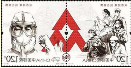
Pul 3. Çin Halk Cumhuriyeti, 2020