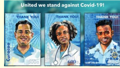
Pul 4. Kurasao, 2020

Umman 22 Haziran 2020'de COVID-19 pandemisi sırasında ülkenin ön saflardaki çalışanlarını onurlandıran bir pul bastırmıştır (Tablo 1). Üzerinde "Umman Korona ile Karşı Karşıya" mesajının yer aldığı, salgınla mücadele için harekete geçilmesi çağrısında bulunan iki posta pulundan oluşan hatıra kağıdının satış bedeli 500 Umman Riyali olarak belirlenmiştir. Umman Posta servisi, posta pullarının satışından elde edilen gelirin %40'ının virüsü kontrol etme ve hastaları tedavi etme konusundaki ulusal çabaları desteklemek için vakıf fonu aracılığıyla kullanılacağını bildirmiştir (Pul 5).