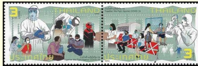
Pul 14. Tayland, 2020

Tayland'da 14 Ağustos 2020'de piyasaya sunulan pulun tasarımcısı Udorn Niyomthum'dur. Görselinde maske, siperlik, önlük gibi koruyucu ekipmanlar resmedilmiştir. Ayrıca bir hastanede muayene sırası bekleyenlerin sosyal mesafeye uymaları konusundaki tedbirler de görselleştirilmiştir. Üzerinde "COVID-19'a Karşı Birlikte Mücadele Ediyoruz" mesajı yer almaktadır. Pulun ölçüleri 48 x 30 mm iken, satış bedeli 3,00 Baht olarak belirlenmiştir ( Pul 14 ).