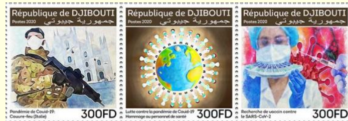
Pul 24. Cibuti, 2020