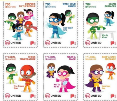
Pul 20. Singapur, 2020

Tayvan'da piyasaya sürülen puldur. COVID-19'un yayılmasını sınırlamaya yönelik temel koruyucu önlemlere dikkat çekilen pulda "Tayvan Yardımcı Olabilir" mesajı bulunmaktadır. Ebatları 70 x 40 mm olan pulun bedeli 28 Yeni Tayvan dolarıdır ( Pul 21 ).