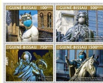
Pul 27. Gine Bissau, 2020