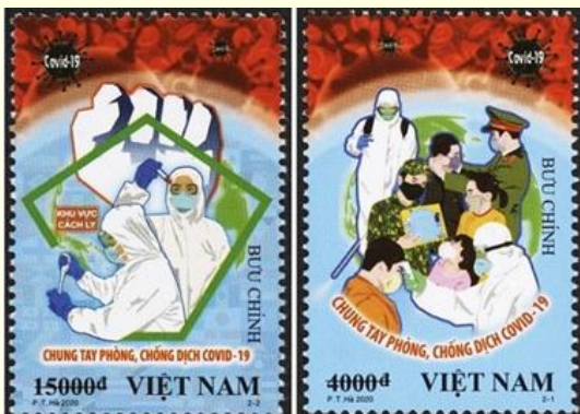
Pul 9. Vietnam, 2020

Cibuti'de, COVID-19'a karşı mücadeleyi öne çıkarmak ve Doktor Li Wenliang'a saygıyla anmak için Mayıs 2020'de bir posta pulu serisi yayınlanmıştır ( Tablo 1 ). Doktor Li Wenliang Wuhan Merkez Hastanesi'nde çalışan ve 2019 yılının Aralık ayında koronavirüs salgınına tespit edip, sosyal medya üzerinden tüm dünyaya acil durum uyarısında bulunan Çinli göz doktorudur. Doktor Li Wenliang COVID-19'a yakalanmış ve 7 Şubat 2020'de henüz 34 yaşında vefat etmiştir. Bu seri, COVID-19 pandemisinin çeşitli yönlerini tasvir eden dört posta pulundan oluşmaktadır. Her biri 250 Cibuti Frangı değerinde olan bu pullarda; Diamond Princess lüks gemisi, koronavirüs temsili, Doktor Li Wenliang ve FOTON G9 özel ambulansının görüntüleri bulunmaktadır. Ayrıca Cibuti, Doktor Li Wenliang'ın portresini içeren tek puldan oluşan bir pul sayfasını da 1000 Cibuti Frangı değerinde yayınlamıştır. Yayımlanan pul serisi pandeminin küresel etkisini vurgulamayı amaçlamıştır ( Pul 10 ).