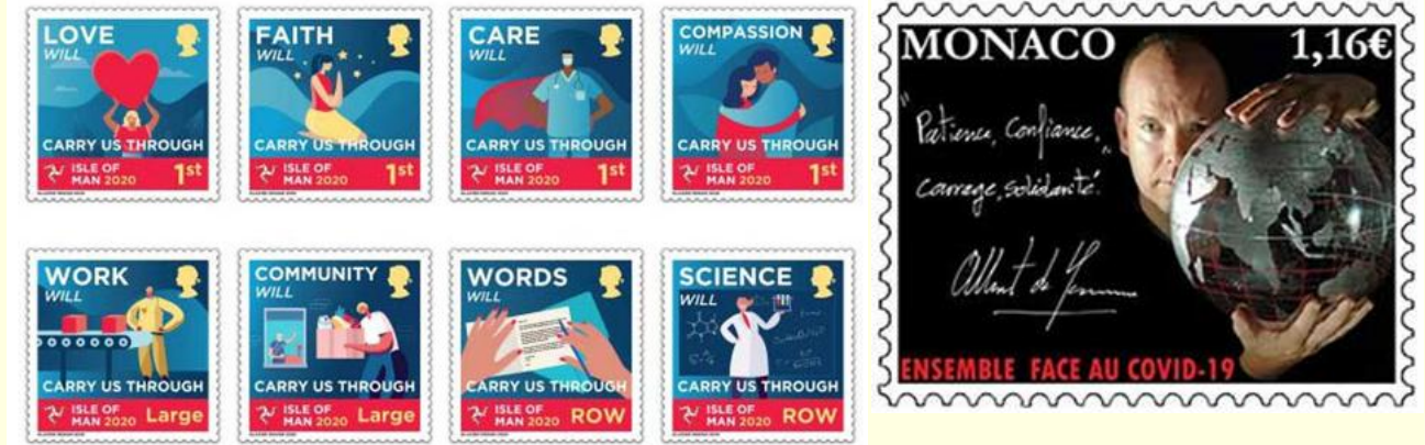
Pul 30. Man Adası, 2020

mücadelede birlik ve dayanışmayı vurgulamak için piyasaya sürülmüştür ( Pul 31 ). Tasarımı Guillaume Barclay'a ait olan 41 x 30 mm ebatlarındaki pul, 1,16 Avro değerinde satışa sunulmuştur. Anma pulunda Prens Albert II elleriyle şeffaf bir küreyi tutarken görünmektedir. Prens'in kendi el yazısıyla "Sabır", "Güven", "Cesaret", "Dayanışma" mesajları ve imzası yer almaktadır ( Pul 31 ).