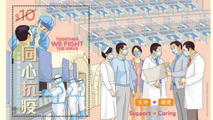
Pul 17. Hong Kong, 2020

Bahamalar'da 3 Aralık 2020'de Bahama Posta Servisi tarafından "Yılbaşı ve COVID-19" teması kullanılarak COVID-19 korunma yollarına dikkat çekilmiştir ( Pul 18 ). Dört puldan oluşan seride farklı korunma yollarına dikkat çeken pullar görselleştirilmiştir. Her pul bir korunma yolunu ön plana çıkarmış ve temalar "Maske ile Güvende Kalacağız", "Sosyal Mesafe ile Güvende Kalacağız", "Öksürürken ve Hapşırırken Ağızımızı ve Burnumuzu Kapatarak Güvende Kalacağız" ve "Ellerimizi Yıkayarak Güvende Kalacağız" olarak belirlenmiştir. Pullar için belirlenmiş olan satış bedeli sırasıyla 15 Bahama senti, 50 Bahama senti, 65 Bahama senti ve 70 Bahama sentidir. Yayınlanan pul serisinde maske, mesafe, hijyen kurallarının yanı sıra "evde kal" mesajına da yer verilmiştir ( Pul 18 ). Benzer şekilde Yunanistan'da 15 Haziran 2020'de ayında piyasaya sunulan dört puldan oluşan seride de "evde kal" mesajı yer almaktadır. Serinin her bir pulu 1 avro değerindedir. Pul aracılığıyla pandemi döneminde aktif rol alan tüm çalışanlara teşekkür edilmiştir. Pulların üzerinde yer alan "Teşekkürler; Evde Kaldık ve Kazandık" ifadesi salgınla mücadelede evde kalmanın koruyucu bir önlem olduğunu göstermektedir ( Pul 19 ).