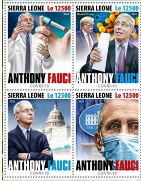
Pul 11. Sierra Leone, 2020

yayınlanmıştır ( Pul 11 ) ( Tablo 1 ). Sierra Leon'un 12 Haziran 2020'de yayınladığı bu pul serisi Anthony Fauci ve COVID-19 temalı dört puldan oluşmaktadır. Her pulun birim değeri 12500 Sierra Leon Leonesi olarak belirlenmiş olup hatıra sayfası 50000 Sierra Leon Leonesi'nden satışa sunulmuştur. Virüsten korunmada maskenin önemine dikkat çeken bir pulun yanı sıra, bir başka pulda Dr. Fauci'nin elinde aşı çalışmaları için bir numune tüpünün bulunduğu görsel bulunmaktadır. Her pulun üzerinde "Anthony Fauci" ve COVID-19 yazılıdır ( Pul 11 ).