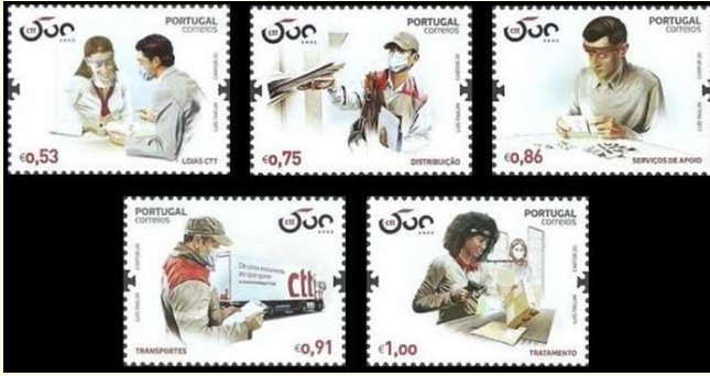
Pul 7. Portekiz, 2020