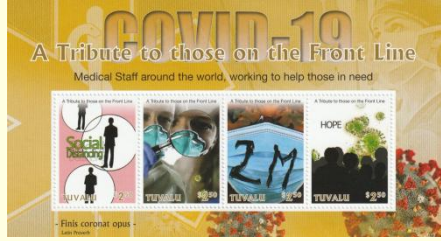
Pul 16. Tuvalu, 2020