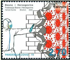
Pul 12. Bosna Hersek, 2020

Bosna Hersek'te Haziran 2020'de piyasaya sunulan 2.70 Bosna Hersek Markı değerindeki posta pulunda, COVID-19 virüs görseline karşı sembolik bir duvar oluşturan üzerinde koruyucu ekipmanlar olan bir insan figürüne yer verilmiştir. Pulun üzerinde "COVID-19 Pandemisi" yazmakta olup, 10,000 adet baskı yapılmıştır. Pul COVID-19 pandemisinde korunma önlemlerinin önemine dikkat çekmektedir ( Pul 12 ). Benzer şekilde, Çekya'da "COVID-19 İlk Müdahale Ekiplerine Takdir" temasıyla basılan pul serisinde iki pul bulunmaktadır. Pul serisini Filip Heyduk tasarlamış olup, seride altı farklı maske illüstrasyonuna yer verilerek maske kullanımının önemine dikkat çekilmiştir. Maskelerin üzerinde sağlık çalışanlarını, itfaiyecileri, ordu ve polis mensuplarını, postacıları işaret eden semboller bulunmaktadır. Ölçüleri 60 x 23 mm olan pulların üzerinde COVID-19 salgınında ön cephede çalışanlara duyulan minnet "Teşekkürler" yazısıyla ifade edilmiştir ( Pul 13 ).