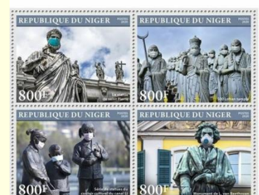
Pul 28. Nijer Cumhuriyeti, 2020

Cibuti'de yayınlanan üç serilik pullardan birinde dünyanın etrafını farklı saç renkleri ve cinsiyetlerde insanların çevrelediği birlik mesajına vurgu yapan görsele yer verilmiştir ( Pul 24 ). İsviçre, 6 Nisan 2020'da sadece internet üzerinden temin edilebilen ve satış bedelinin bir kısmının yardıma ihtiyacı olan insanlara aktarılacağı "COVID-19 Dayanışma" posta pulunu çıkarmıştır. Pulun tasarımını Alexandra Steiner yaparken, 33 x 28 mm ebatlarındaki pulda COVID-19 virüsünden etkilenenlerle dayanışma çağrısı dört dilde ifade edilmiştir ( Pul 29 ). Tuvalu'da basılan bir pulda da zorlu pandemi döneminde "umut" kavramına dikkat çekilmiştir ( Pul 16 ).