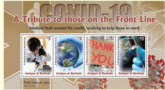
Pul 23. Antigua ve Barbuda, 2020