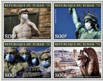
Pul 26. Çad Cumhuriyeti, 2020

Çad Cumhuriyeti'nde, Gine Bissau'da ve Nijer Cumhuriyeti'nde piyasaya sunulan pul koleksiyonlarında dünyaya mal olmuş ortak miras niteliğindeki heykel ve anıtların maskeli görselleri illüstre edilmiştir. Maske kullanımına dikkat çekilmiştir ( Pul 26-28 ). Çad Cumhuriyeti pullarında Michelangelo'nun David heykeli, Özgürlük Anıtı (Amerika Birleşik Devletleri), Rushmore Dağı, Le Stryge (Notre Dome de Paris) maskeli resmedilmiştir ( Pul 26 ). Gine Bissau pullarında Johann Sebastian Bach Heykeli (Leipzig), Neptün Çeşmesi (Floransa), Nicolaus Copernicus Anıtı (Torun), İspanya Kralı Carlos IV'ün Heykeli (Meksika) ( Pul 27 ). Nijer Cumhuriyeti'nin pulunda ise 250. Yaş günü olan Ludwig van Beethoven maskesi ile dikkat çekmektedir ( Pul 28 ).