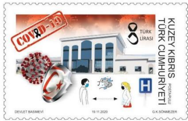
Pul 15. Kuzey Kıbrıs Türk Cumhuriyeti, 2020

Hong Kong "Salgınla birlikte mücadele edelim" temalı özel pullarını 29 Aralık 2020'de piyasaya sürmüştür. Ölçüleri 150 x 90 mm olan pullar, 15 Hong Kong doları bedelle satışa sunulmuştur. Pulların görselinde COVID-19 tarama testi ve dezenfeksiyonun önemine dikkat çekilmektedir. Profesyonel ve özverili sağlık çalışanları, virüsü aktif olarak araştıran bilimsel araştırmacılar, ön saflarda çalışan üniformalı çalışanlar, maske ve posta malzemeleri gibi salgın karşıtı malzemeleri durmadan teslim eden postacılar ve dezenfeksiyon personeli dahil olmak üzere Hong Kong halkının yanında savaşan bir grup kahraman pullarda tasvir edilmiştir ( Pul 17 ).