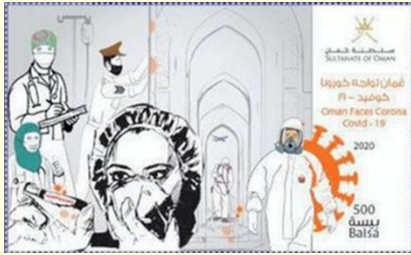
Pul 5. Umman, 2020

Filipinler Posta Şirketi (PHLPost) de 13 Temmuz 2020 itibariyle COVID-19 temasını işleyen posta pullarını satışa sürmüştür (Tablo 1). Ölçüleri 30 x 50 mm olan posta pulları 55 Filipin Pesosu değerinde satışa sürülmüştür. Pulun görselinde salgının ön cepesinde yorulmak bilmeyen çabalarla mücadele eden doktorlar, hemşireler, teknisyenler, askerler, polisler, kuryeler ve toplumda hizmet sunan bireyler yer almıştır. Filipin Posta Şirketi çıkardığı posta pulları aracılığıyla COVID-19 mücadelesinin ön cephelerinde çalışan bireylerini onurlandırmıştır. Pulun üzerinde yer alan "Sizin için mücadele ediyoruz" mesajı toplumsal dayanışma ve birliği güçlendirmeye bir davettir (Pul 6).