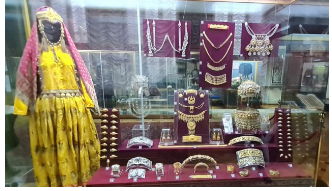
Fotoğraf 11: Takı sergilemelerinden bir görünüm.

Bugün, müzenin bilimsel araştırma çalışmaları, yayınlanmış eserler, düzenlenen sergiler ve konferanslar, Ulusal Azerbaycan Tarihi Müzesi'nin bilimsel ve kültürel alandaki önemini bir kez daha vurgulamaktadır. Müze, Azerbaycan vatandaşlarının gurur duyduğu, görkemli tarihi geçmişi ile milletin maddi, kültürel ve tarihi mirasının koleksiyoncusu ve koruyucusu olarak önemli bir rol oynamaktadır (Kh.Firuzlu, kişisel mülakat, 2019). Bu çalışma, müzenin tarihsel gelişimini, mimari