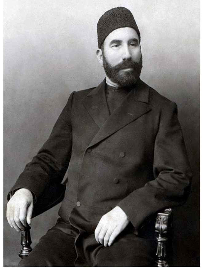
Fotoğraf 2: Hacı Zeynalabdin Tağıyev azhiistorymuseum.gov.az/az/history

Bakü'de Rusya İmparatorluğu'ndaki 28 tekstil fabrikasından birini kurarak Bakü-Batum petrol hattına önemli finansal katkılarda bulunmuştur. Tağıyev, Türkiye'ye de yardımlar yapmış; Edirne'ye göç edenlere bağışlar göndermiş ve İstanbul