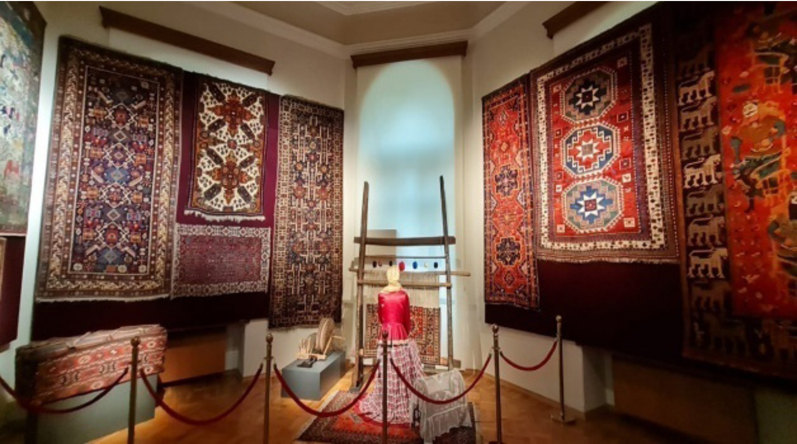
Fotoğraf 12: Halı sergilemelerinden bir görünüm. azhi.storymuseum.gov.az/az/history

Tağıyev Sarayı, sadece geçmişin bir yansıması değil, aynı zamanda gelecek nesillere aktarılacak bir mirastır. Müze, gelecek yıllarda da Azerbaycan'ın kültürel zenginliğini korumak ve tanıtmak için çalışmalarını sürdürecektir. Bu, sarayın sadece bir yapı değil, aynı zamanda Azerbaycan'ın tarihî ve kültürel kimliğinin bir sembolü olduğu anlamına gelmektedir.