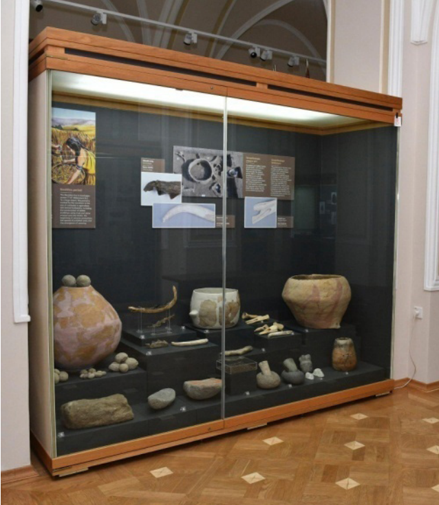
Fotoğraf 7 ve 8: Vitrin içi sergilemeler azhistorymuseum.gov.az/az/history