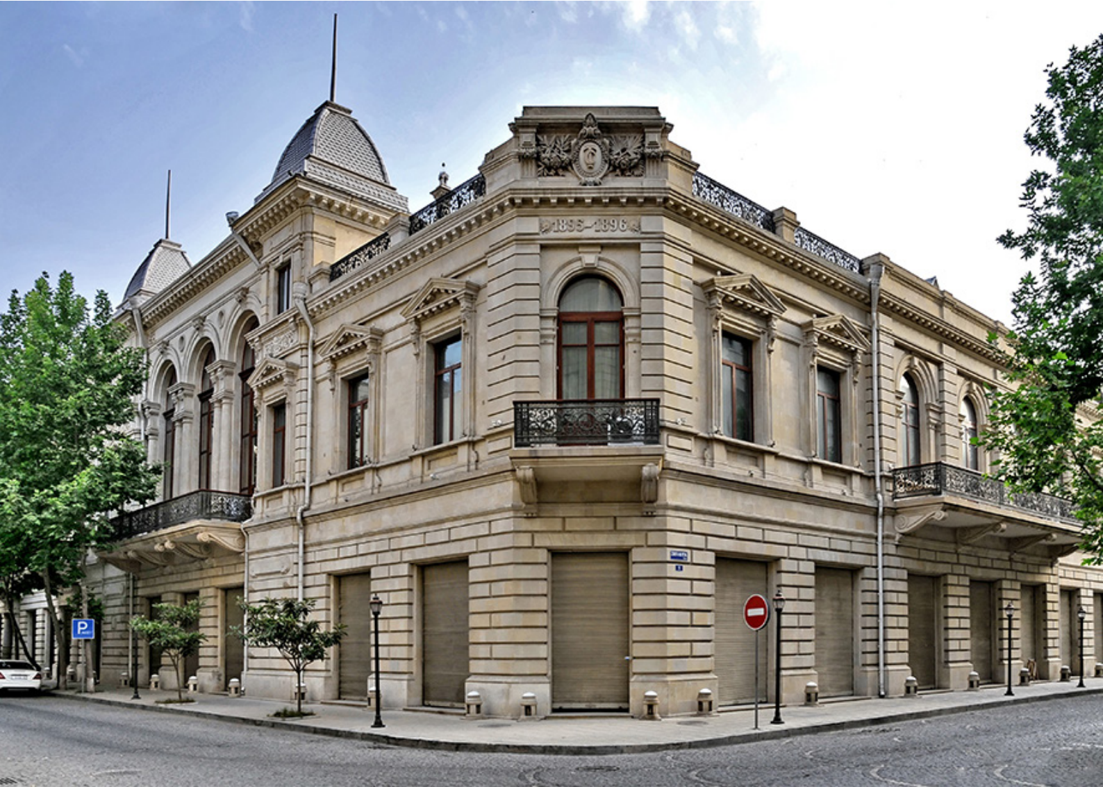
Fotoğraf 1: Müzenin dış cephesi. azhistorymuseum.gov.az/az/history

Bu çalışma, Azerbaycan için önemli bir kurum olan Ulusal Azerbaycan Tarihi Müzesi'nin kuruluşunu ve bu müzenin bulunduğu binanın sahibi olan ünlü iş adamı ve hayırsever Hacı Zeynalabdin Tağıyev'in hayatını kapsamlı bir şekilde ortaya koymuştur.