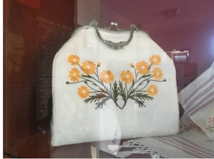
Resim 1. Atölyede dokunmuş Pelemet bezi üzerine nakış işlenmiş bir çanta örneği (Şavkar, 2019).

Günümüzde üretilen yöre bezleri yöresel nakışlarla süslenerek hediyelik eşya ve yelek, bluz, çanta yapımında kullanılmaktadır. Çaycuma'da günümüzde üretim yalnızca Halk Eğitim Merkezleri bünyesinde açılan dokuma kurslarıyla devam etmektedir.