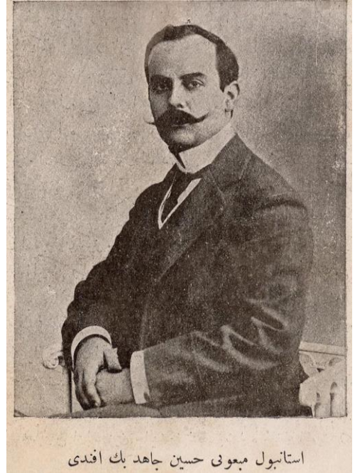
Hüseyin Cahit Yalçın

Sonradan Tevfik Fikret'in dergiden ayrılmasının ardından, Servet-i Fünun dergisinin yönetimini devralacak olan Hüseyin Cahit (Yalçın) de Servet-i Fünun dergisinin 437 numaralı sayısında, "Harp ve Sulh" başlıklı bir yazı kaleme alır. Yazısına, "Harbin kaldırılması bir hülya mıdır?" sorusuyla başlayan Hüseyin Cahit, yazı boyunca bu sorunun cevabını arar ve kendince bir çözüm yolu bulmaya çalışır. Birçok kişinin harbin ortadan kaldırılmasının hayalden ibaret olduğunu düşündüğünü ifade eder. Ancak yapılabildiğini örnekler vererek açıklar. Bu sebeple harbin kaldırılmasının bir hayal olduğunu söylemek Hüseyin Cahit'e göre yanlış bir fikirdir. Öncelikle tüm devletlerin harbin kaldırılması için ortak bir kanaat de olmaları gerekmektedir. Daha sonra bir tür mahkeme kurulmalı ve her devletten birer ikişer üye seçilmelidir. Böylece devletler arasındaki problemlerin savaşılmadan çözüme kavuşturulacağı öngörülür. Ancak Hüseyin Cahit, yazının sonunda kişilerin zihninde yerleşmiş bulunan sabit fikirlerden dolayı böyle bir mahkemenin şimdilik vücuda gelmesinin mümkün olmayacağını belirtir (Hüseyin Cahit, 1899, s. 330-332). Derginin 483 numaralı sayısında ise aynı başlık ile bir yazı daha yayımlar. Bir önceki sayıda bahsettiği mahkeme hakkında maddeler hâlinde izahatta bulunur. Mahkemenin kurulmasının bir hayalden ibaret olmadığını ispat etmek için birtakım devletlerarasında yaşanan anlaşmazlıklar neticesinde İngiltere, Rusya ve Fransa gibi