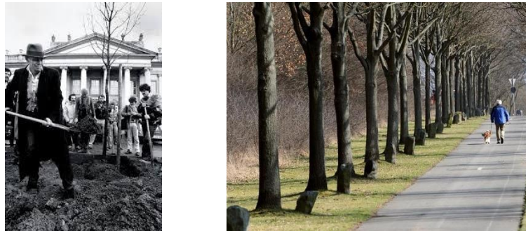
Şekil 5. Joseph Beuys. 7000 Meşe ve Bazalt, Dökümenta 7, Kassel, 1982

Joseph Beuys'un sosyal heykel ve ekolojik sanat anlayışını açık bir şekilde ortaya koyan ve sosyal heykel kavramının örneği olan "7000 Meşe ve Bazalt" (Şekil 5) adlı projesi, 7000 meşe ağacının dikilmesinden oluşmaktadır.