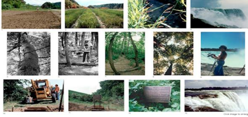
Şekil 10. Agnes Denes, Rice/Tree/Burial, Sullivan County, New York 1968