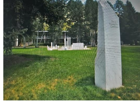
Şekil 3. Herbert Bayer, Mermer Heykel Bahçesi, Aspen Meadows, Colorado,1955