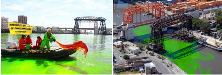
Şekil 9. Nicolás García Uriburu ve Greenpeace, Buenos Aires Riachuelo Nehri, Arjantin,2010

Uriburu, 1990'larda Greenpeace ile iş birliği yapmaya başlamış ve Arjantin'de endüstriyel kirliliğe, nükleer atıklara ve nesli tükenmekte olan türlere karşı protestolar düzenlemiştir. 2010 yılında sanatçı, yine performans sergileyen yeşil tulumuyla Buenos Aires Riachuelo nehrine bir kova Floresein dökerken (Şekil 9) fotoğraflamıştır. Teknenin üzerindeki bayrakta Arjantin'in iki yüzüncü yıl kutlamalarına gönderme yapan ve bu protesto renklendirmesinin amacını açıklayan "Riachuelo: 200 yıllık kirlilik" yazan bir afiştir. García Uriburu ve Greenpeace, bu ulusal dönüm noktasını kutlamak yerine, dikkati bu kentsel nehrin 200 yıllık kirlenme geçmişine bir gönderme de bulunmuştur (Schwaller,2021).