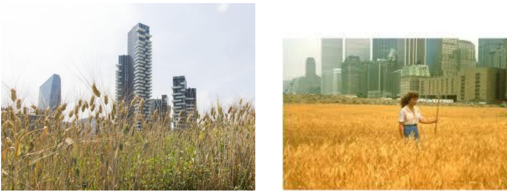
Şekil 11. Agnes Denes, Buğday Tarlası, Manhattan,1982, ( https://ajournal.blog )

New York'ta gerçekleştirdiği "Buğday Tarlası- Bir Karşılaşma" isimli projesiyle Denes, kentsel alanlarda doğal yaşamın teşvik edilmesi ve yeşil alanların korunması için sanatın nasıl kullanılabileceğini göstermiştir. Bu proje, kentsel çevrenin ekolojik dengeye katkı sağlayabileceğini ve insanların çevre bilincini artırabileceğini gösterir. Bu sanatçıların çalışmaları, Ekolojik Sanat hareketinin temelini oluşturan çevre bilinci ve doğal kaynakların korunması konularına dikkat çekmiş ve bu alanda ilham verici örnekler sunmuştur. Bu çalışmalar, sanatın gücünü çevresel sorunlara karşı mücadele etmede kullanılan etkili bir araç olarak göstermiştir.