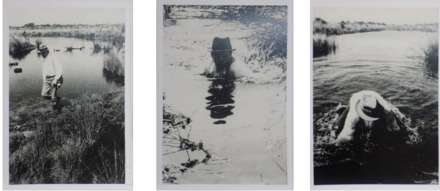
Şekil 4. Joseph Beuys, Bataklık Eylemi (Bok Actions), Zuider Zee, 1971.

konularında sanatın gücünü vurgulamıştır (Barton,2020). Beuys,'un bu tür eylemleri, sadece estetik açıdan değil, aynı zamanda ekolojik ve sosyal konulara karşı duyarlılığı ön plana çıkaran eylemlerdir. Bu nedenle O, sanatın sosyal sorunlara çözüm bulma sürecine dahil olabileceğini ve doğal çevrenin korunması için sanatçıların aktif rol oynaması gerektiğini savunmuştur.