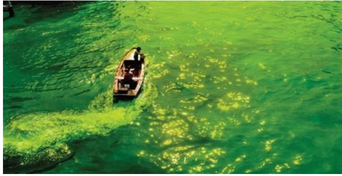
Şekil 6. Nicolás García Urriburu, Coloration of the Grand Canal for the Venice Biennale 1968 ( https://espaceartactuel.com )

Diğer bir önemli sanatçıda Nicolás García Urriburu'dur (1937-2016) 1968' yılında gerçekleştirdiği "Büyük Kanalın Renklendirilmesi" (Şekil 6) performansı ise kirlenmiş bir su yolu olan Büyük Kanal'ı yeşil boyayla kaplayarak çevresel kirliliği ve doğal kaynakların korunmasına dikkat çekmiştir. Bu performans, insanın yaşadığı çevresine karşı yaptığı yıkıcı etkilerini görmesini sağlamak amacıyla yapılmıştır.