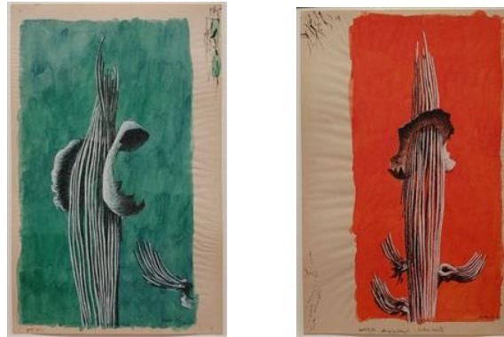
Şekil 1. Herbert Bayer, Natürmort, Peyton Wriht Galerisi 1953

Bayer, modernist imgeleri küreselleşme, koruma değerleri ve ABD'deki çevresel sorunları görselleştiren haritalarla ilişkilendirerek çevre tartışmalarına katkıda bulunmuştur. Bayer'in tasarımları, insan ilişkilerini doğal dünya ile uyumlu hale getirmeyi amaçlayan renkler, imgeler, semboller ve dinamik illüstrasyonlar (Şekil 1) içeren bir görsel dil oluşturmuştur (Anker, 2007: 255).