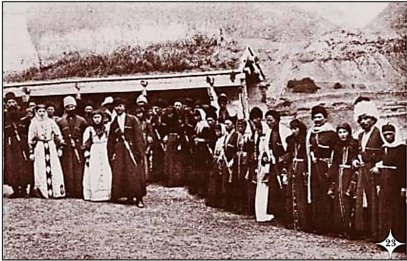
Fotoğraf 2: Sandırak Dansı, Kart-Curt, Şhaytı-Sırt, 1880 (Hotko, 2011: 423)