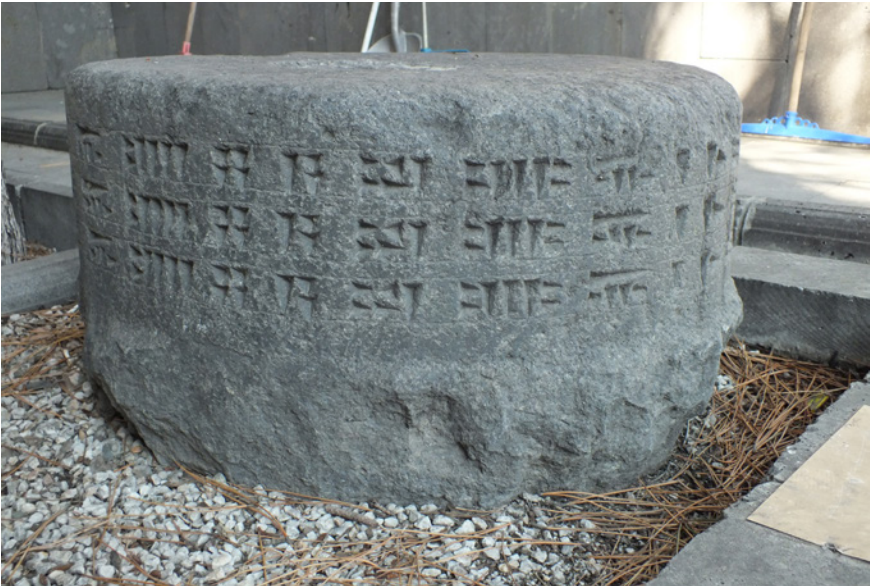
Fig.9- Van Müzesi'nde bulunan Aznavurtepe Kalesi'ne ait yazıtlı sütun kaidesi (Env. No. 38.1.4).