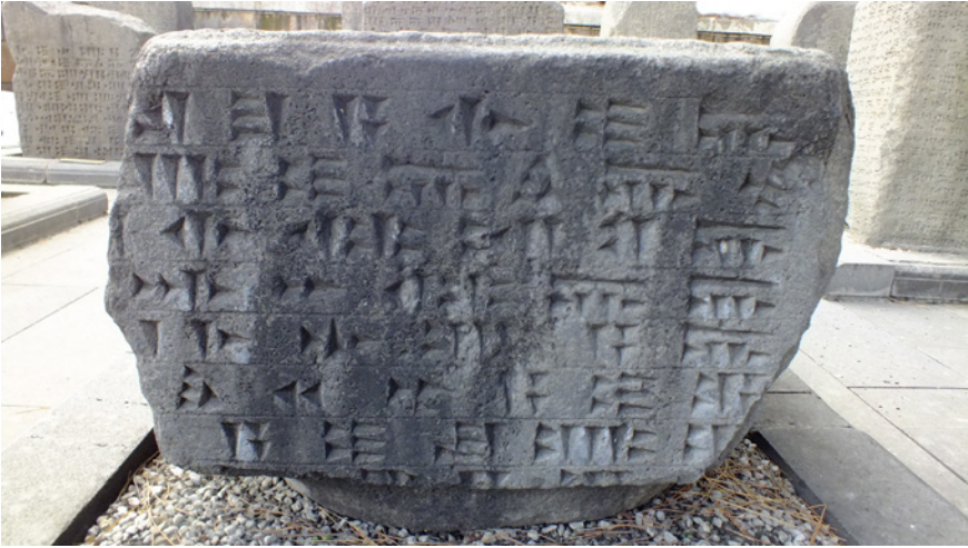
Fig.4- Van Müzesi'nde bulunan Aznavurtepe Kalesi É yapısı yazıtı (Env. No. 38.1.2).