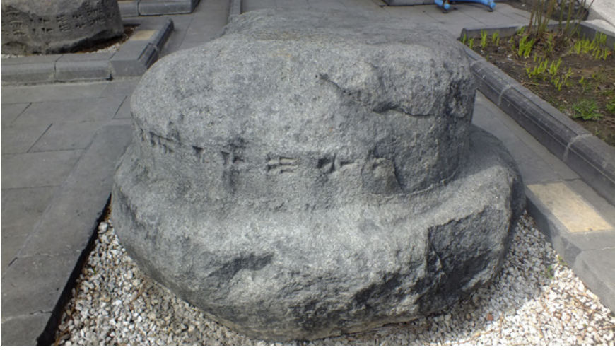
Fig.10- Van Müzesi'nde bulunan Aznavurtepe Kalesi'ne ait yazıtlı sütun kaidesi (Env. No. 38.1.5).