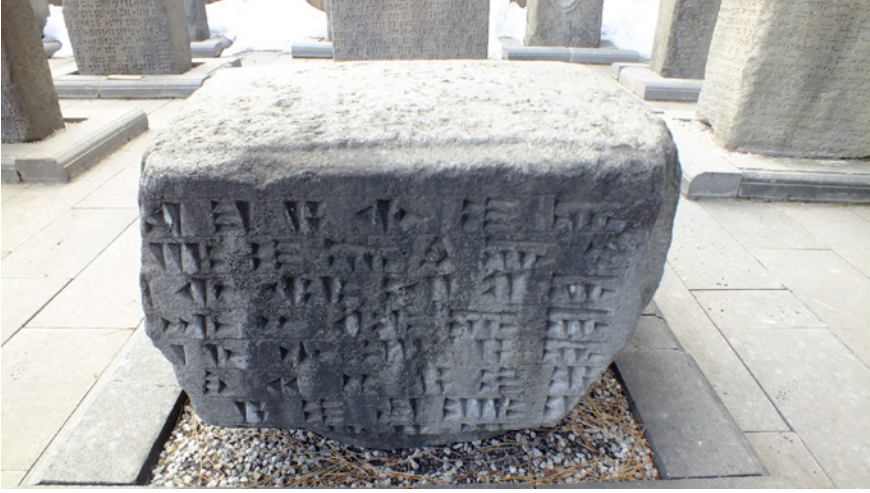
Fig.3- Van Müzesi'nde bulunan Aznavurtepe Kalesi É yapısı yazıtı (Env. No. 38.1.2).