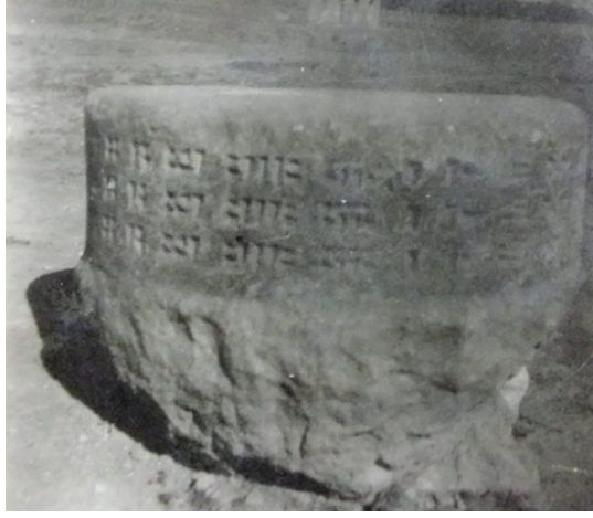
Fig.5- Van Müzesi Envanter Defteri'nde yer alan Aznavurtepe Kalesi É yapısına ait sütun kaidesi (Env. No. 38.1.4).