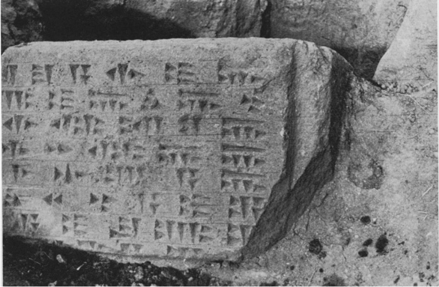
Fig.2- Kündig tarafından çekilerek Werner'e verilen Aznavurtepe Kalesi Ê yapısı yazıtı (Werner 1954: Abb.3).