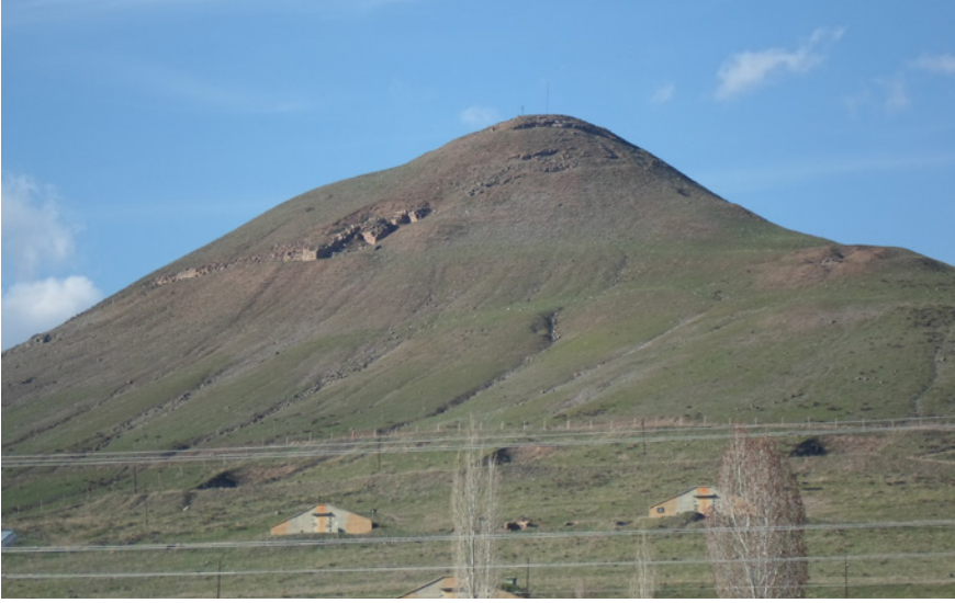
Fig.1- Aznavurtepe Kalesi'nden bir görünüm.