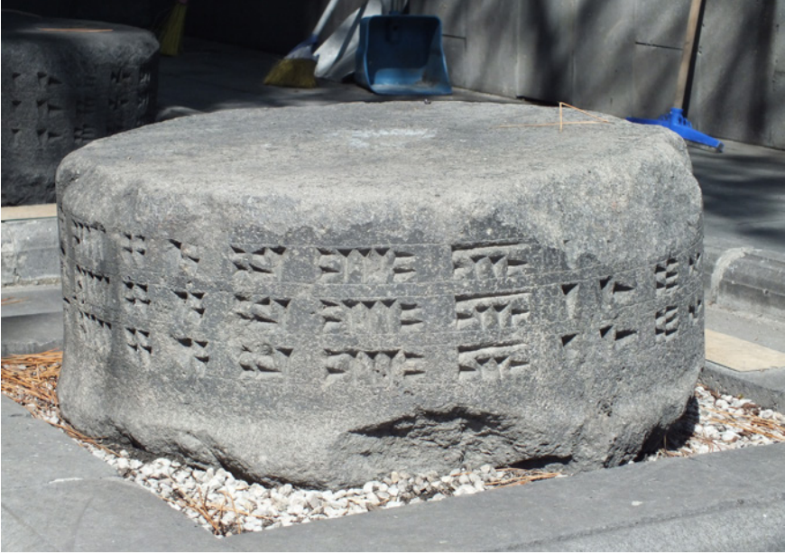
Fig.8- Van Müzesi'nde bulunan Aznavurtepe Kalesi'ne ait yazıtlı sütun kaidesi (Env. No. 38.1.3).