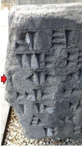
Fig.6- Van Müzesi'nde bulunan Aznavurtepe Kalesi É yapısı yazıtının sol kenarındaki kırık yer (Env. No. 38.1.2).