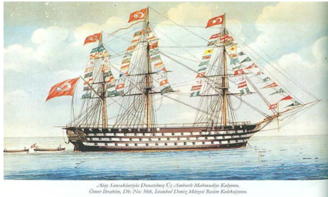
Resim 3: Dünyanın en büyük kalyonu Mahmudiye Kalyonu