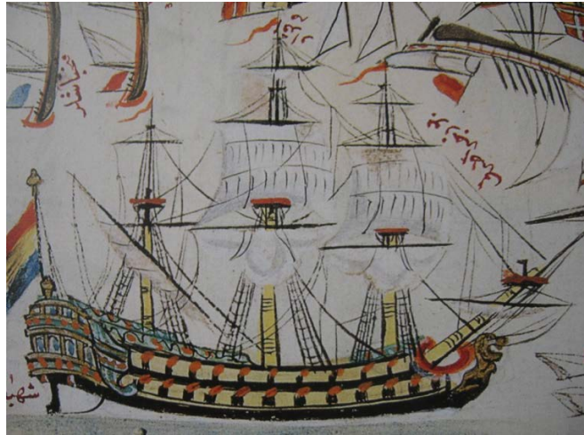
Resim 2: Şehbâz-ı Bahri Kalyonu