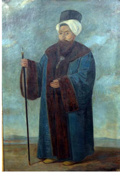
Resim 1: Küçük Hüseyin Paşa, Deniz Müzesi Arşivi, no: 1111