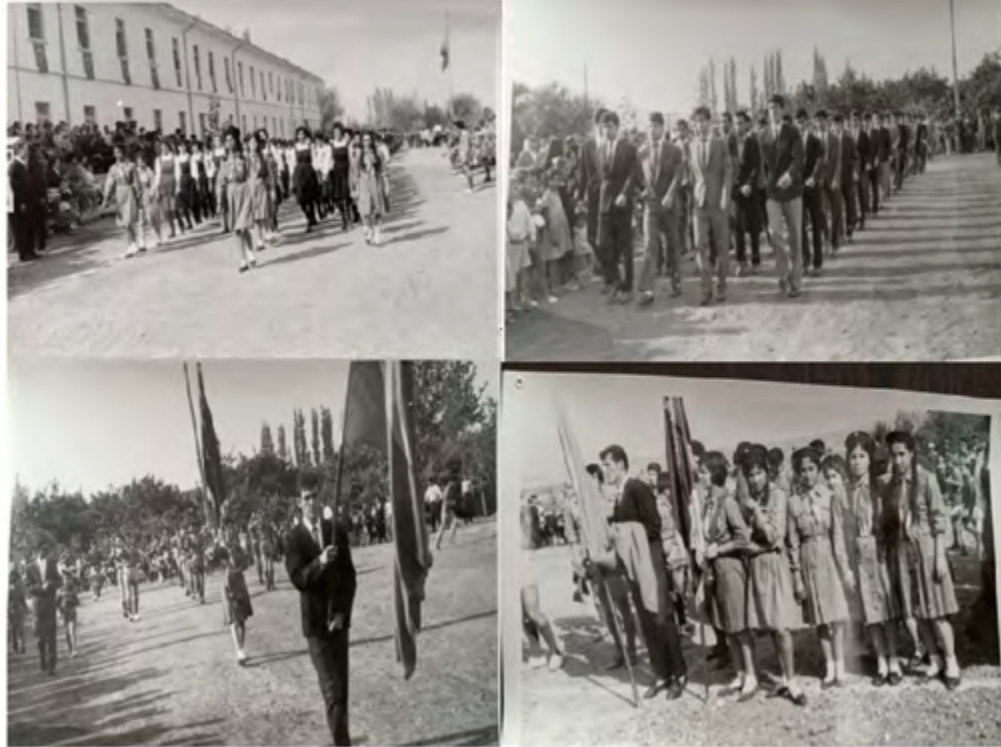
Resim 5. 29 Ekim 1962 Cumhuriyet Bayramı Töreninden