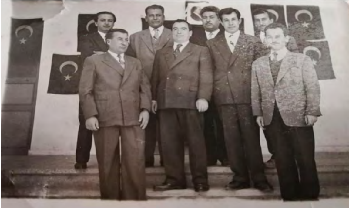
Resim 3. Osmaniye Özel Lisesi'nin İlk Açılışındaki Yönetim Kurulu (Kaynak: Arı, 2023)