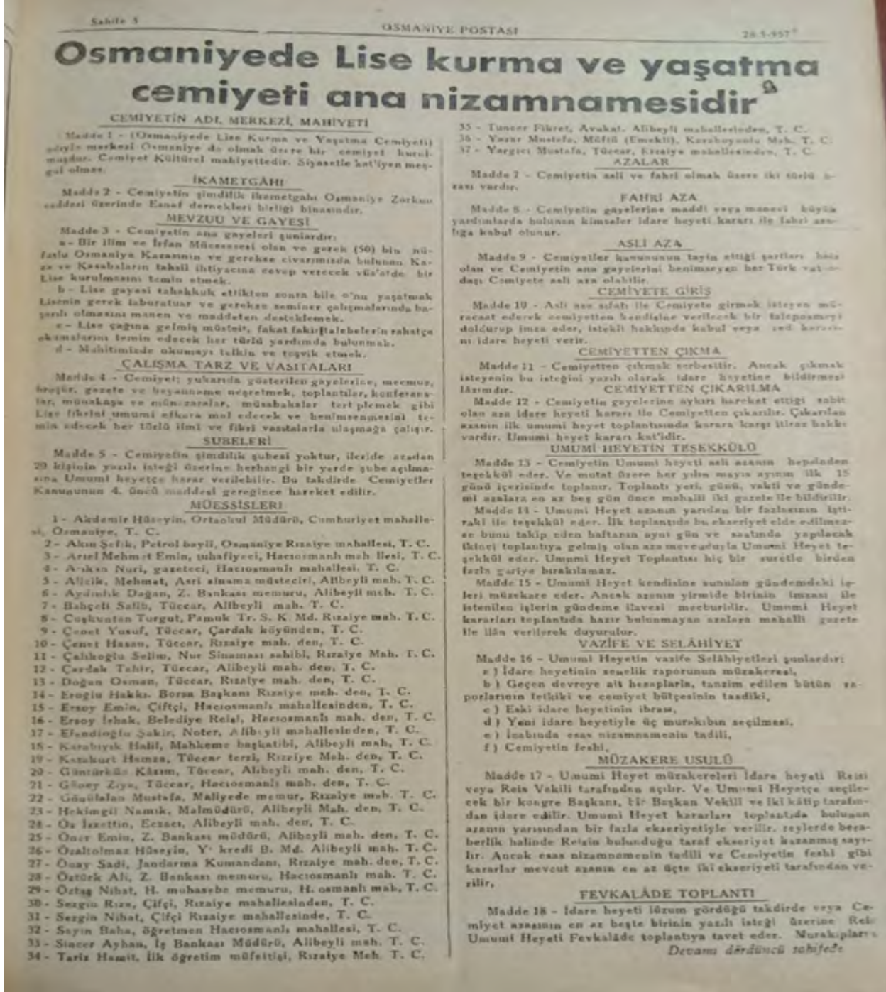
Resim 1. Osmaniye'de Lise Kurma ve Yaşatma Derneği (Cemiyeti) Ana Nizamnamesi