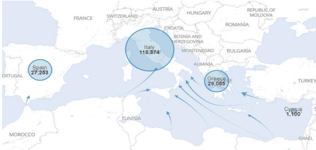
řekil 1: Sayılarla Avrupa’ya G Yolları

Suriye’de yařanan i atıřmanın bařlangıcından bu yana artan kresel sınır uygulamasına raėmen, bir milyondan fazla Suriyeli vatandař, sığınma talebinde bulunmak iin Avrupa’ya ulařmayı bařarmıřtır. Sığınmacıları alan bařlıca Avrupa lkeleri Almanya, Sırbistan ve Kosova (% 62) olmuř ve bu lkeleri İřve, Macaristan, Avusturya, Hollanda, Danimarka (% 26) ve diėer lkeler (% 11) takip etmiřtir (Denaro, 2016, 78).