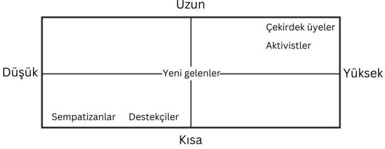
Şekil 2: Bağlılık Seviyesine Göre Radikal Tipolojileri ve Süreç (Rabasa vd., 2010: 26).

Radikalleşme ve terörizm çalışmalarında gözden kaçırılan bir diğer konu ise bireyin örgüte bağlılığının artması sürecinde örgüt içerisinde fiziksel ve psikolojik olarak belirli yetiler elde etmesidir. Bu yetiler arasında silah kullanımı gibi fiziksel beceriler ile ideolojik eğitim, zihinsel dayanıklılık ve grup bağlılığını artıran psikolojik yetenekler bulunmaktadır (Horgan, 2009a: 265; Bjørgo, 2011: 284). Psikoloji noktasında terör örgütü mensuplarının radikalleşmeden arındırılması süreçlerinde iki düzey öne çıkmaktadır. Bunlardan ilki kişinin mensubu olduğu terör örgütü düzeyi, diğer bir deyişle grup düzeyiyken, diğeri ise örgüt mensubunu içine alan bireysel düzeydir. Radikalleşme ve radikalleşmeden arındırma çoğunlukla psikoloji bakış açısıyla ilgili olduğundan, bu iki düzeyi psikolojik arka planlarıyla ele almak gerekmektedir.